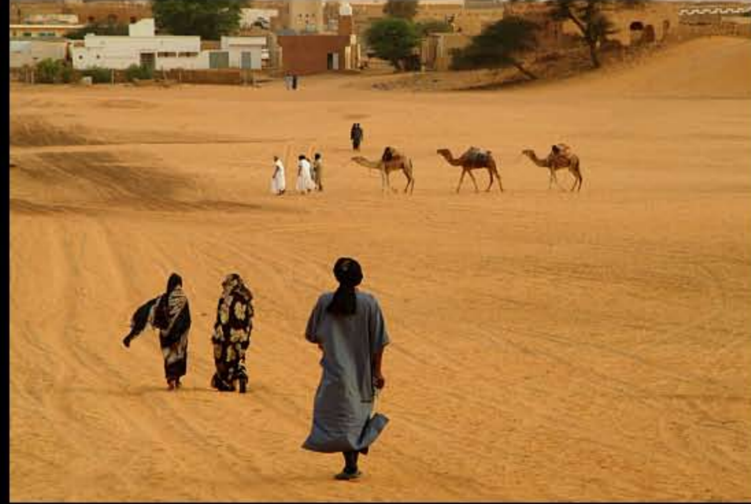
Maurit, Adrar, Cinguetti 152