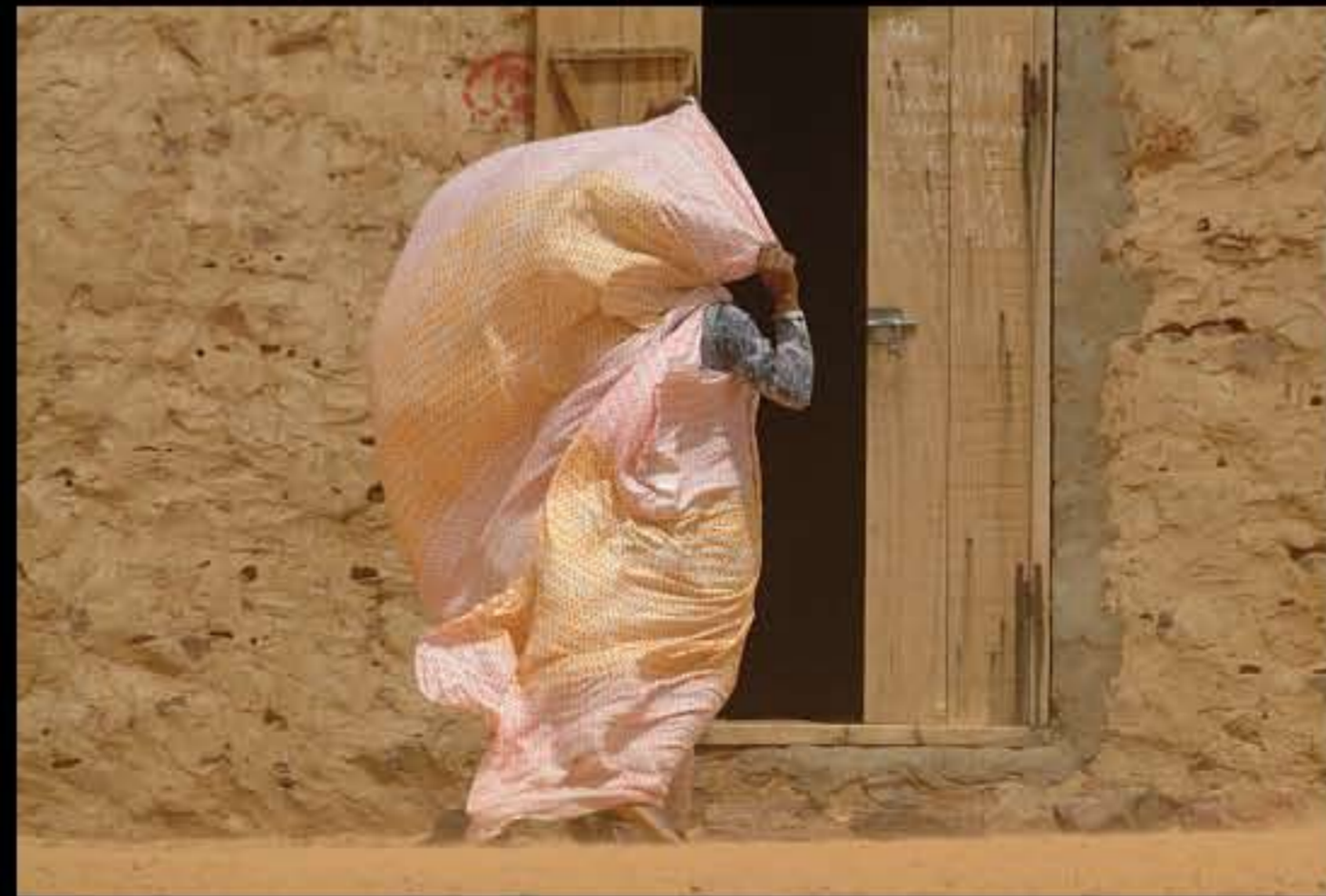
Maurit, C3 Ain Sevra, 144