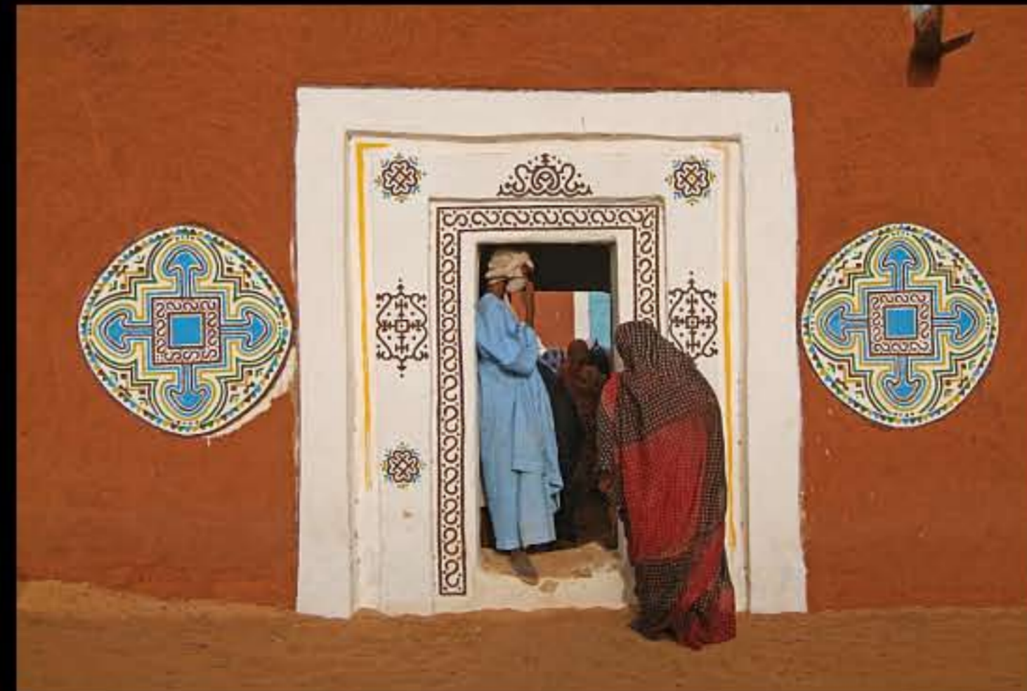
Maurit, C34 Oualata 269