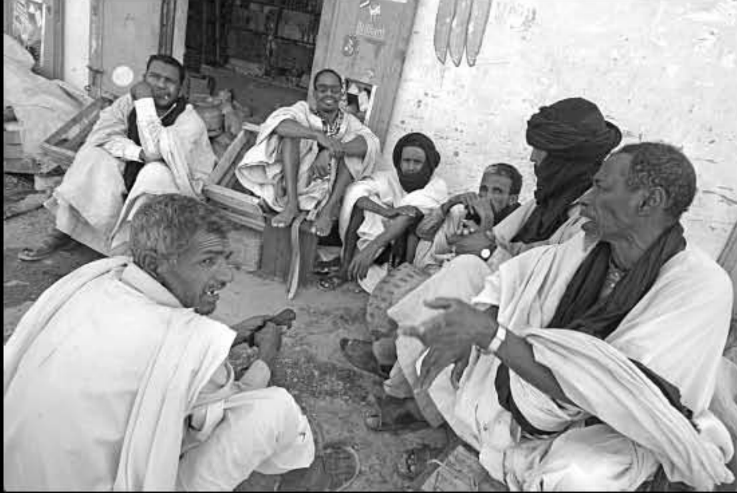
Maurit, Adrar, Atar 012