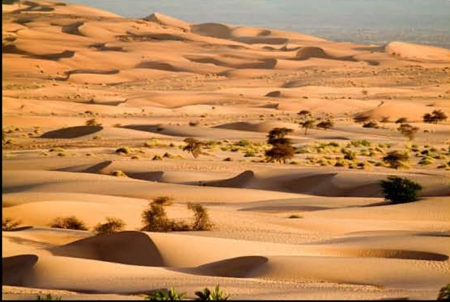
Maurit, Adrar, Amatlich, Medah, 018