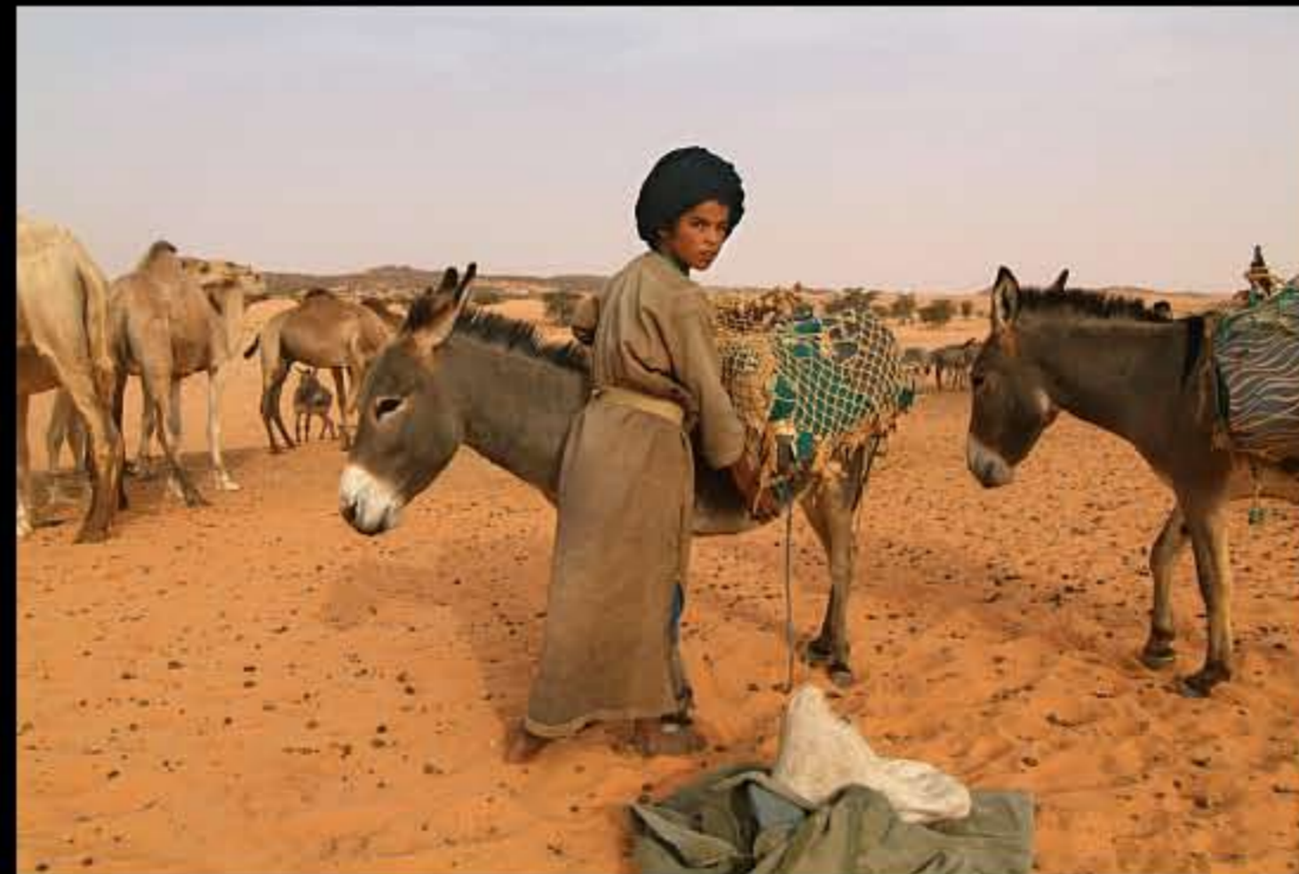
Maurit, C5 Wadi Rachid 032