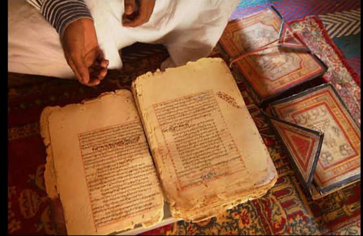
Maurit, Adrar, Chinguetti, library Ehel Hamoni 144