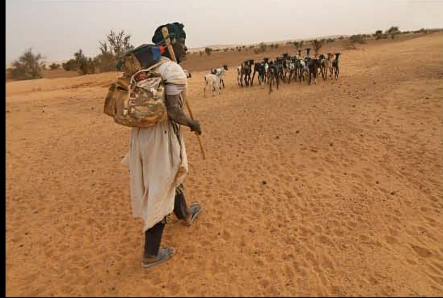
Maurit, C4 Wadi Khott, nomads 076