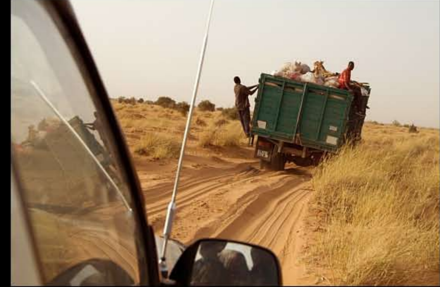
Maurit, C 32, trasporto sale 006