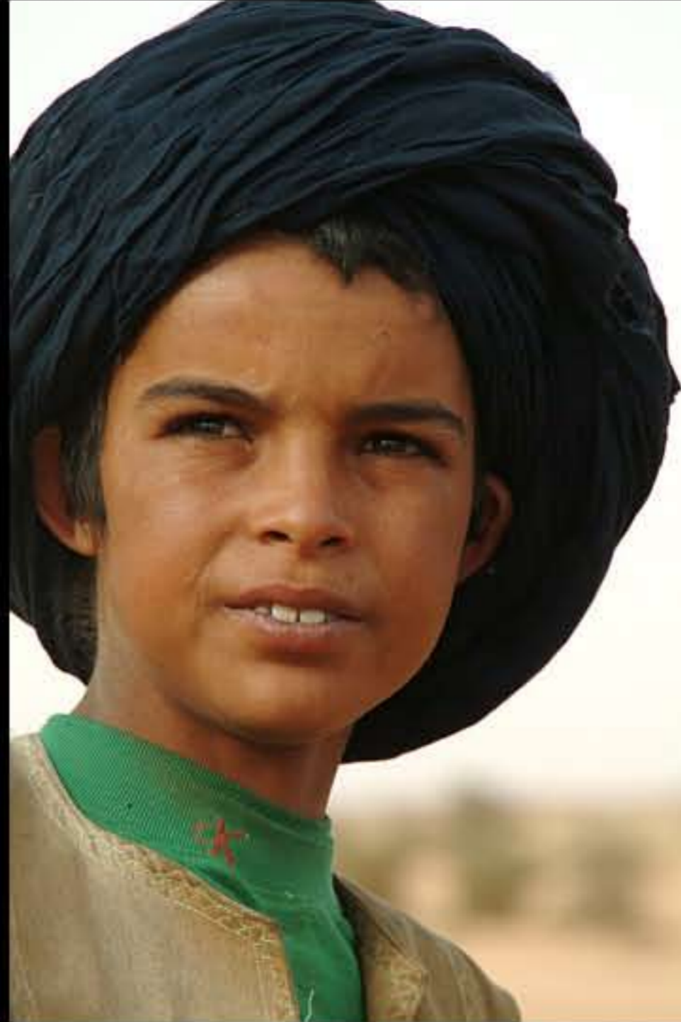
Maurit, C5 Wadi Rachid 094