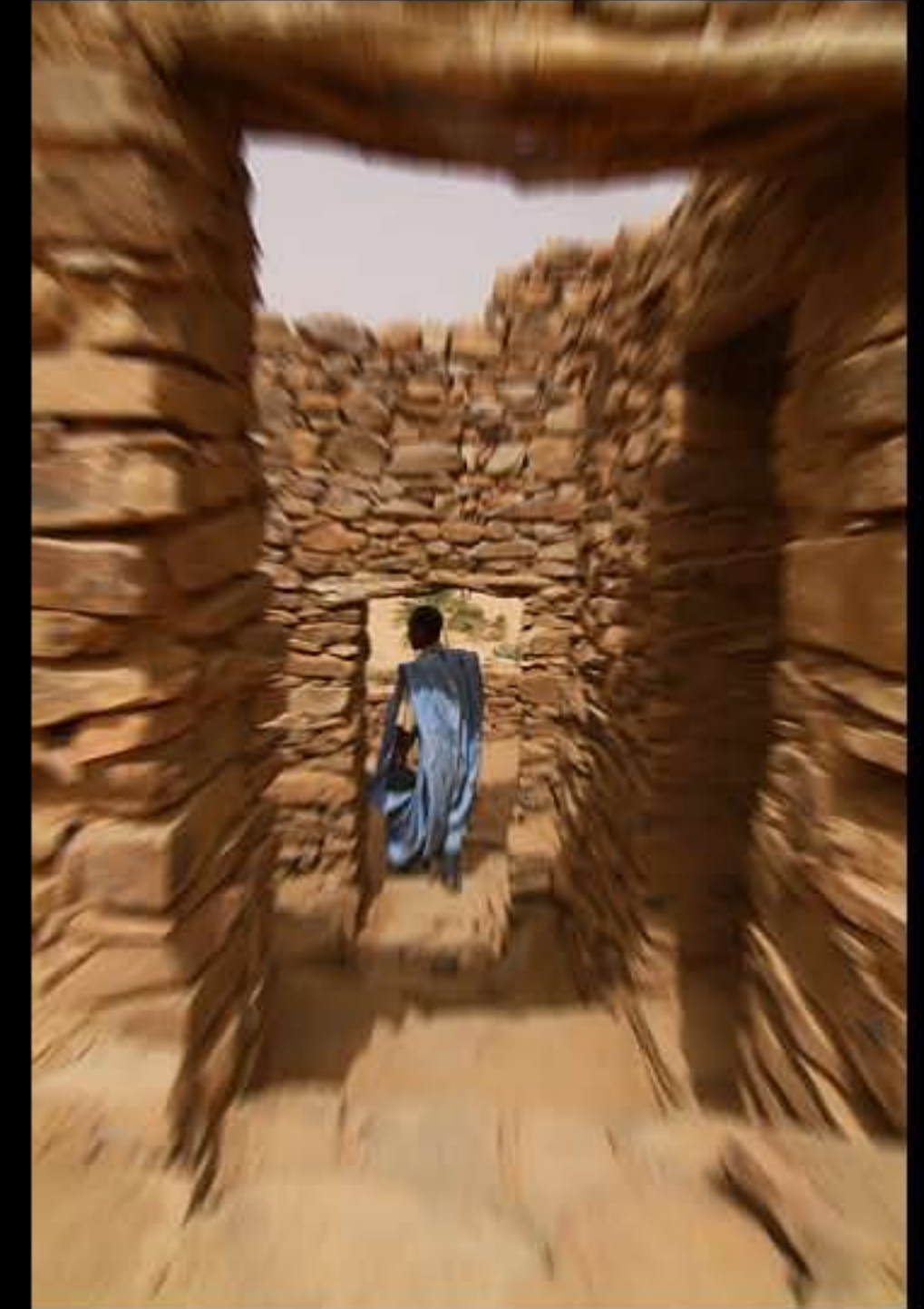
Maurit, Adrar, Ouadane, 197