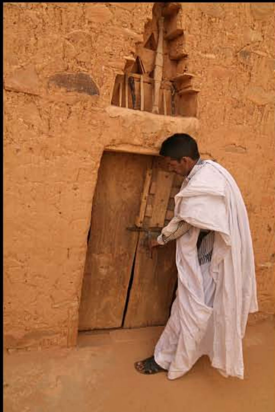
Maurit, Adrar, Chinguetti, library Ehel Hamoni 170