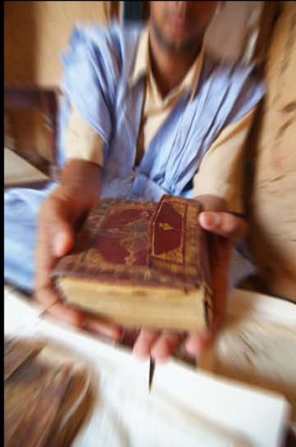
Maurit, Adrar, Ouadane, library Khetta 132