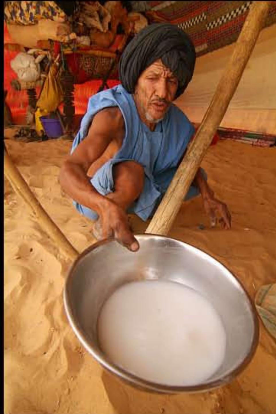
Maurit, C28 Mouélichie, nomads 013