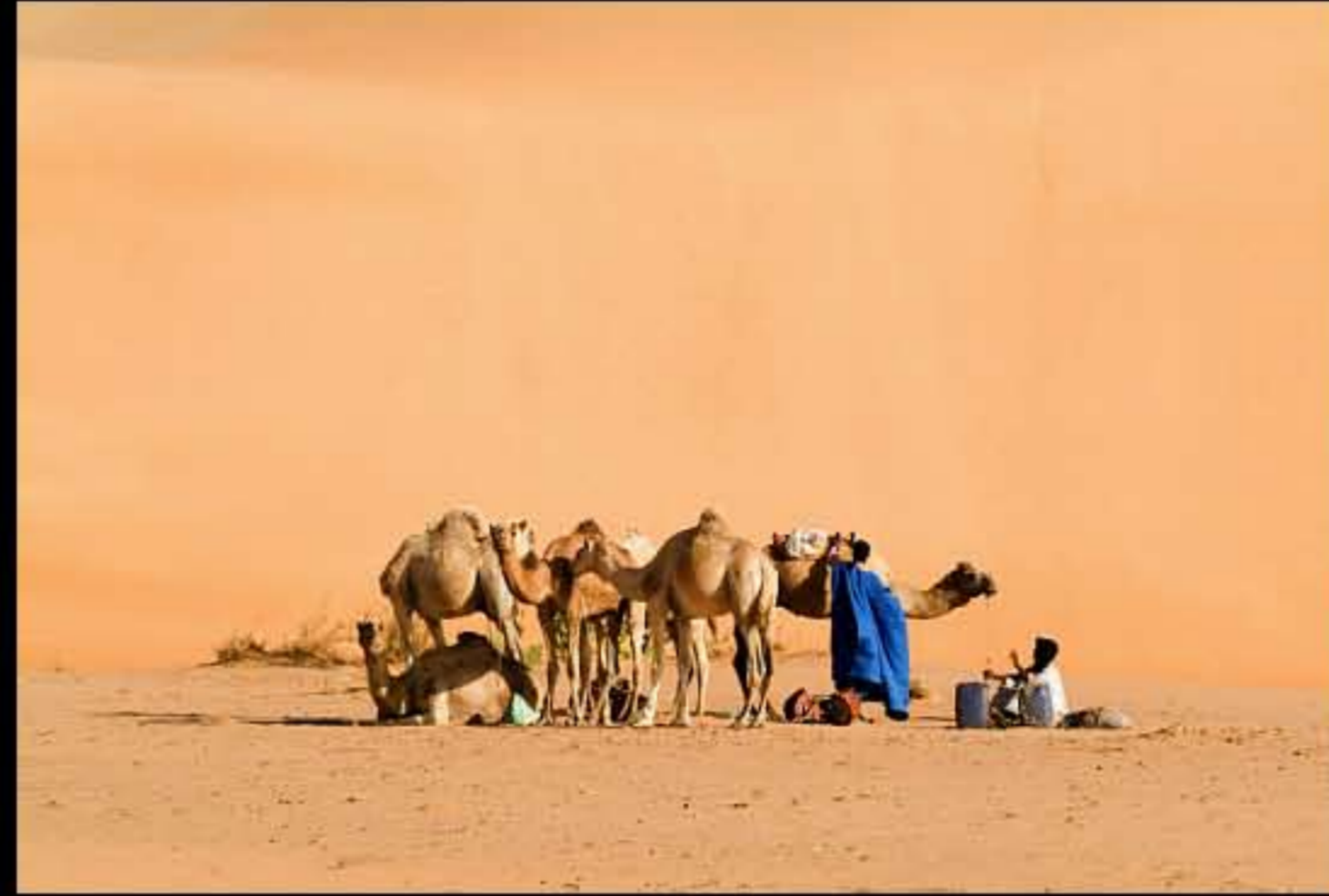
Maurit, Adrar, Amatlich, 074