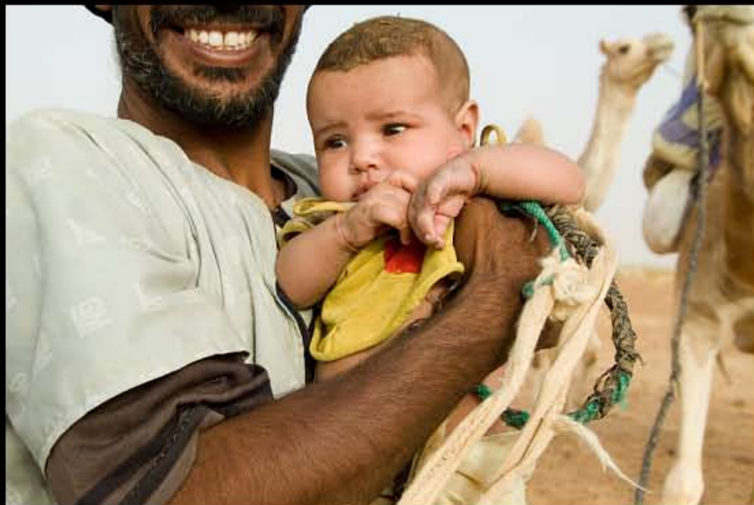
Maurit, C25 El Zeh, nomads 012