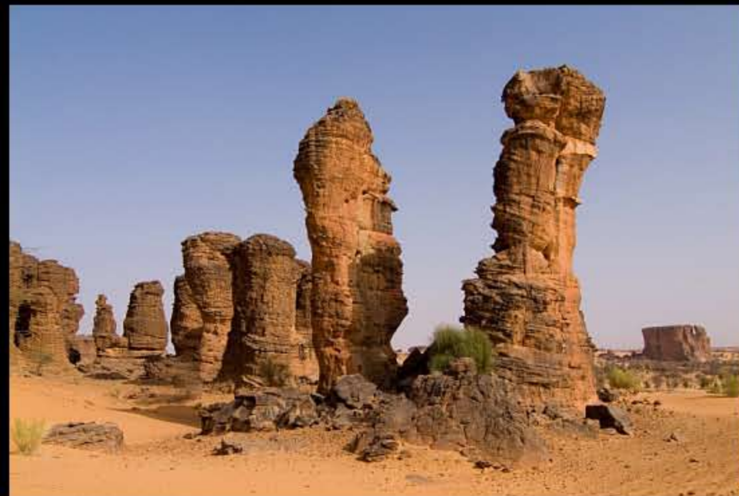
Maurit, Route Espoir Ayoun, Gelb Inimish 082