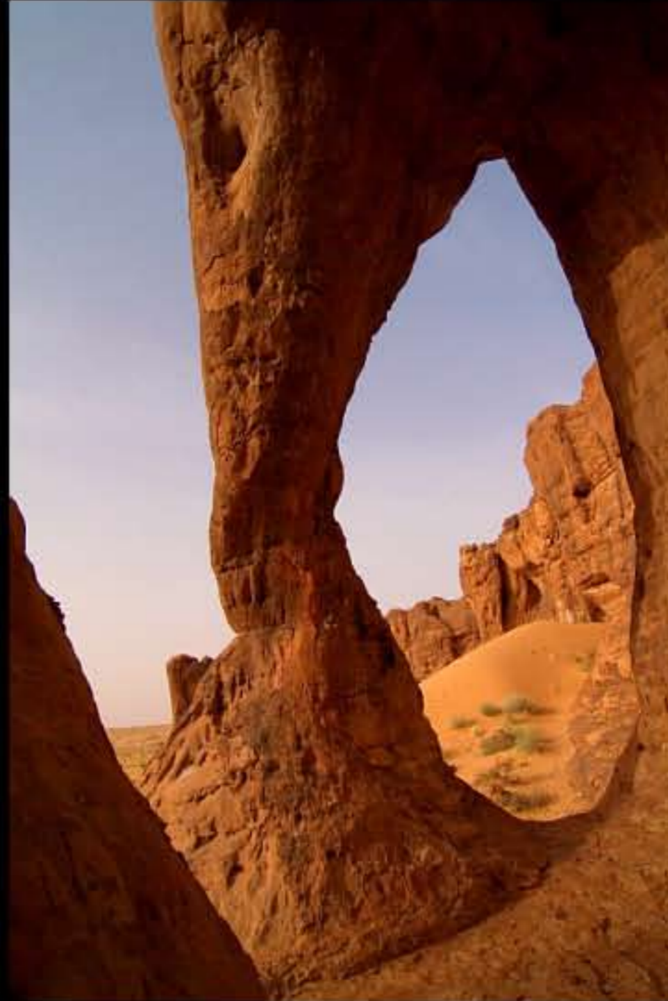
Maurit, C24 El Makhlouga 039