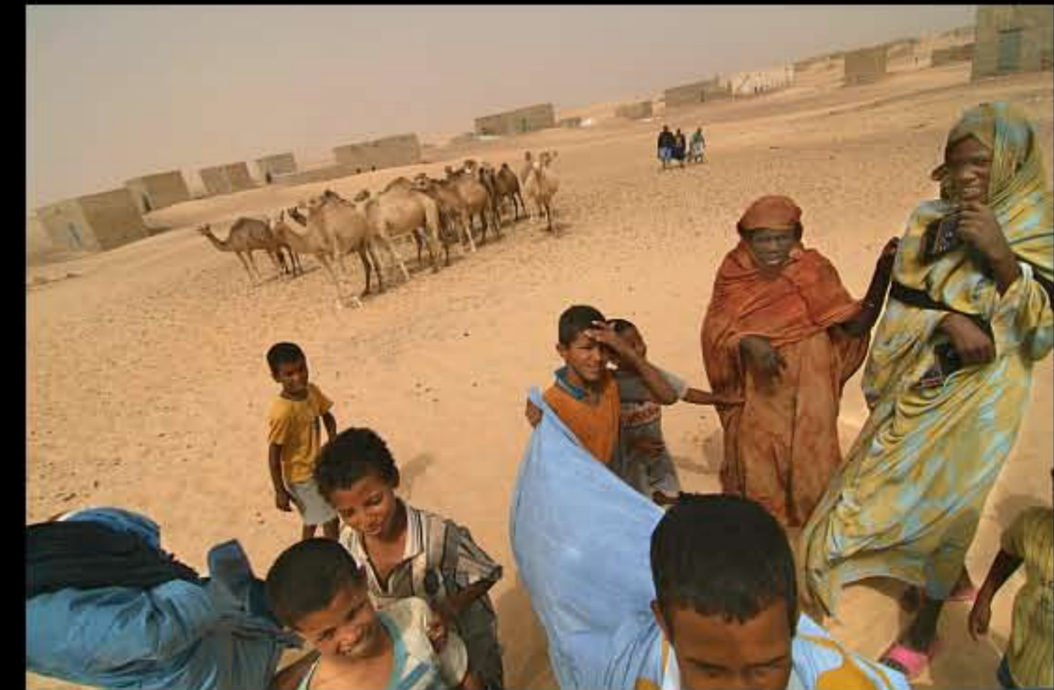
Maurit, C19 Akreijit 027