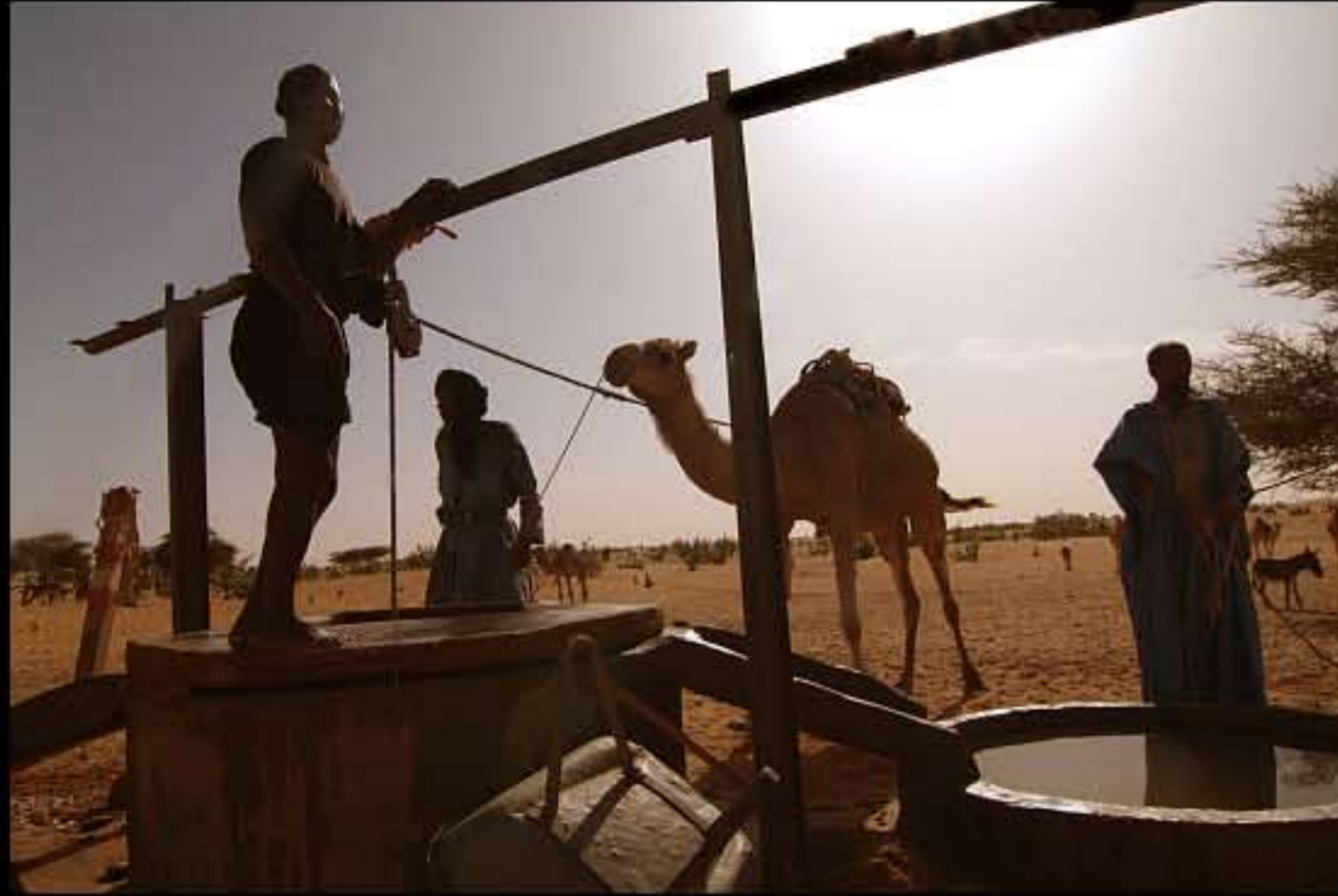
Maurit, C9 Diawgui well 034