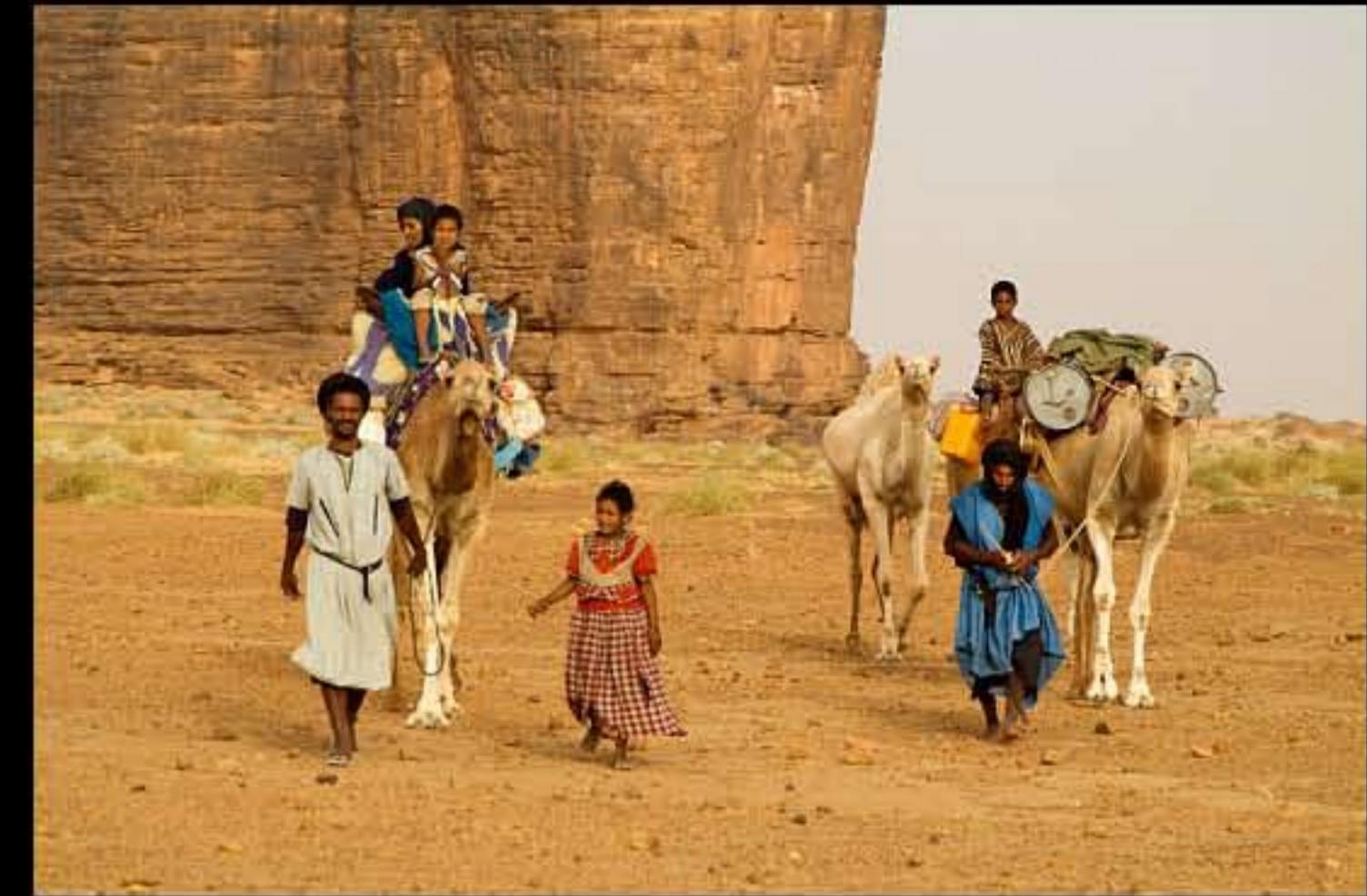
Maurit, C25 El Zeh, nomads 006