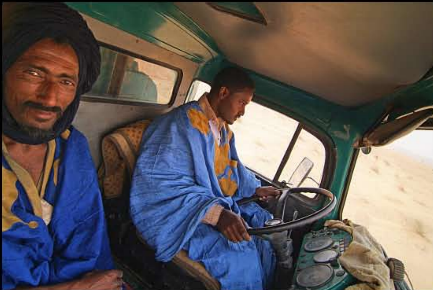
Maurit, C 32, trasporto sale 001