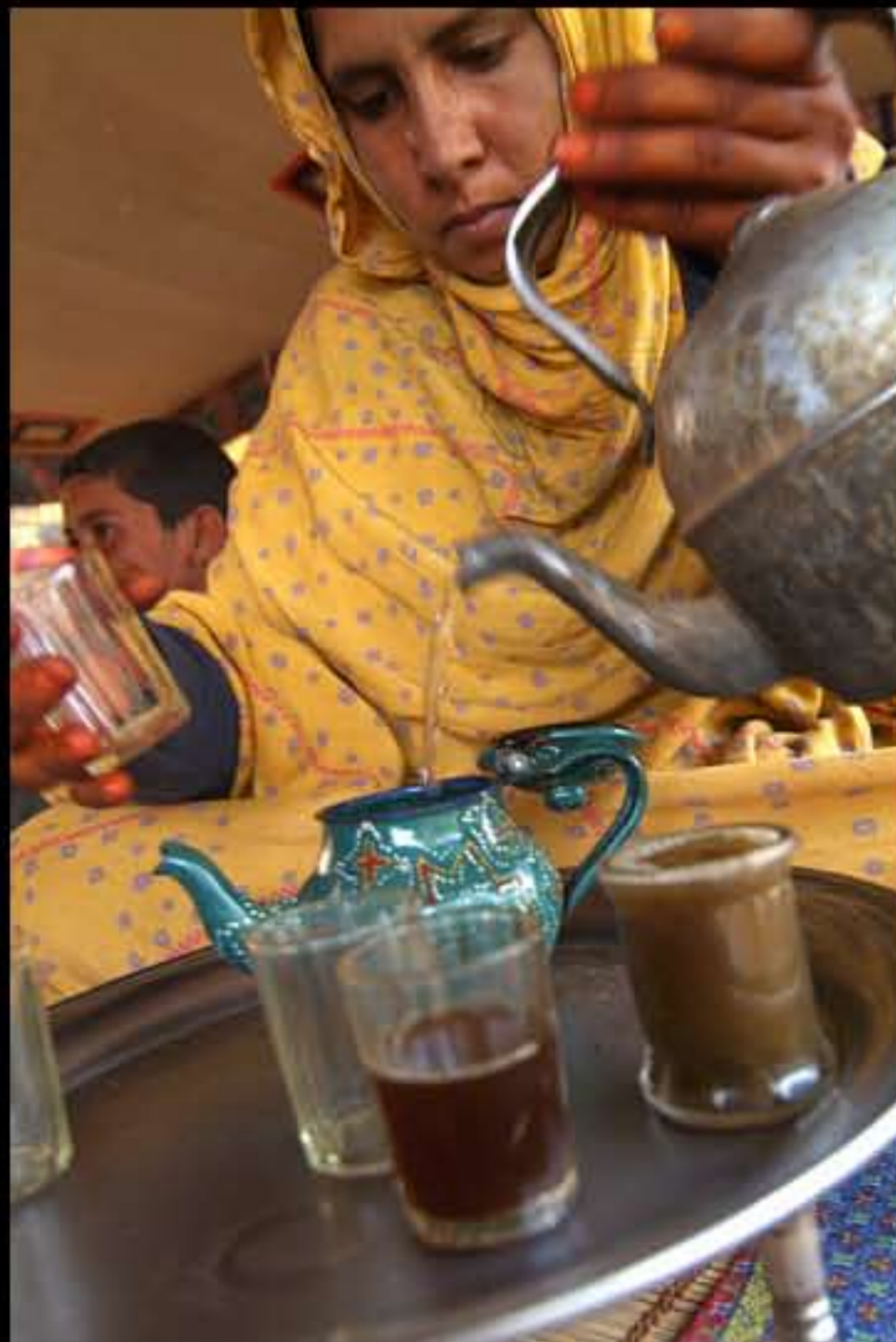
Maurit, C1 Adrar, Ez Zerga, nomads 035