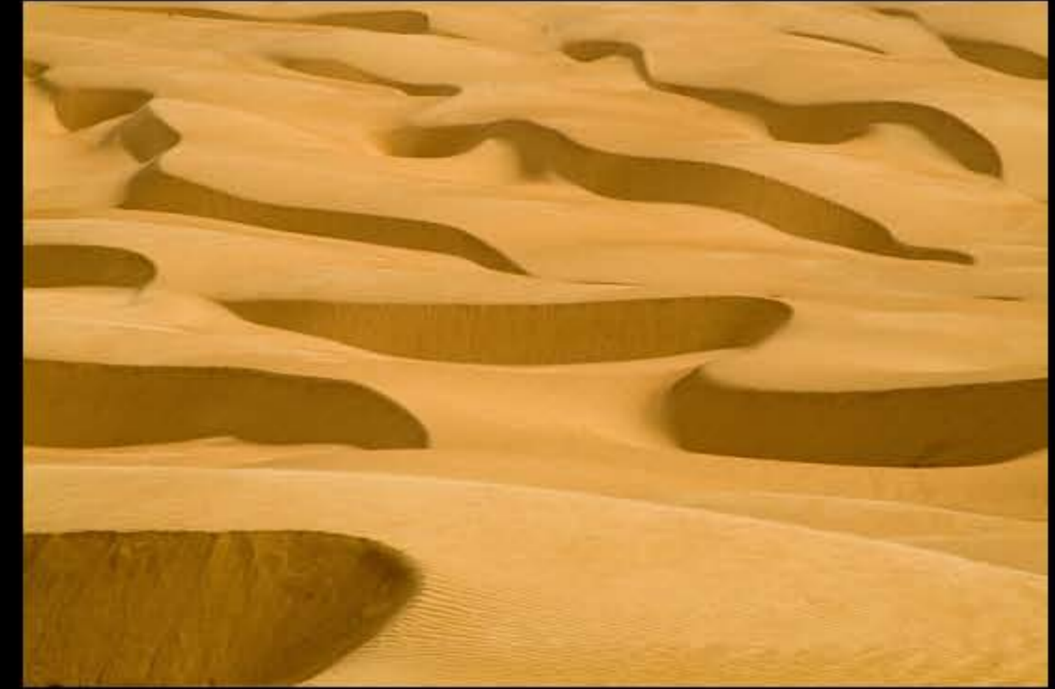
Maurit, C2 Ain Sevra, north 019