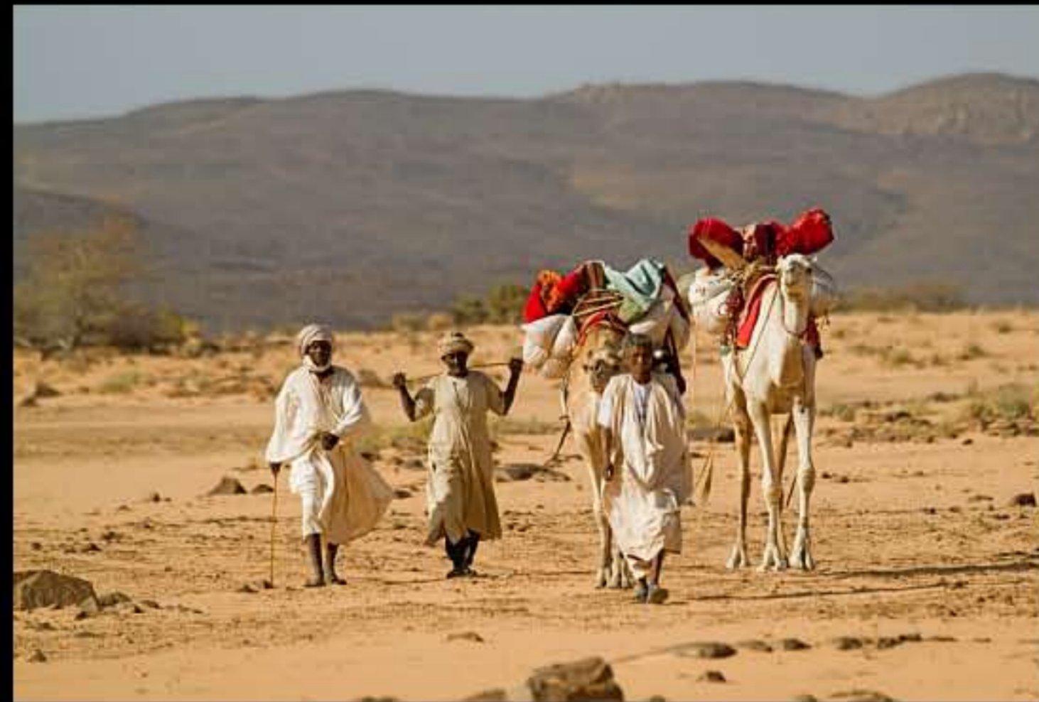
Maurit, Adrar, Amatlich, caravan 015