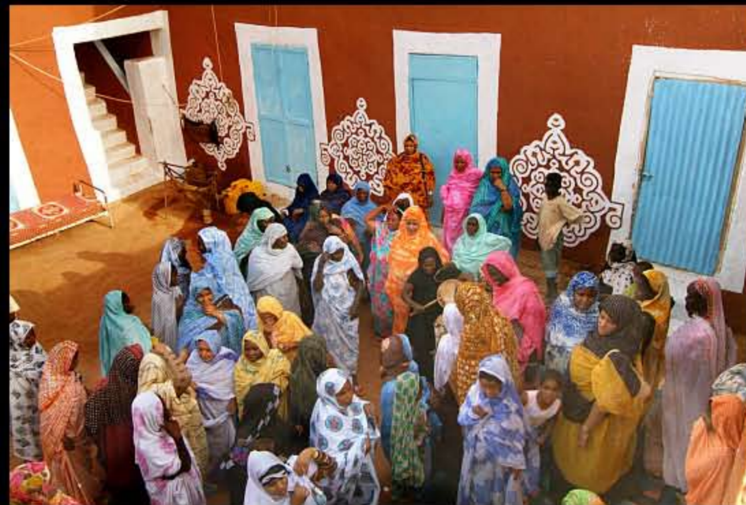
Maurit, C34 Oualata, wedding 003