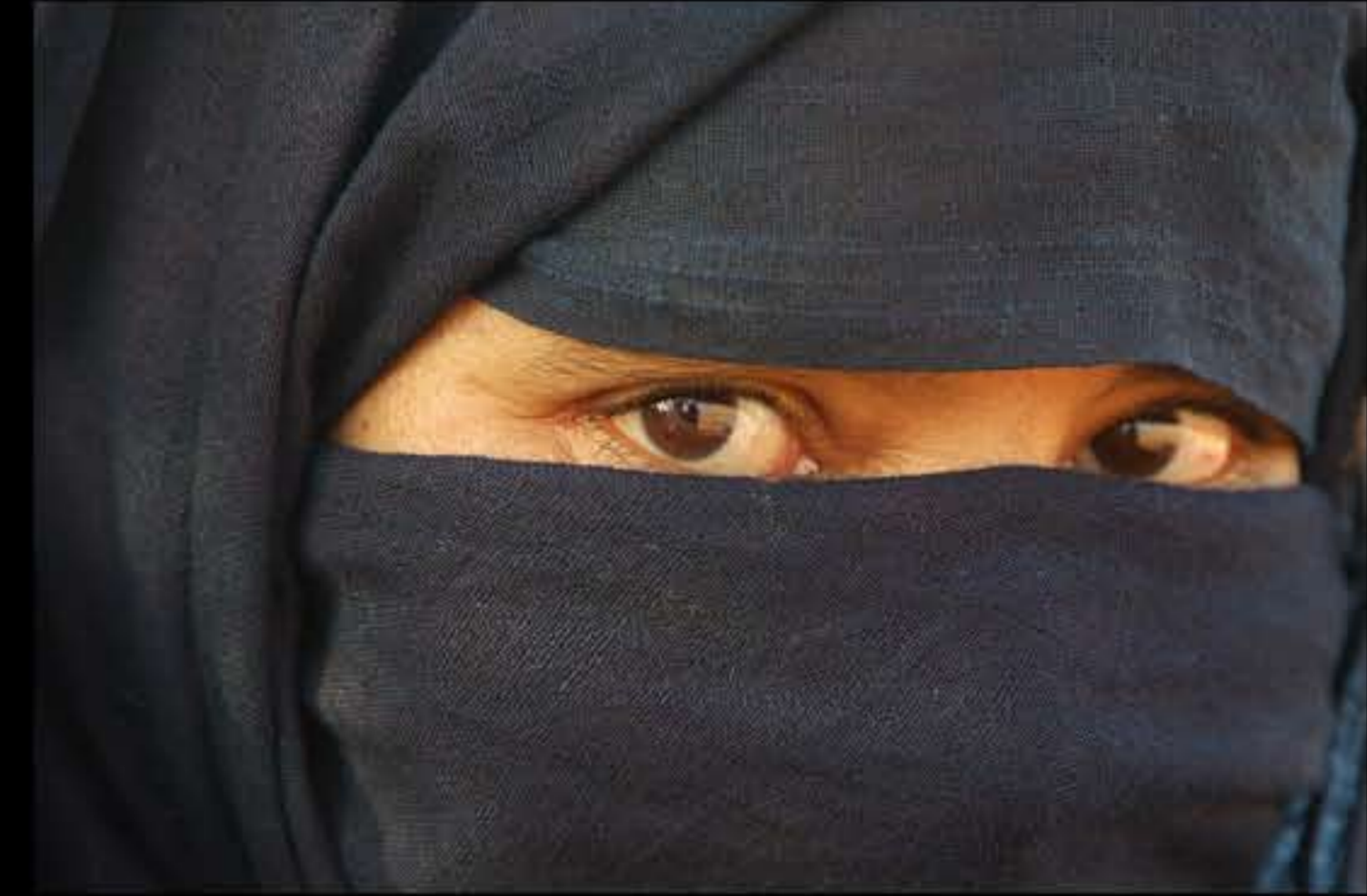
Maurit, Adrar, Amatlich, 096