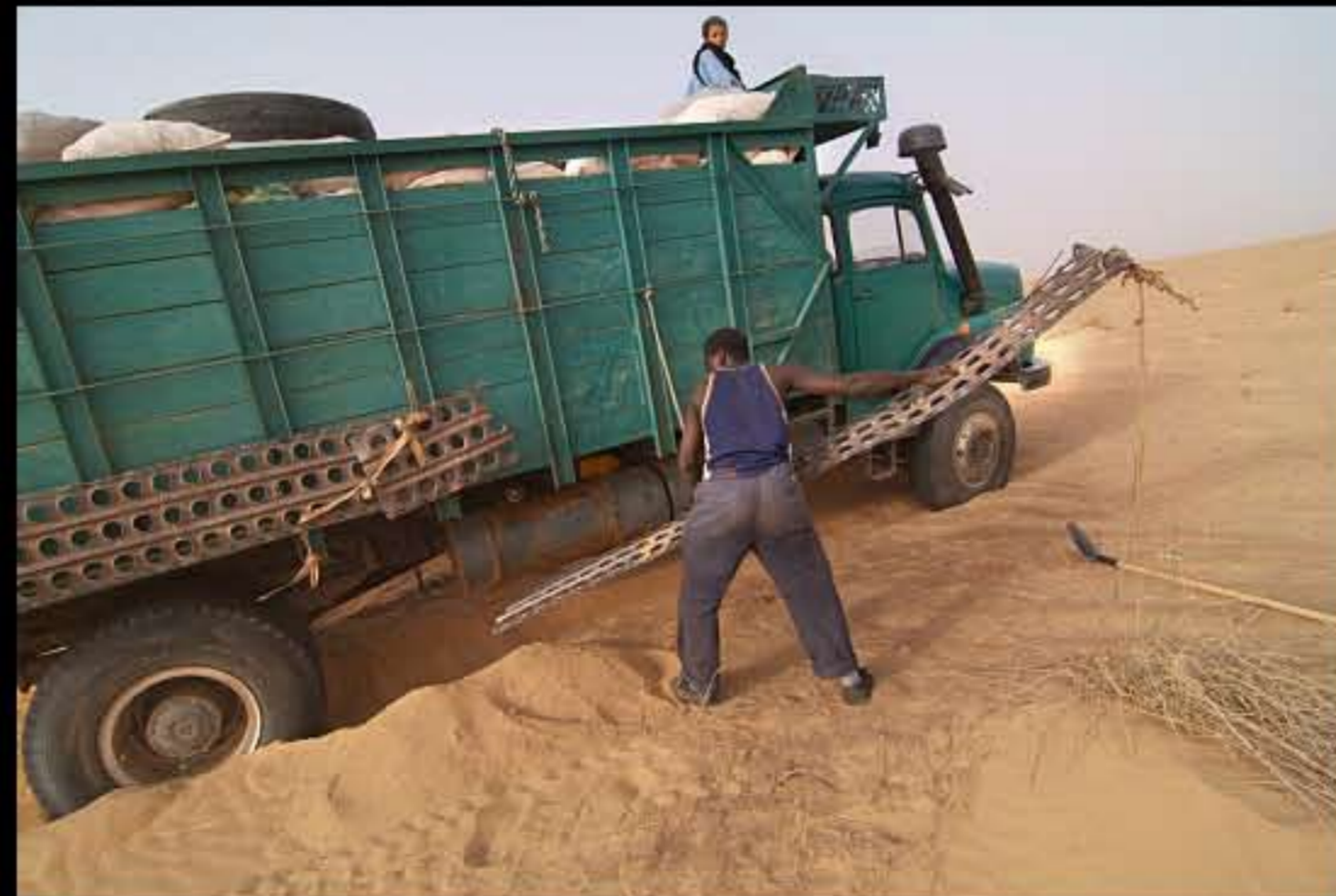
Maurit, C 32, trasporto sale 002