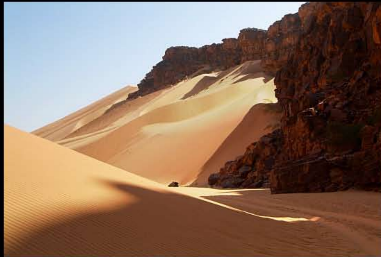
Maurit, Adrar, Amatlich, Tivoujone pass 030