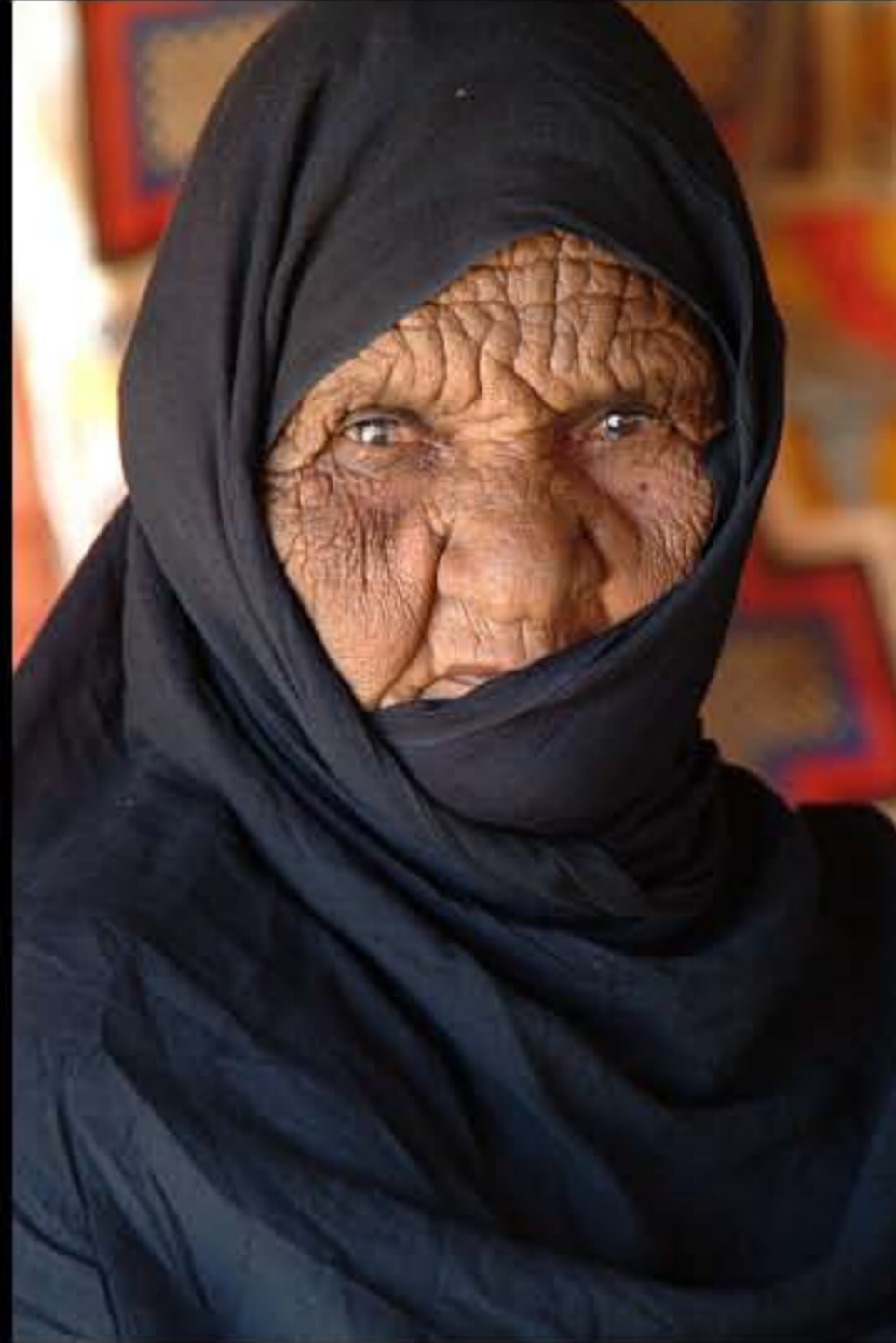
Maurit, Adrar, Amatlich, nomads, 013