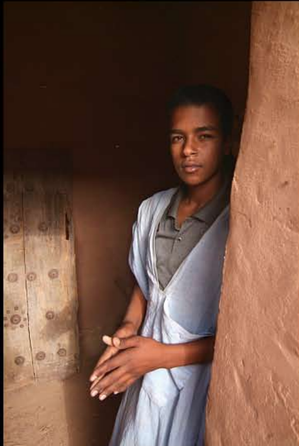
Maurit, C17 Tichitt 135