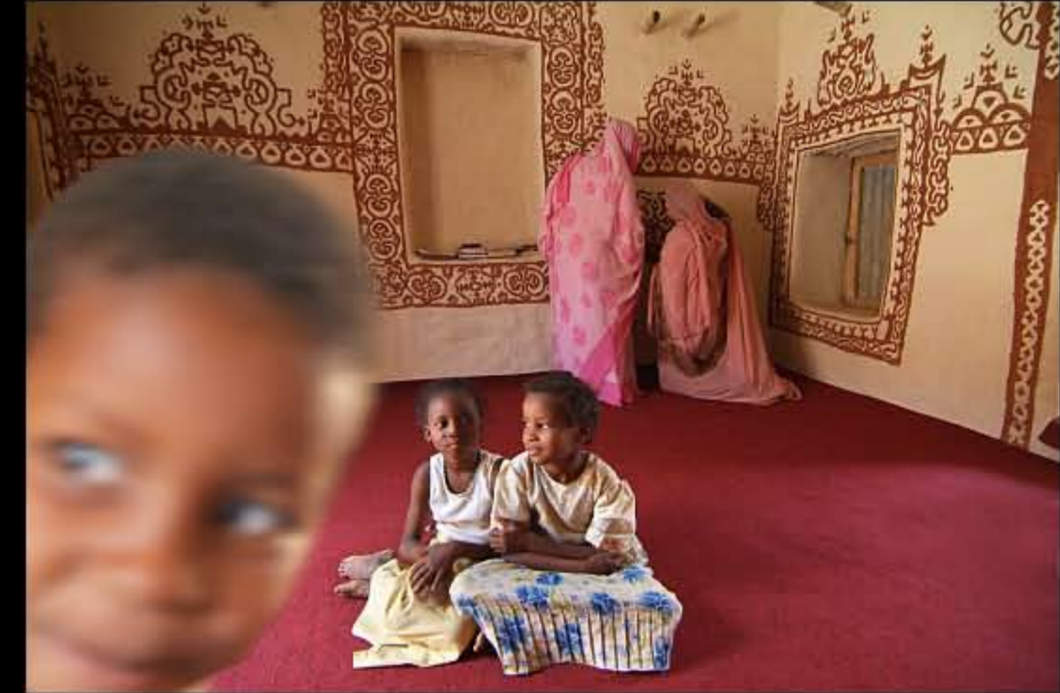
Maurit, C34 Oualata 150