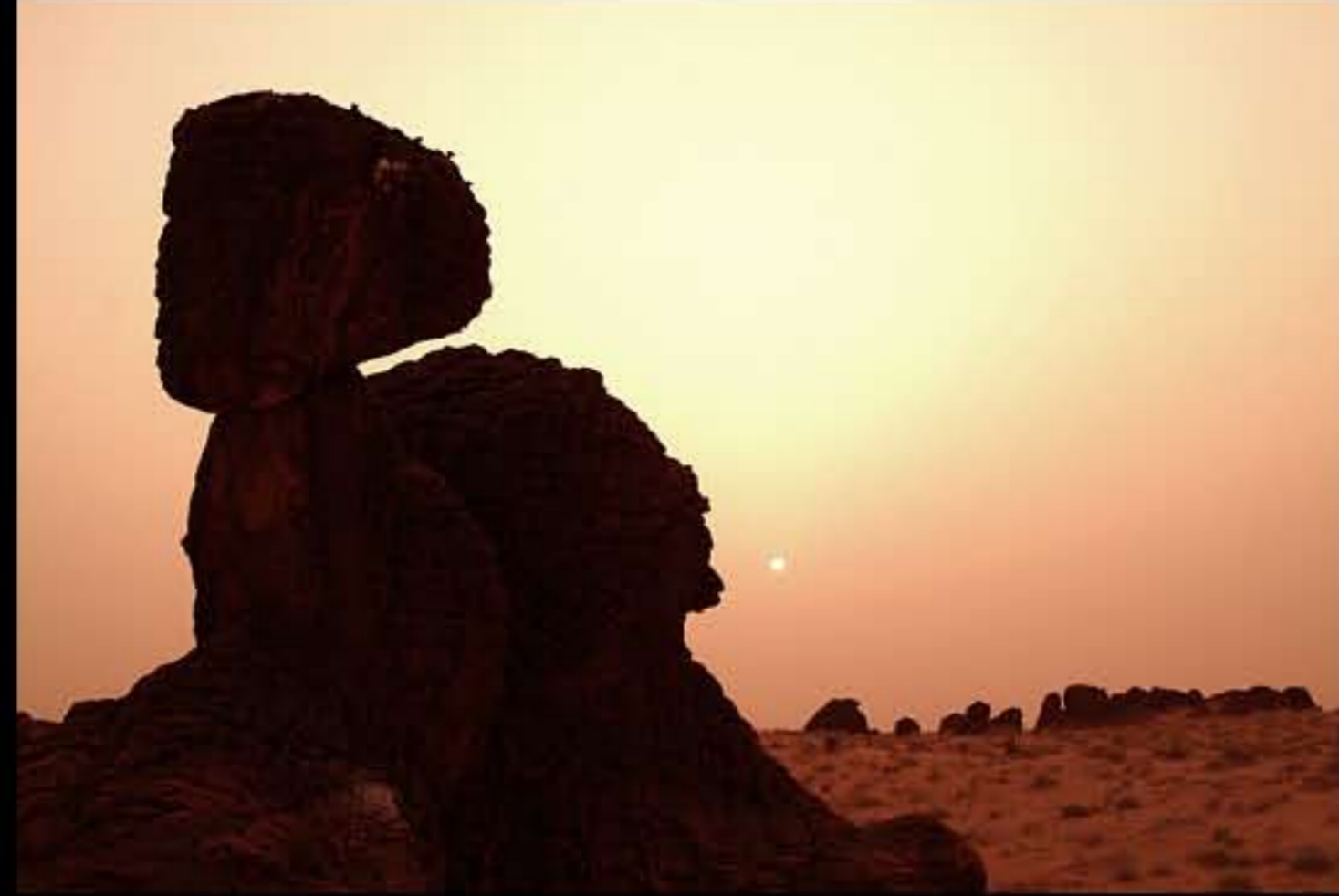
Maurit, C26 El Sba 034