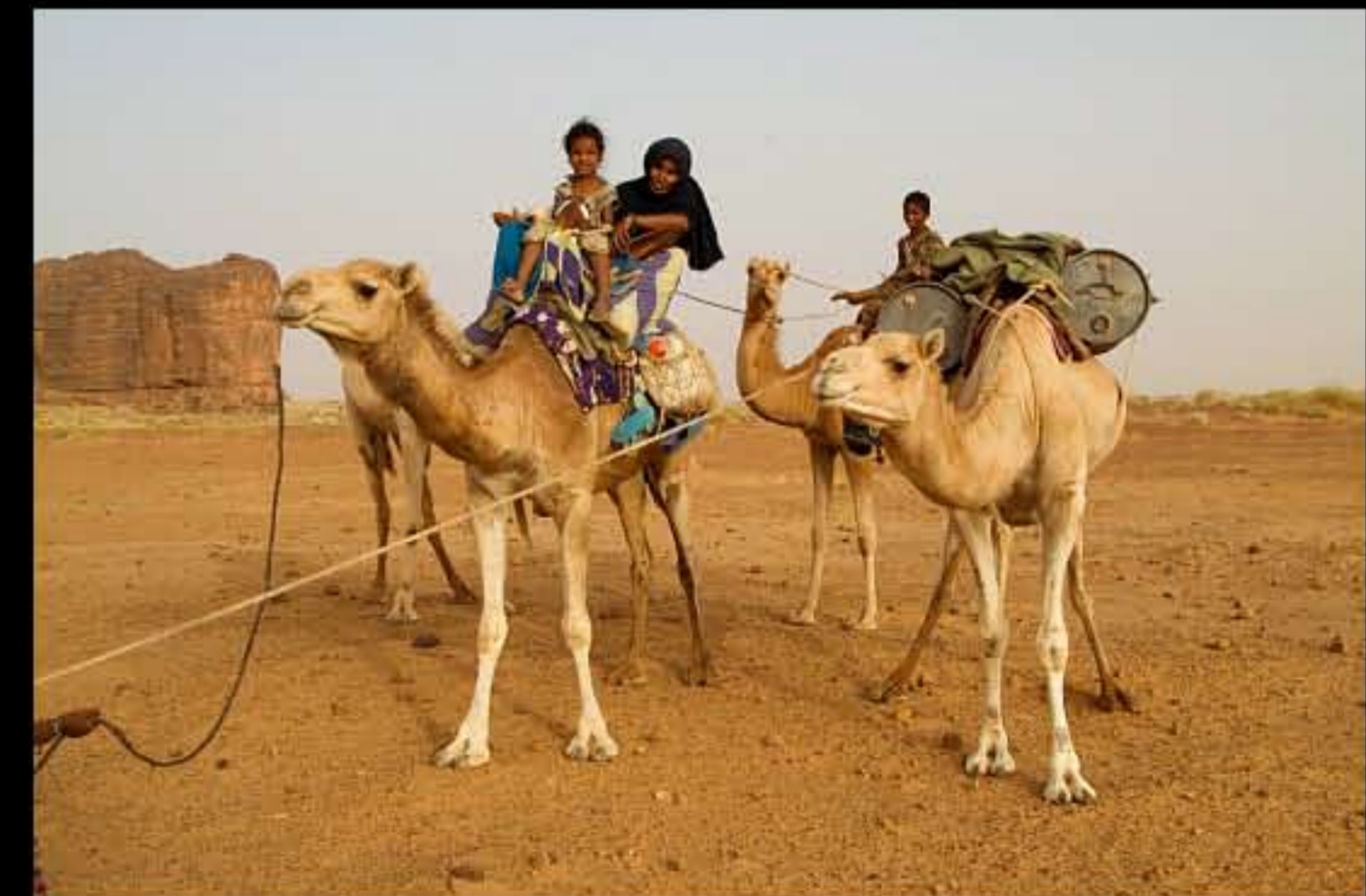
Maurit, C25 El Zeh, nomads 015