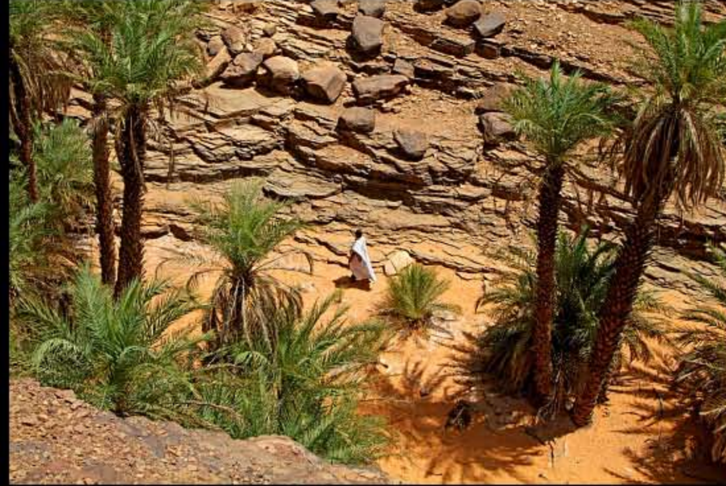
Maurit, Adrar, Terjit oasis 043