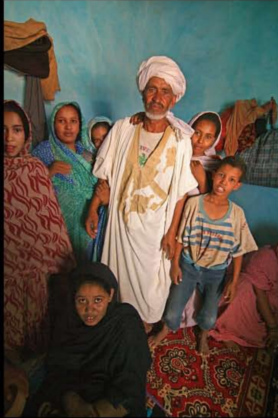
Maurit, C19 Akreijit 059