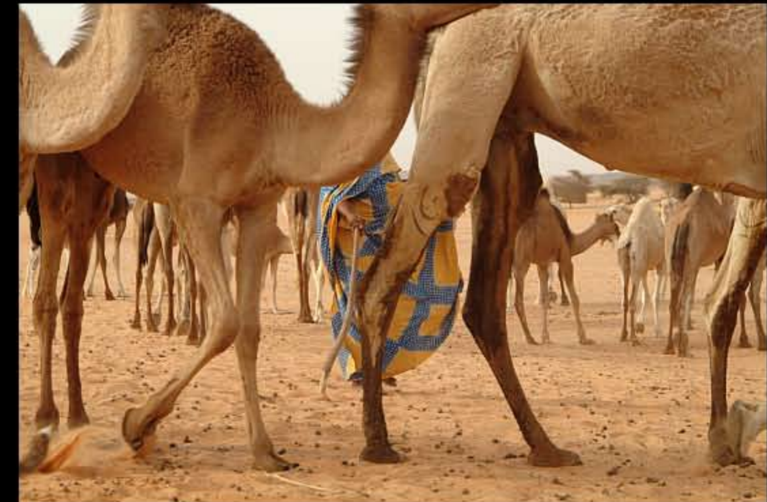
Maurit, C5 Wadi Rachid 075