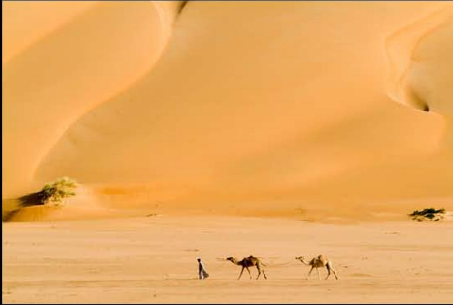
Maurit, Adrar, Amatlich, 052