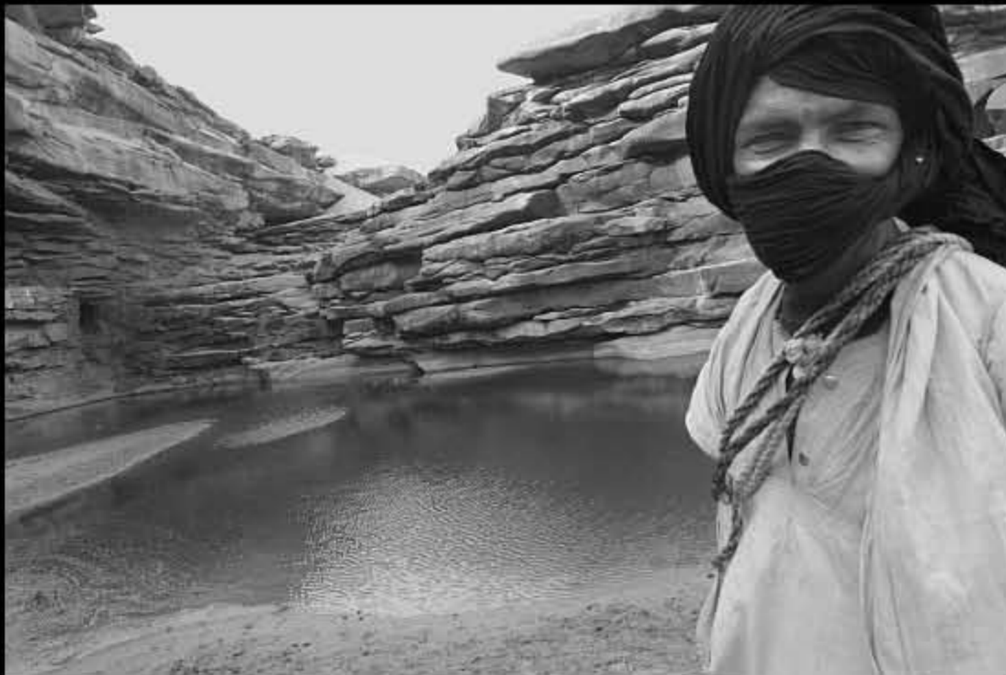
Maurit, C6 Wadi Rachid, Taoujafet 015