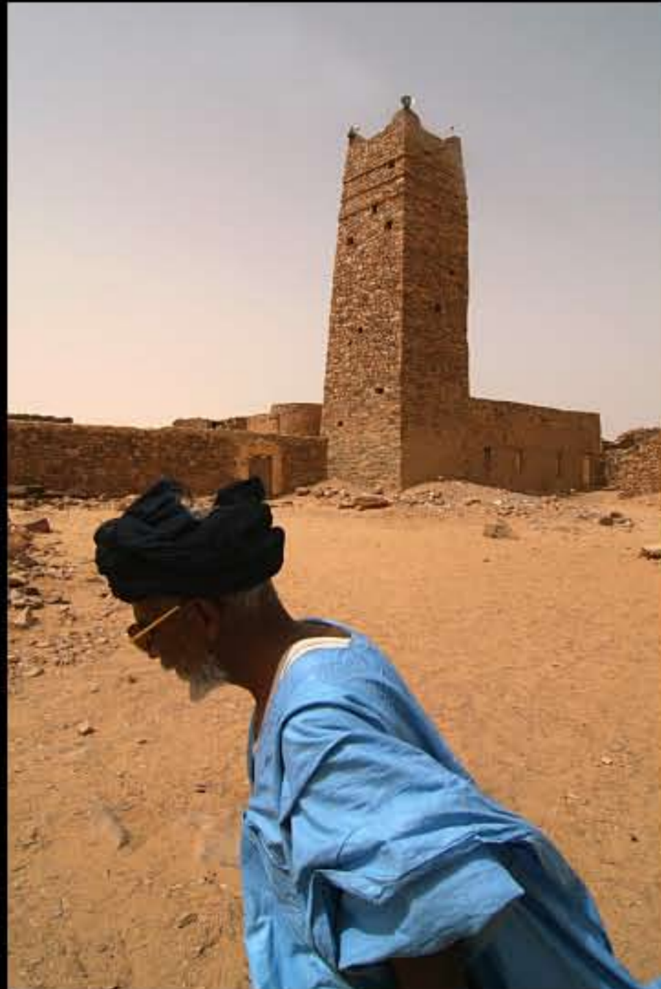
Maurit, Adrar, Ouadane, 214