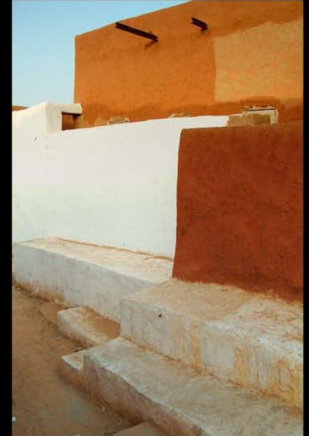
Maurit, C34 Oualata 404