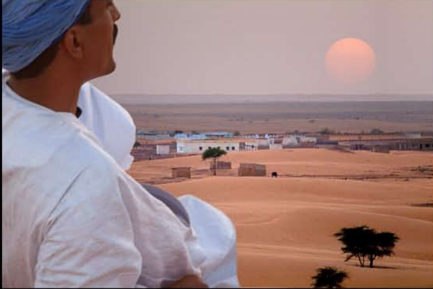
Maurit, Adrar, Cinguetti 122