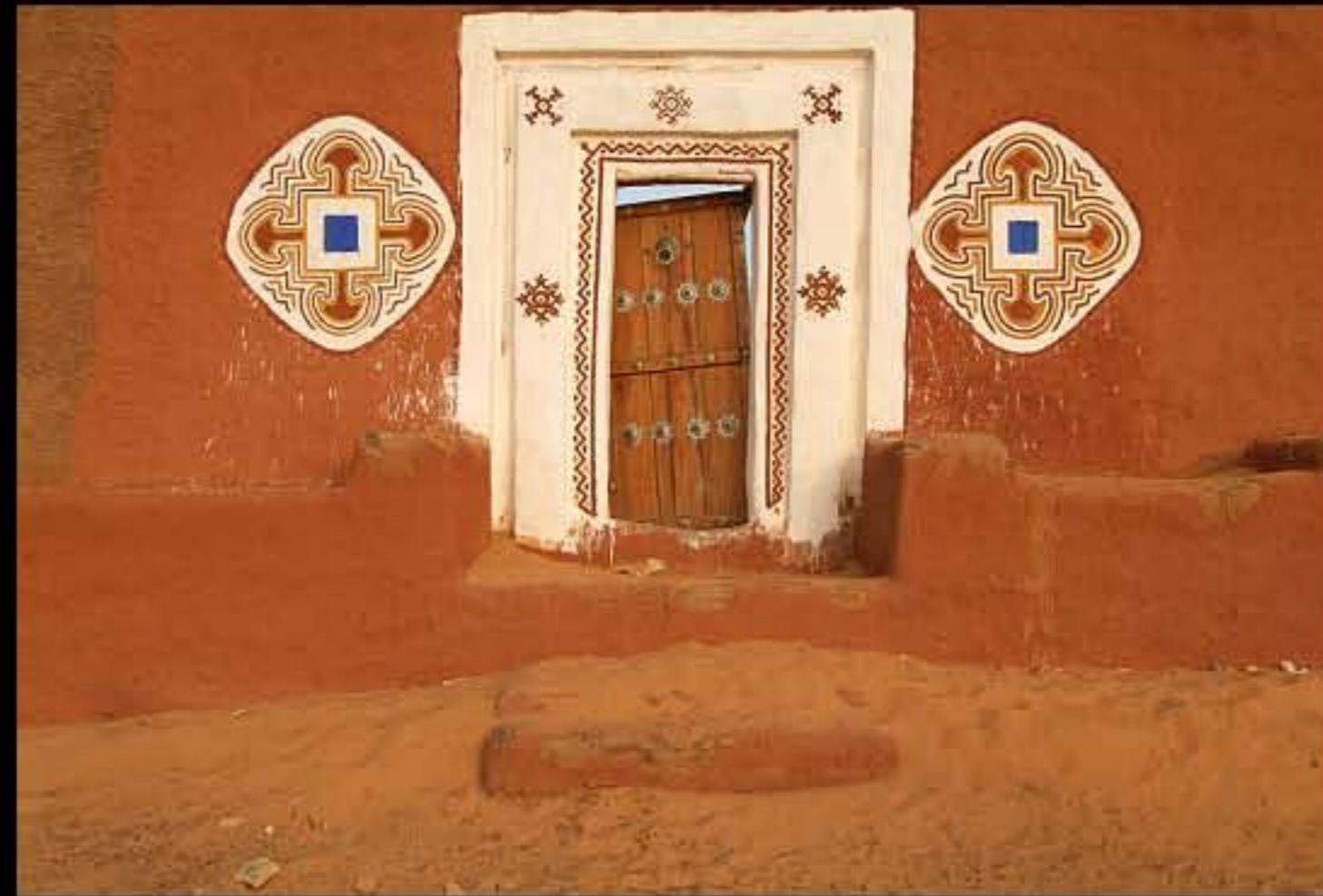
Maurit, C34 Oualata 329