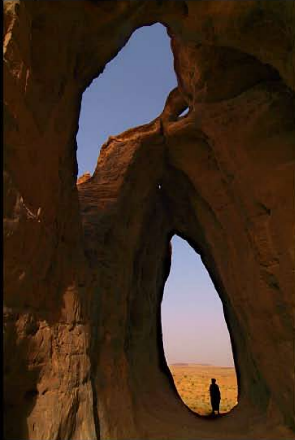
Maurit, C24 El Makhlouga 019