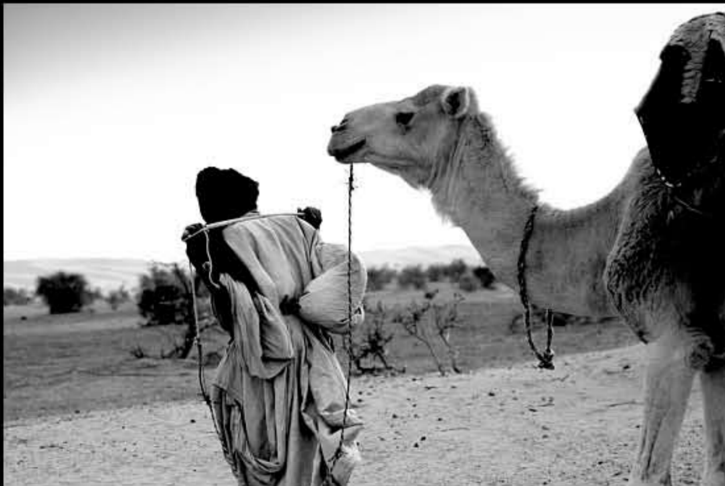
Maurit, C4 Wadi Khott, nomads 102bn