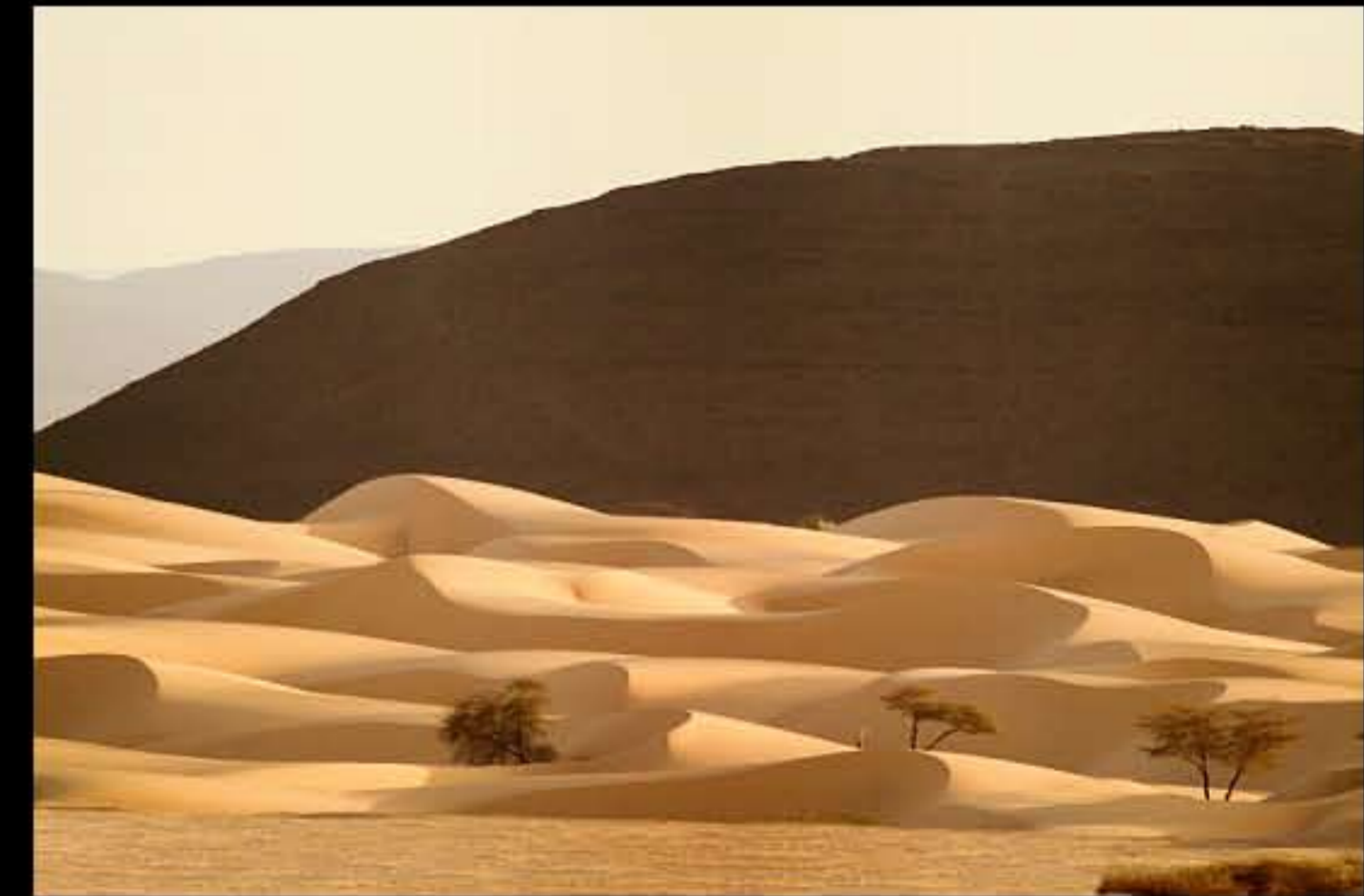
Maurit, Adrar, Amatlich, Medah, 012