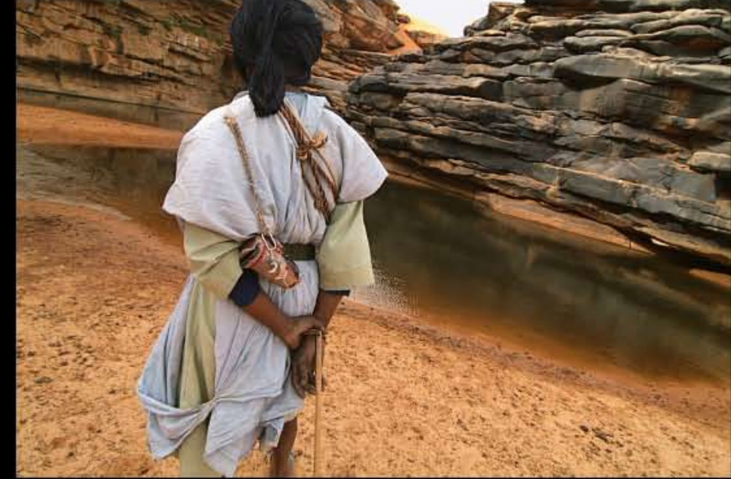
Maurit, C6 Wadi Rachid, Taoujafet 011