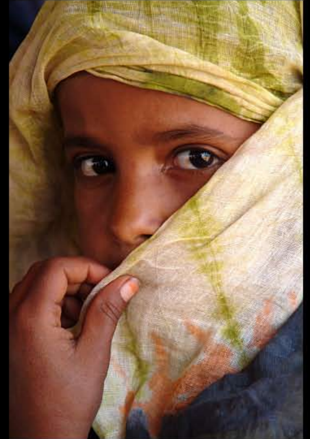
Maurit, Adrar, Amatlich, nomads, 025