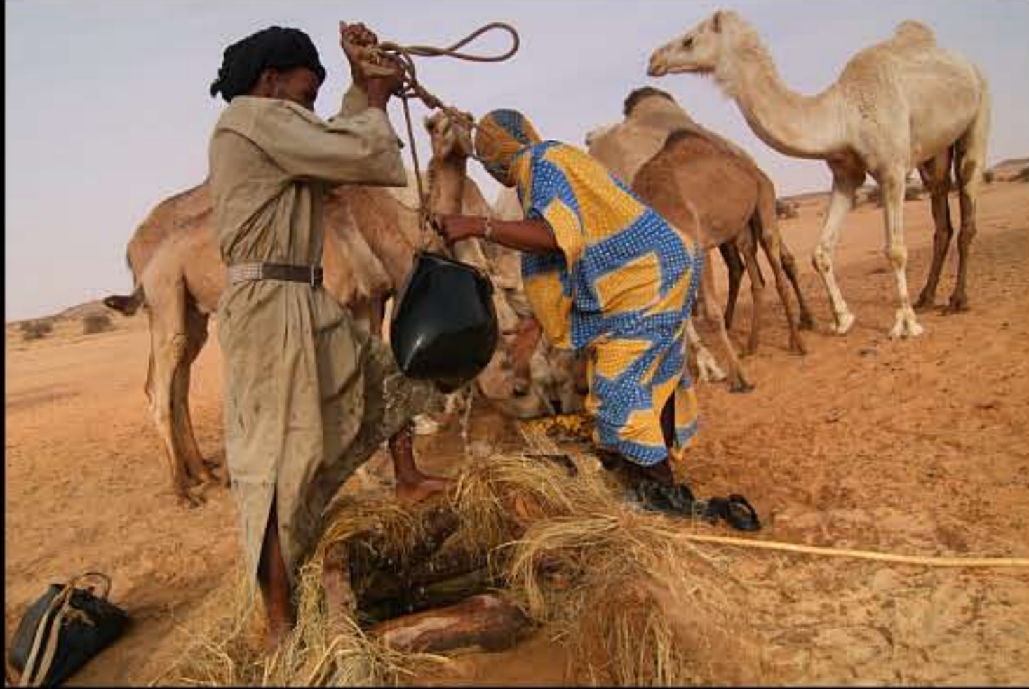
Maurit, C5 Wadi Rachid 081