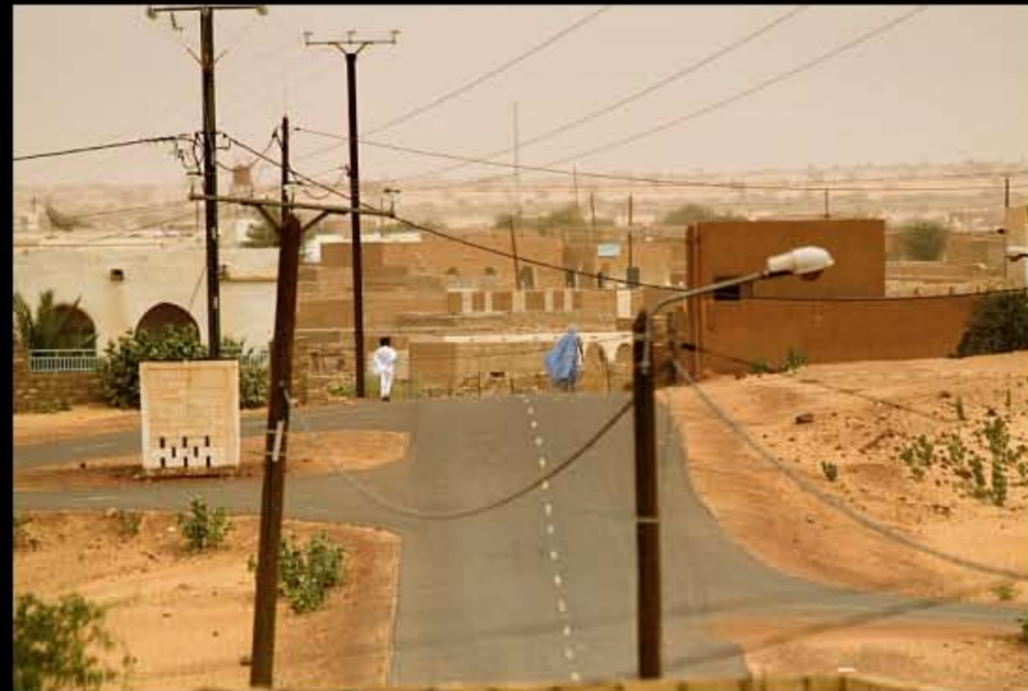
Maurit, C8 Tidjikja 006