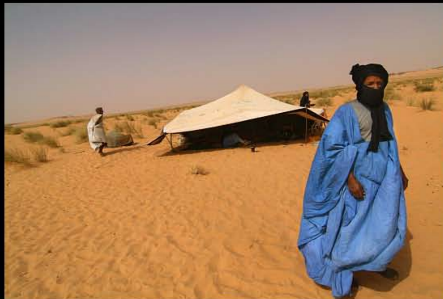
Maurit, C22 El Vouge pass, nomads 010