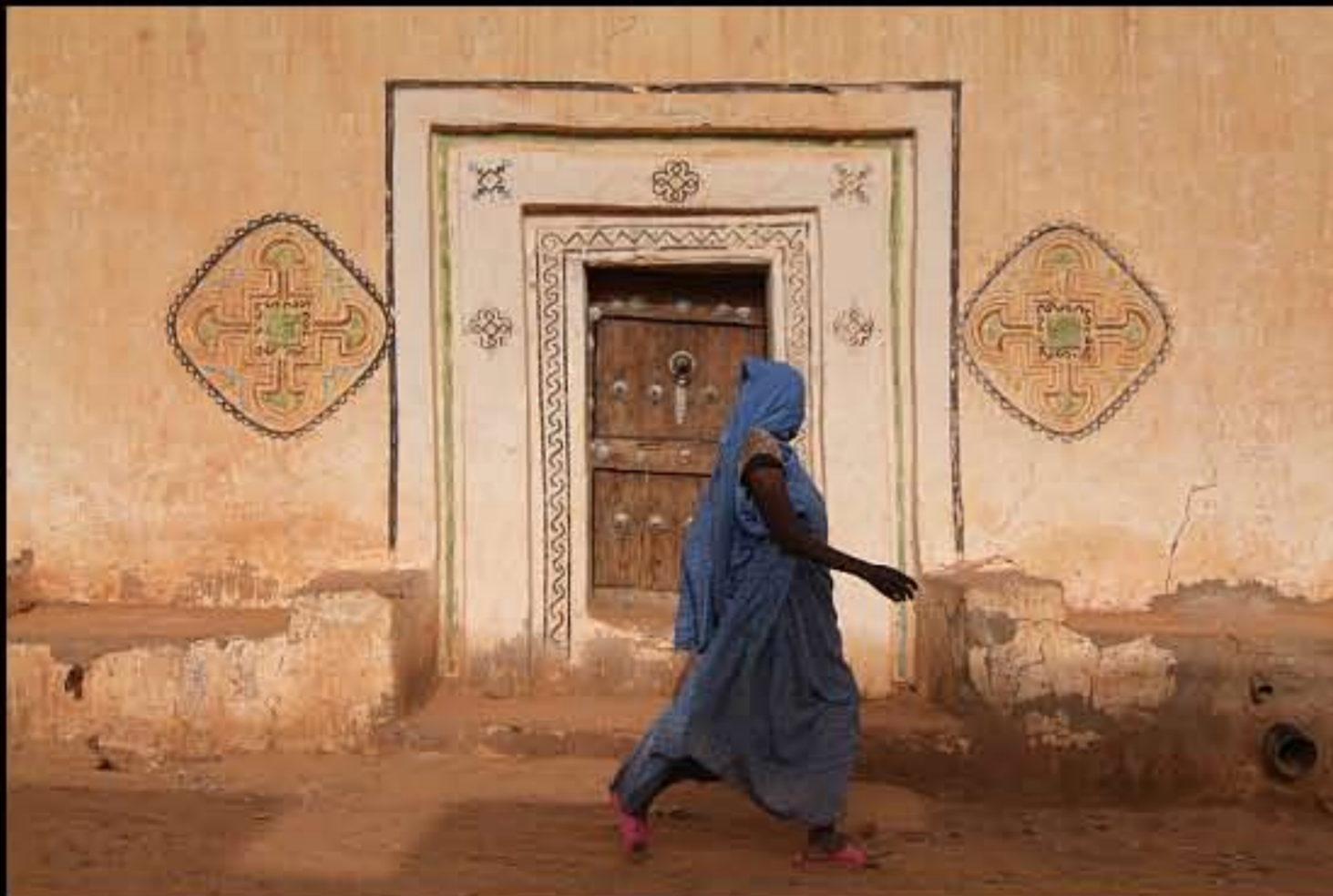
Maurit, C34 Oualata 206