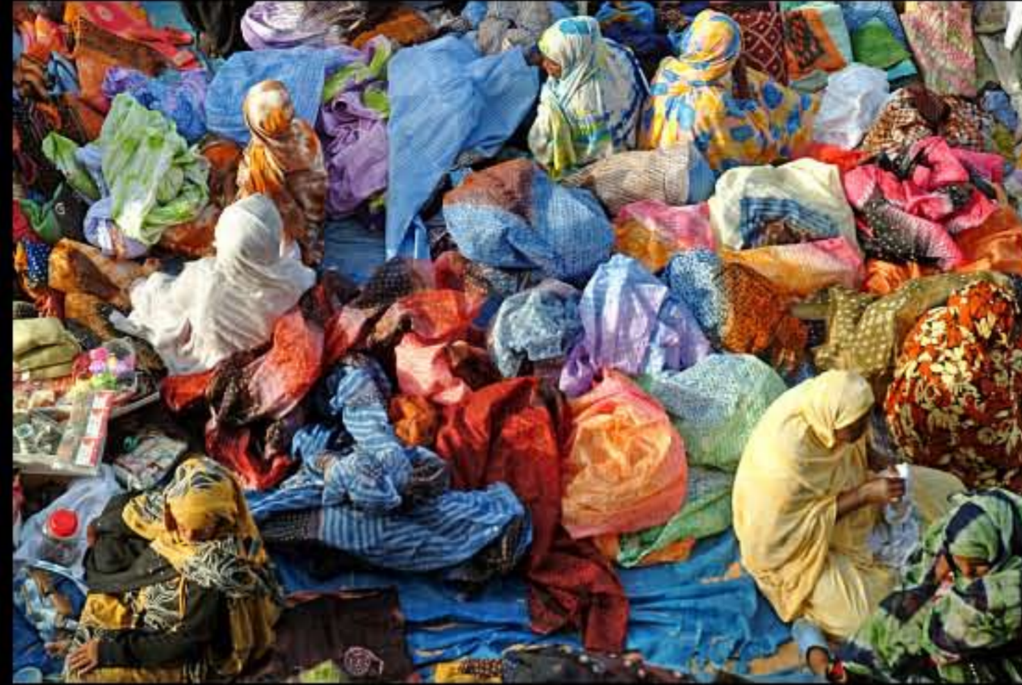
Maurit, Nouakchott Nou, central market 055