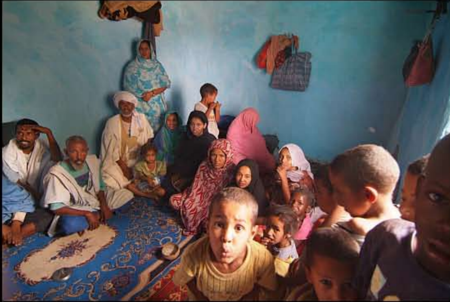
Maurit, C19 Akreijit 057