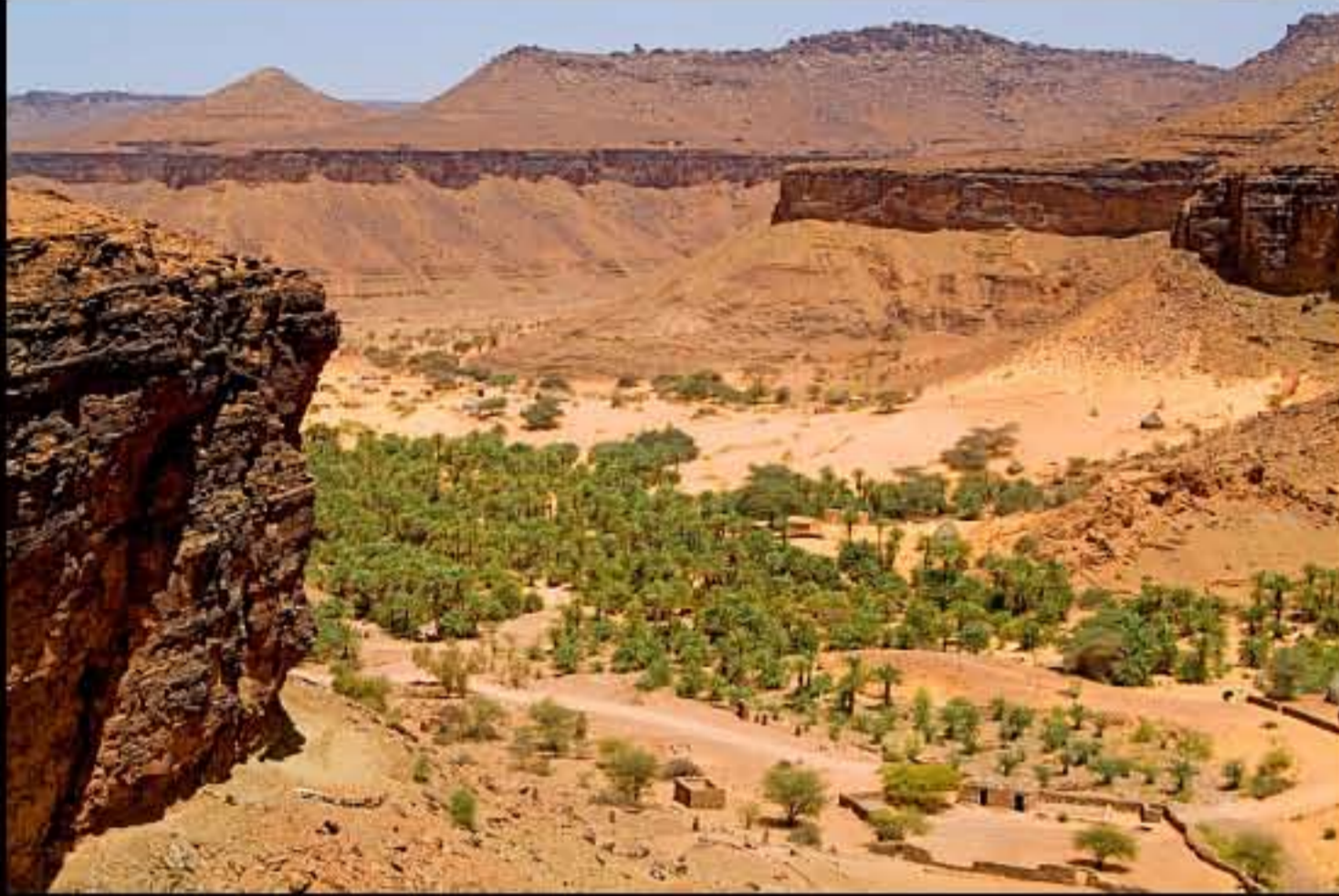
Maurit, Adrar, Terjit oasis 034