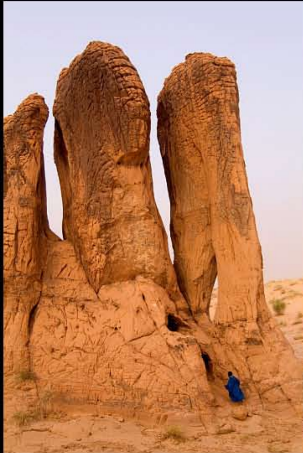
Maurit, C26 El Sba 044