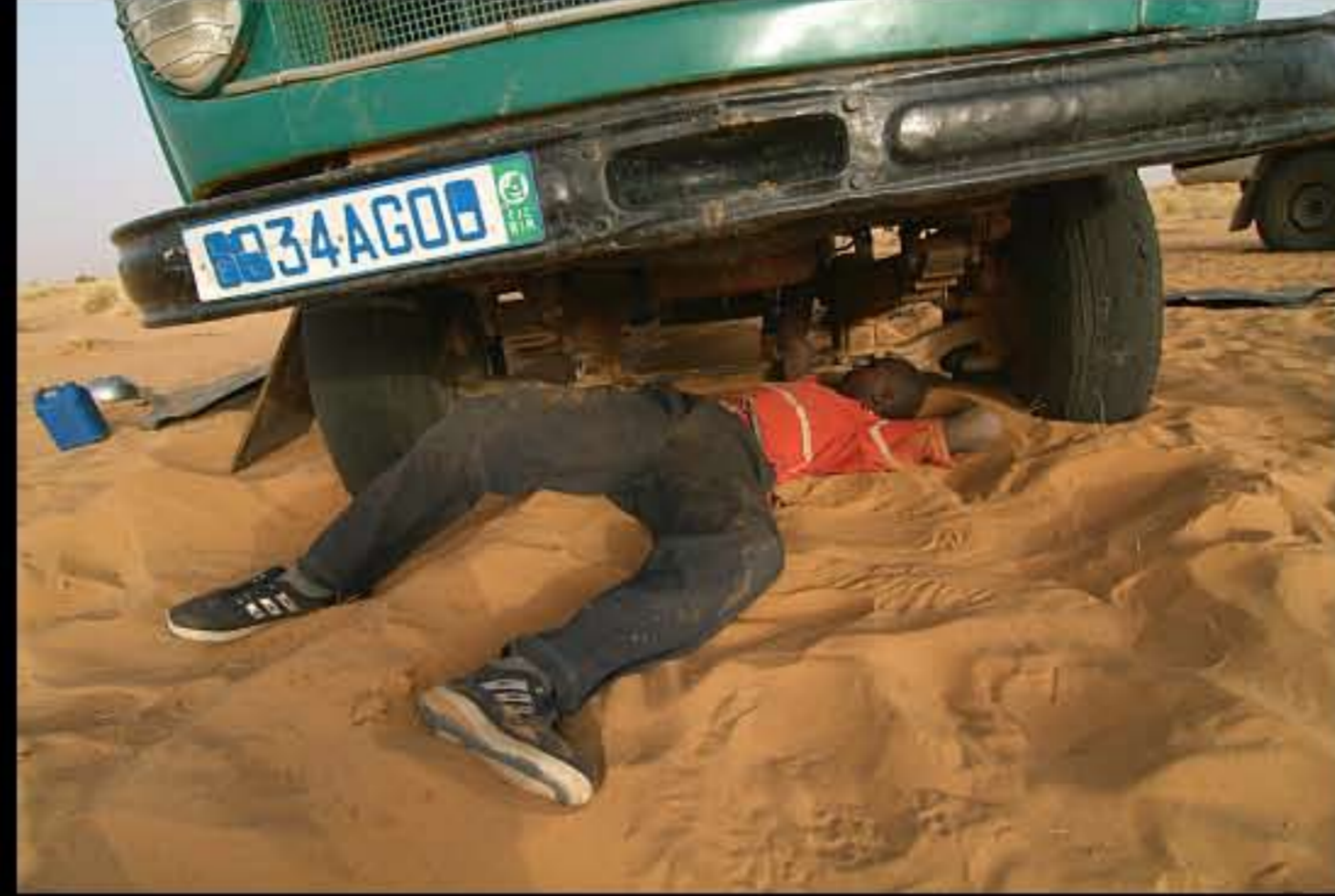
Maurit, C 32, trasporto sale 005