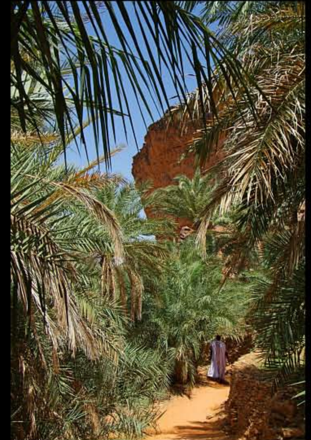
Maurit, Adrar, Terjit oasis 004