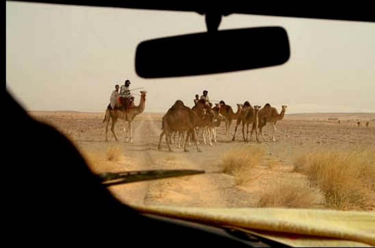
Maurit, C30 Oujaf well 001