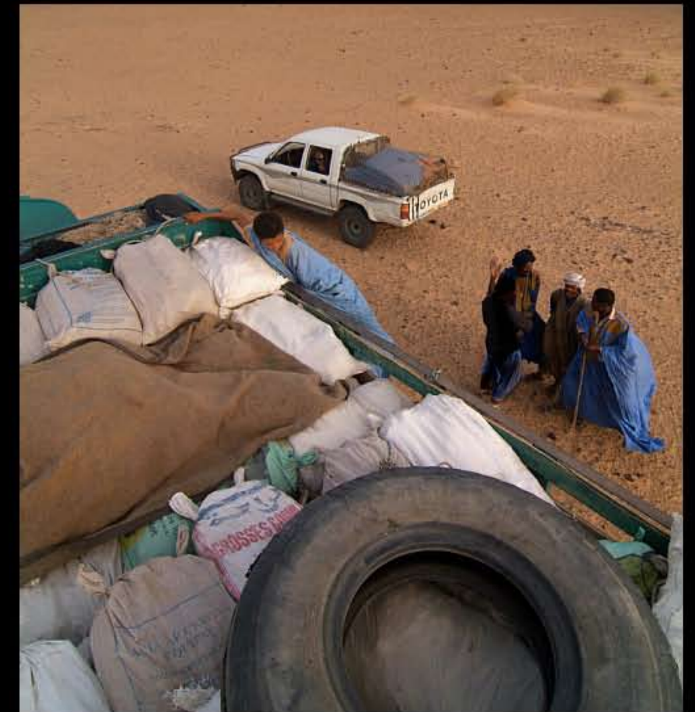
Maurit, C 32, trasporto sale 003