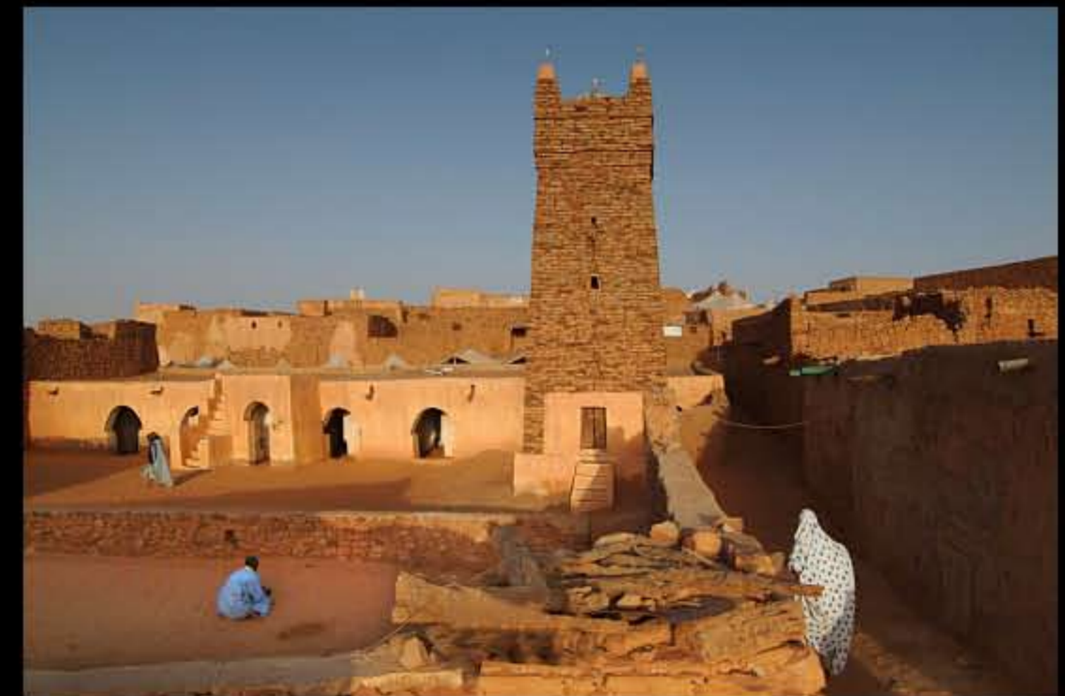
Maurit, Adrar, Cinguetti 067