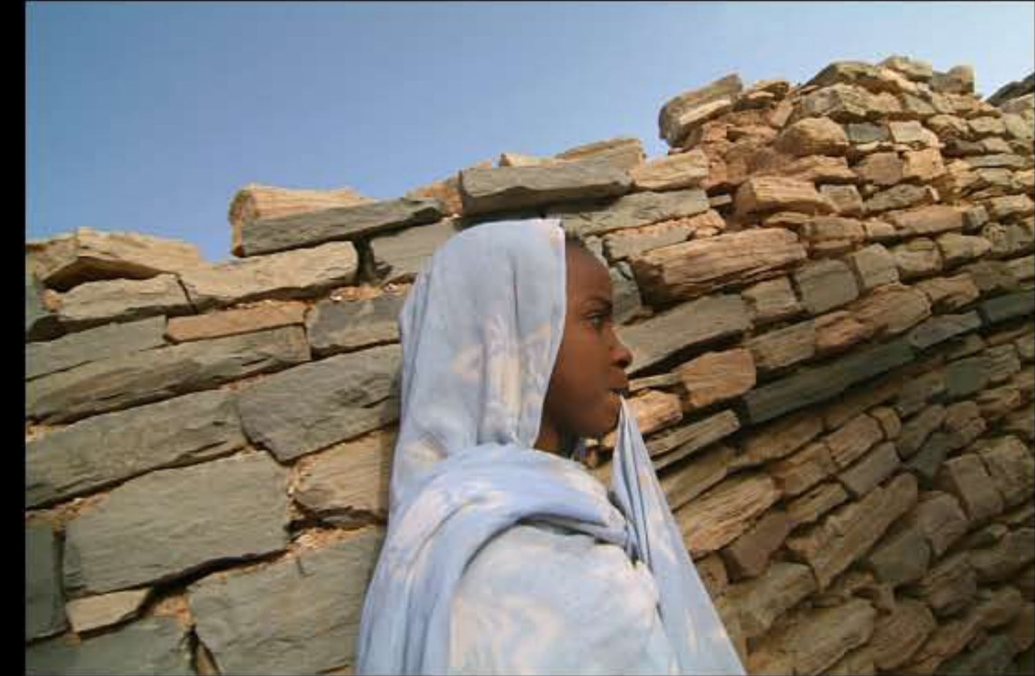
Maurit, C17 Tichitt 039