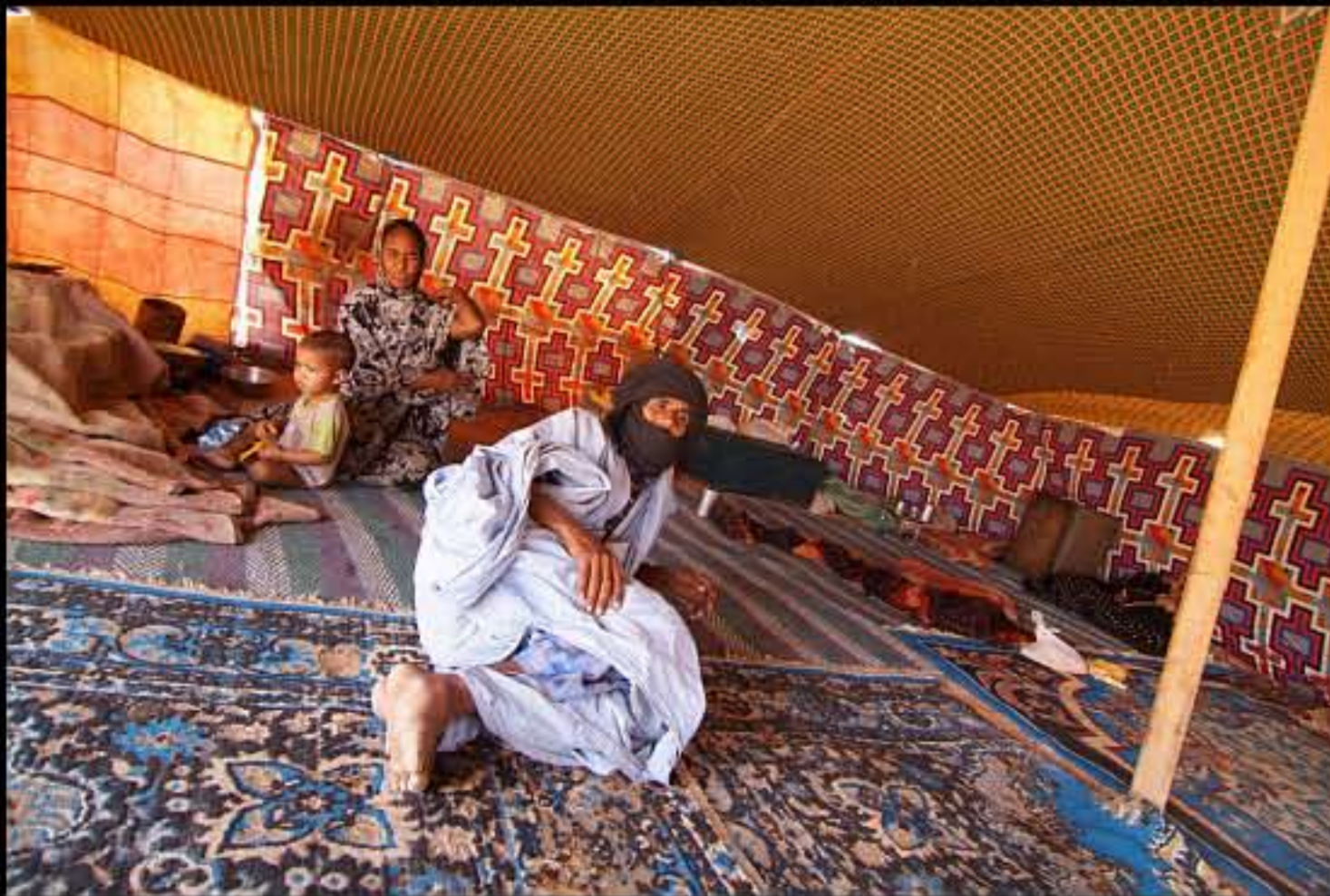
Maurit, Adrar, Amatlich, nomads, 085