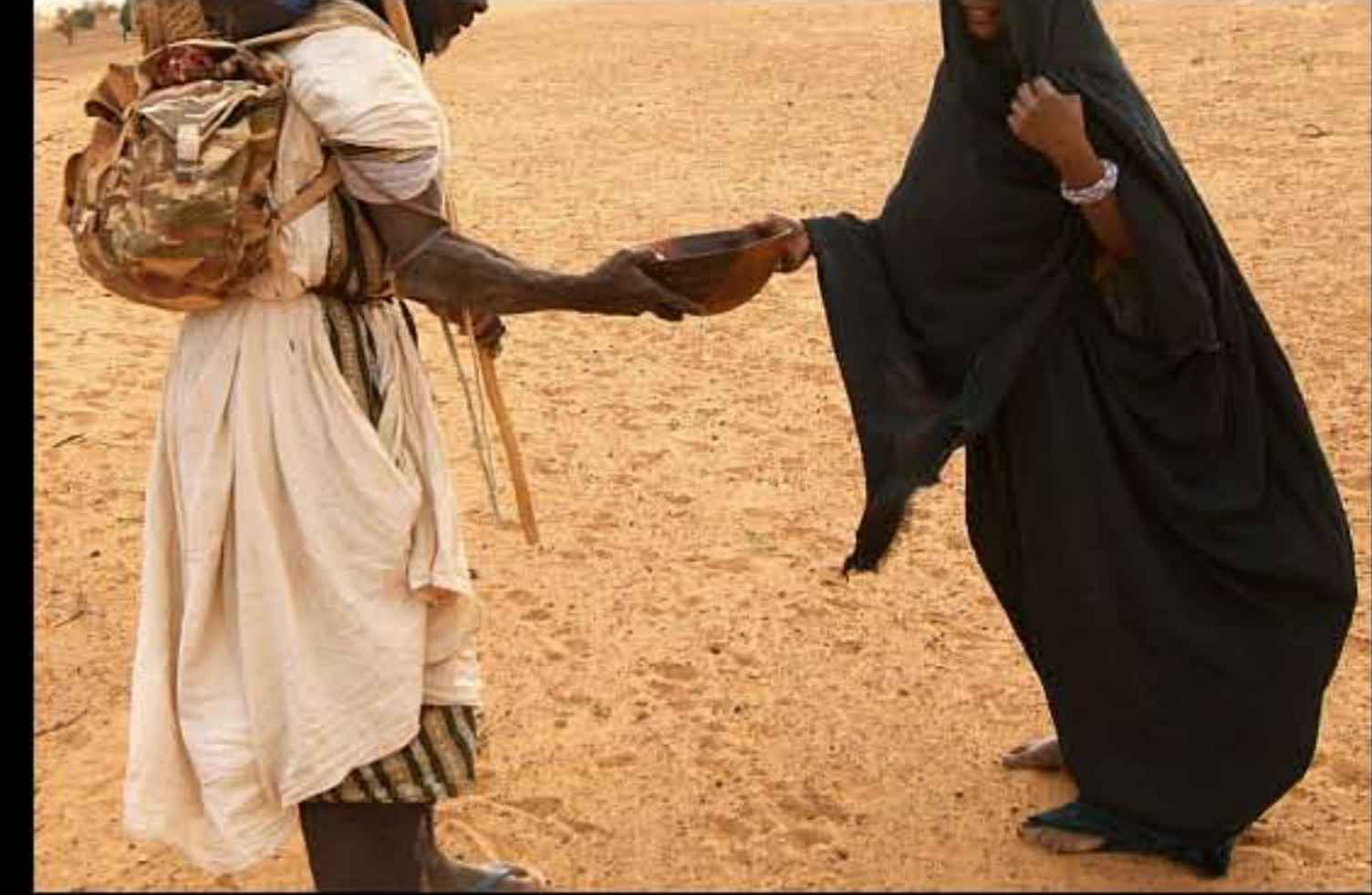
Maurit, C4 Wadi Khott, nomads 078