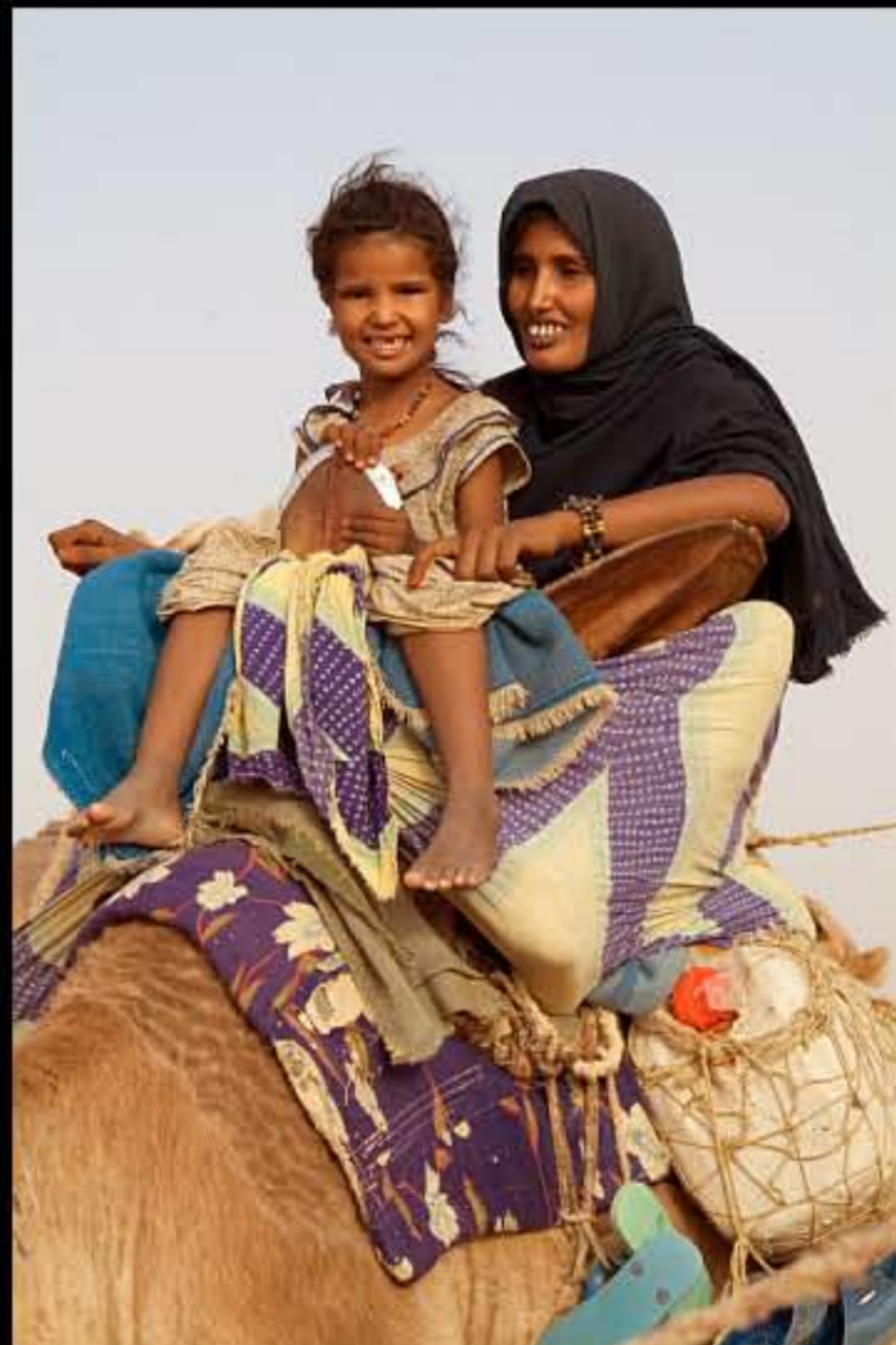
Maurit, C25 El Zeh, nomads 013