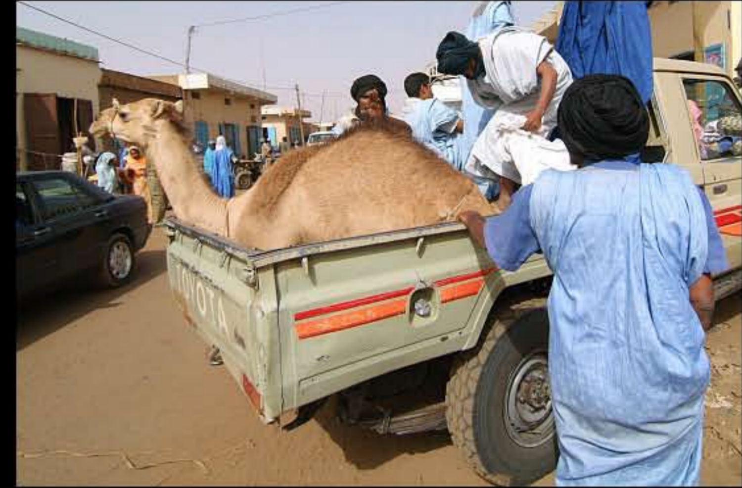
Maurit, Route Espoir Ayoun 128