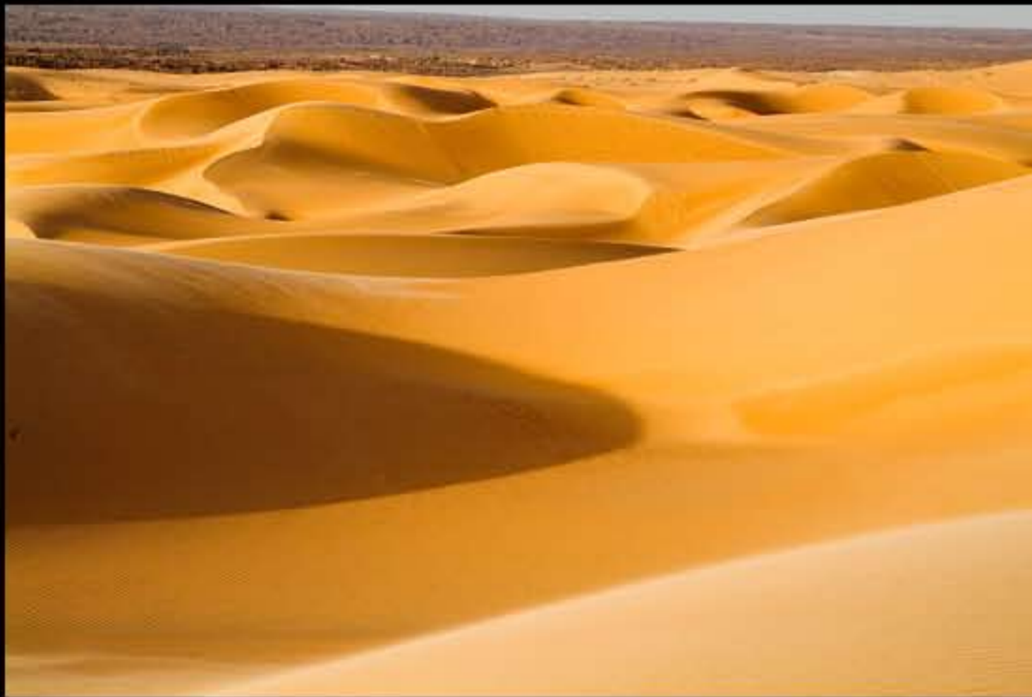
Maurit, Adrar, Amatlich, 115