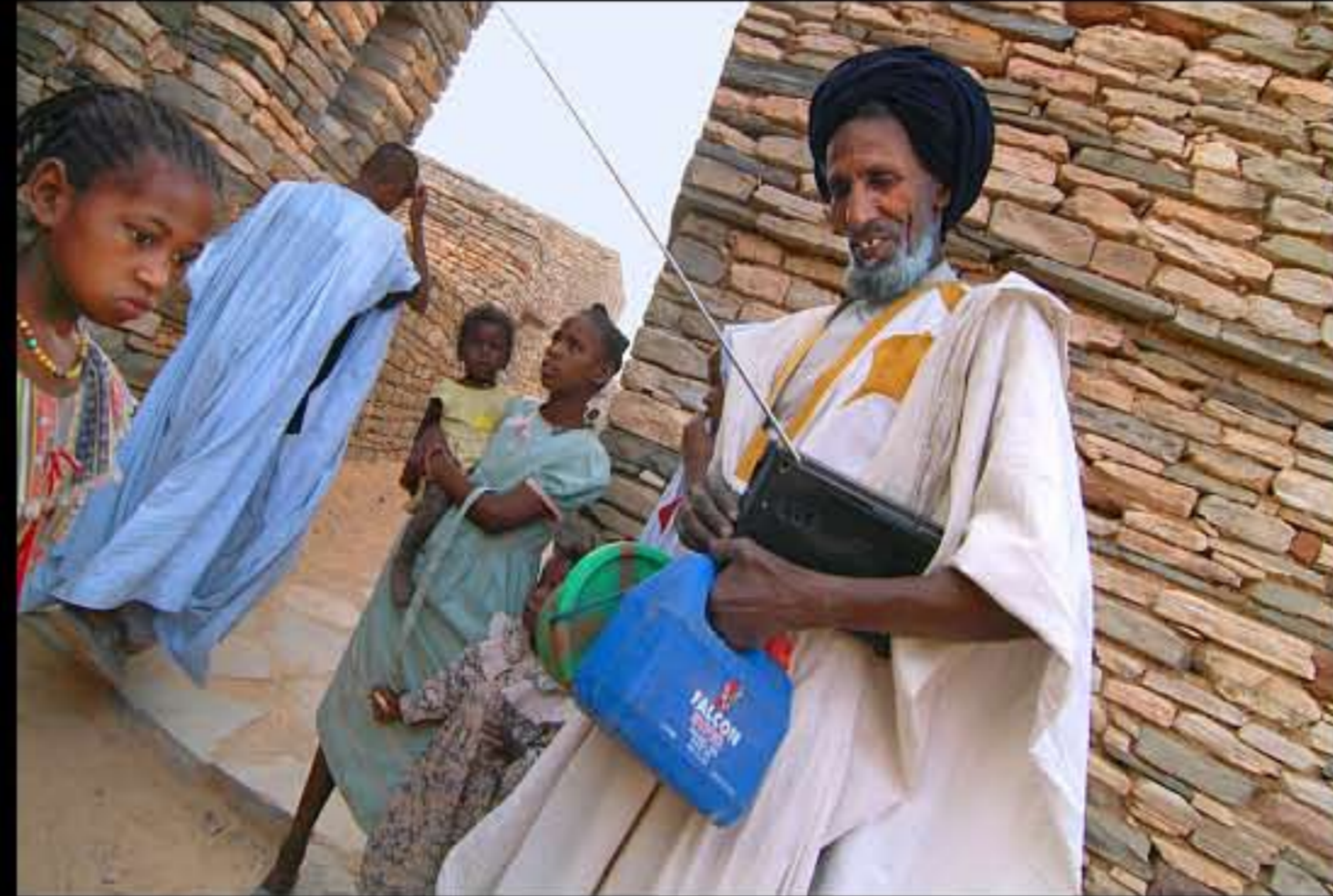
Maurit, C17 Tichitt 036