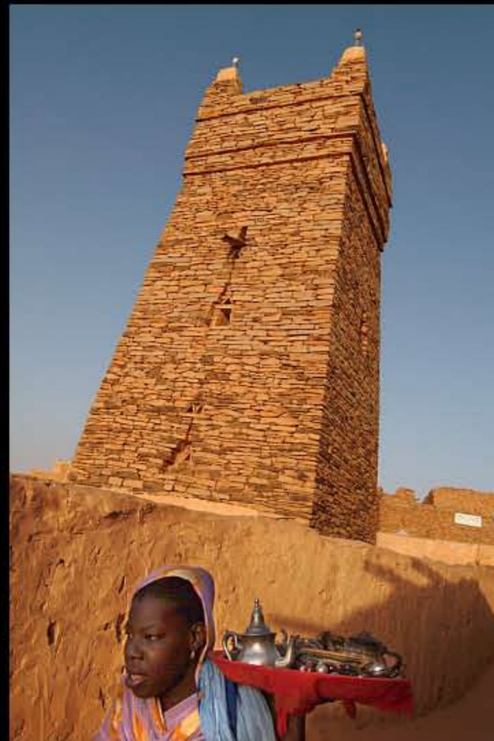
Maurit, Adrar, Cinguetti 046