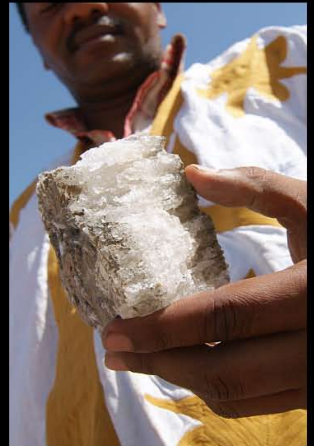
Maurit, Adrar, White valley, salt 010