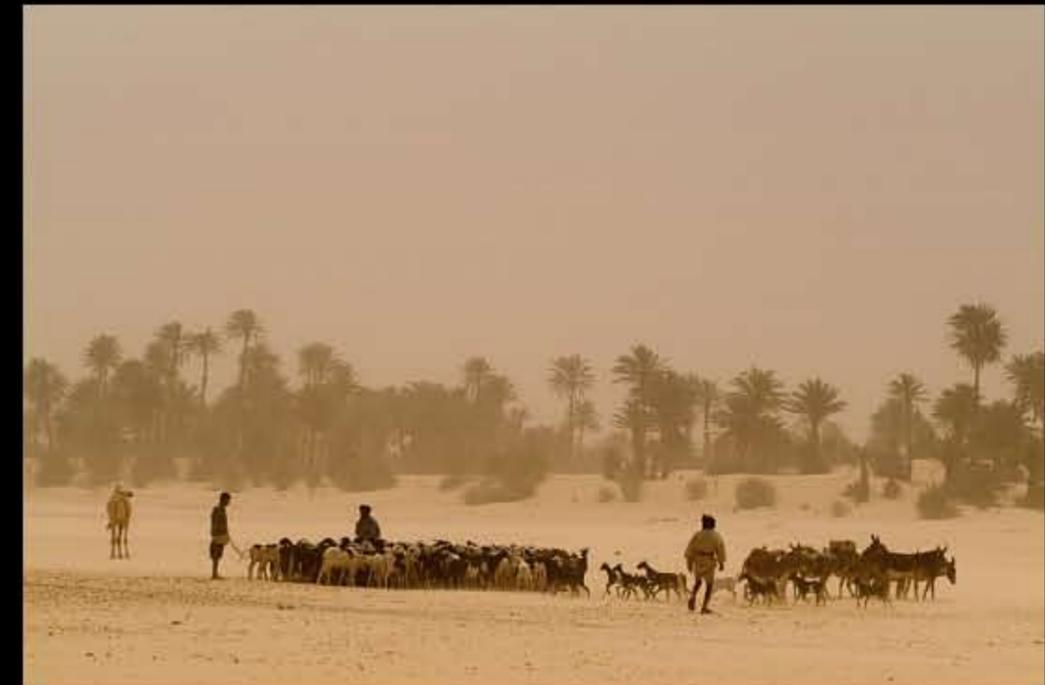
Maurit, C8 Wadi Tidjikja 038