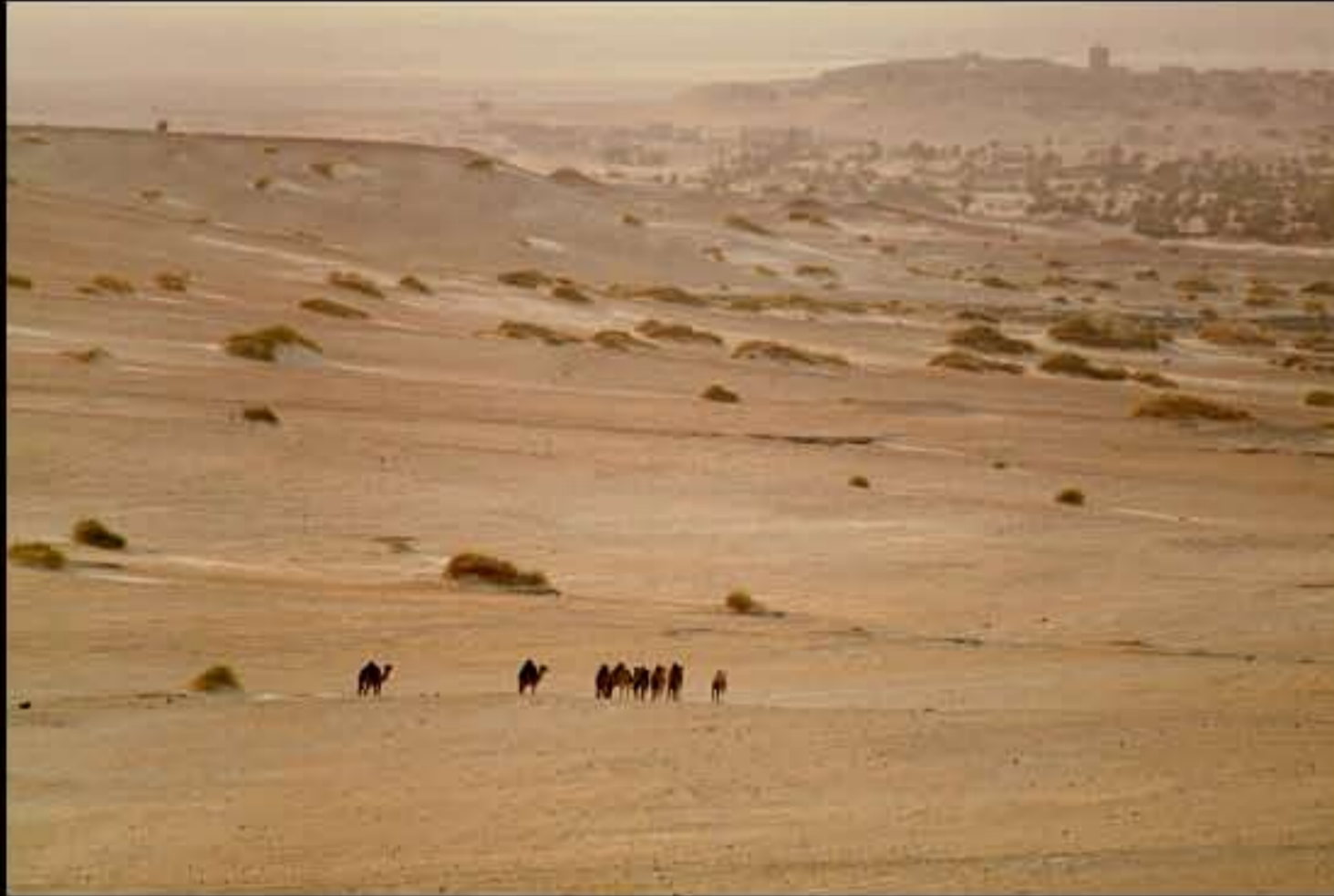
Maurit, C16 Tichitt, west 006