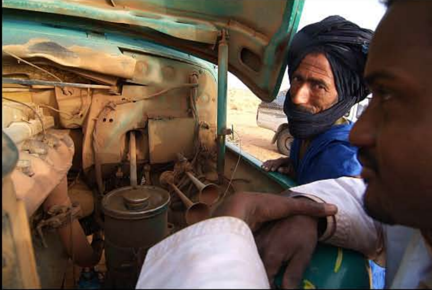
Maurit, C 32, trasporto sale 004