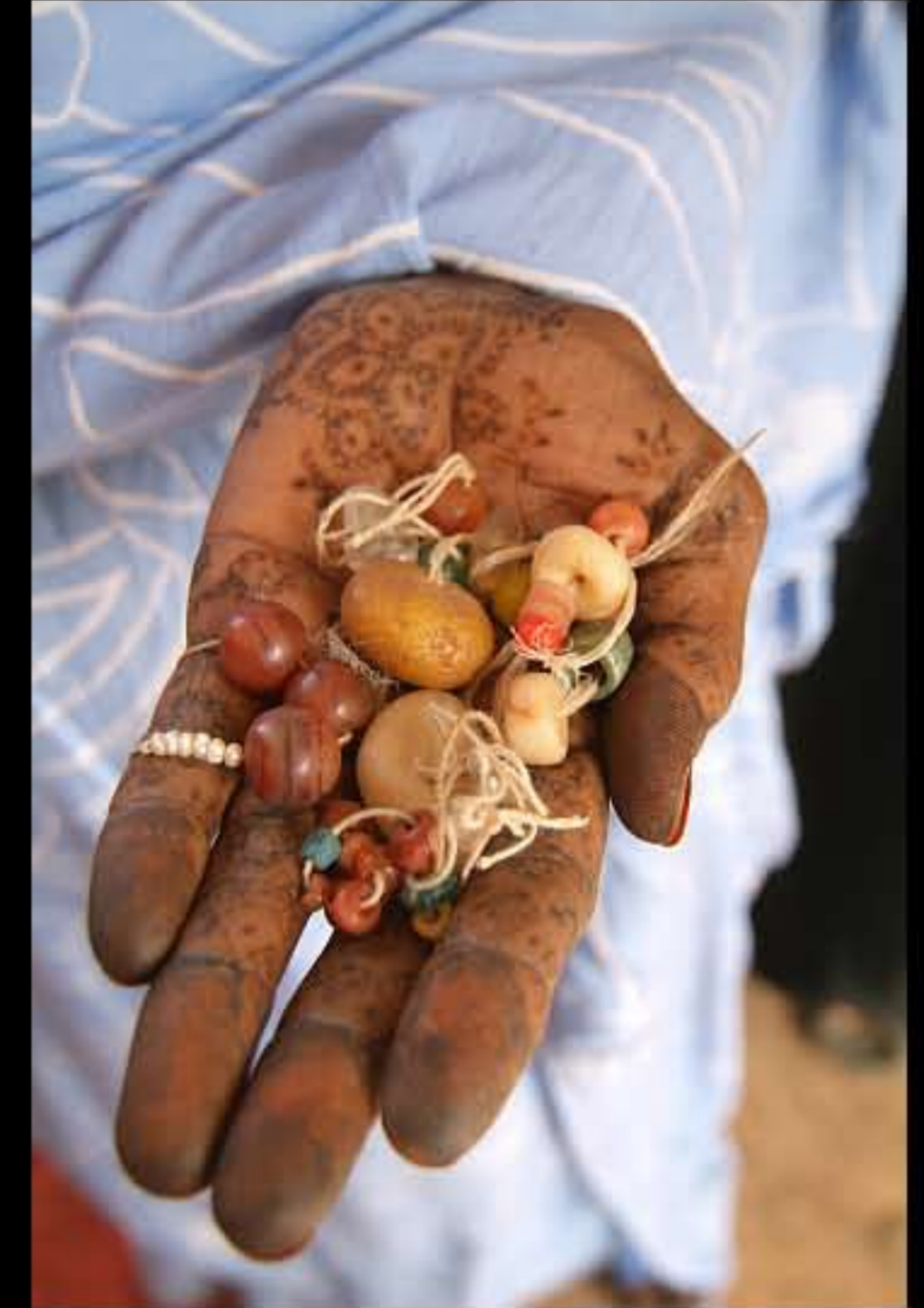
Maurit, artigianato, gioielli 006