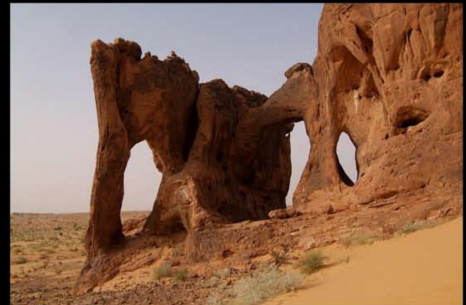
Maurit, C24 El Makhlouga 011 (elephant)