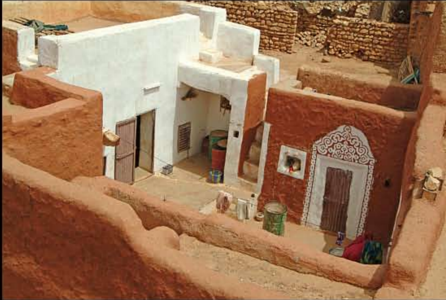
Maurit, C34 Oualata 032