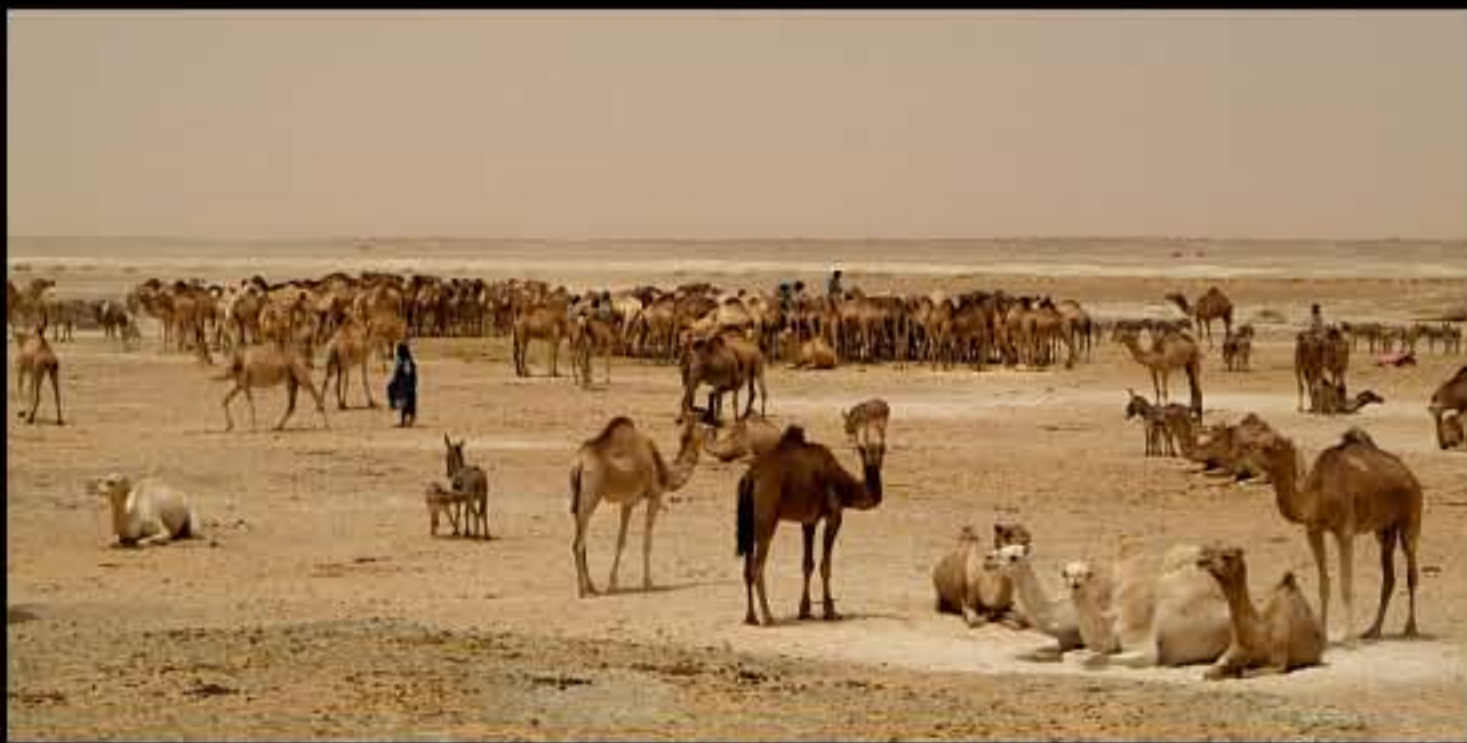
Maurit, C20 Akreijit, Touijinet well 034