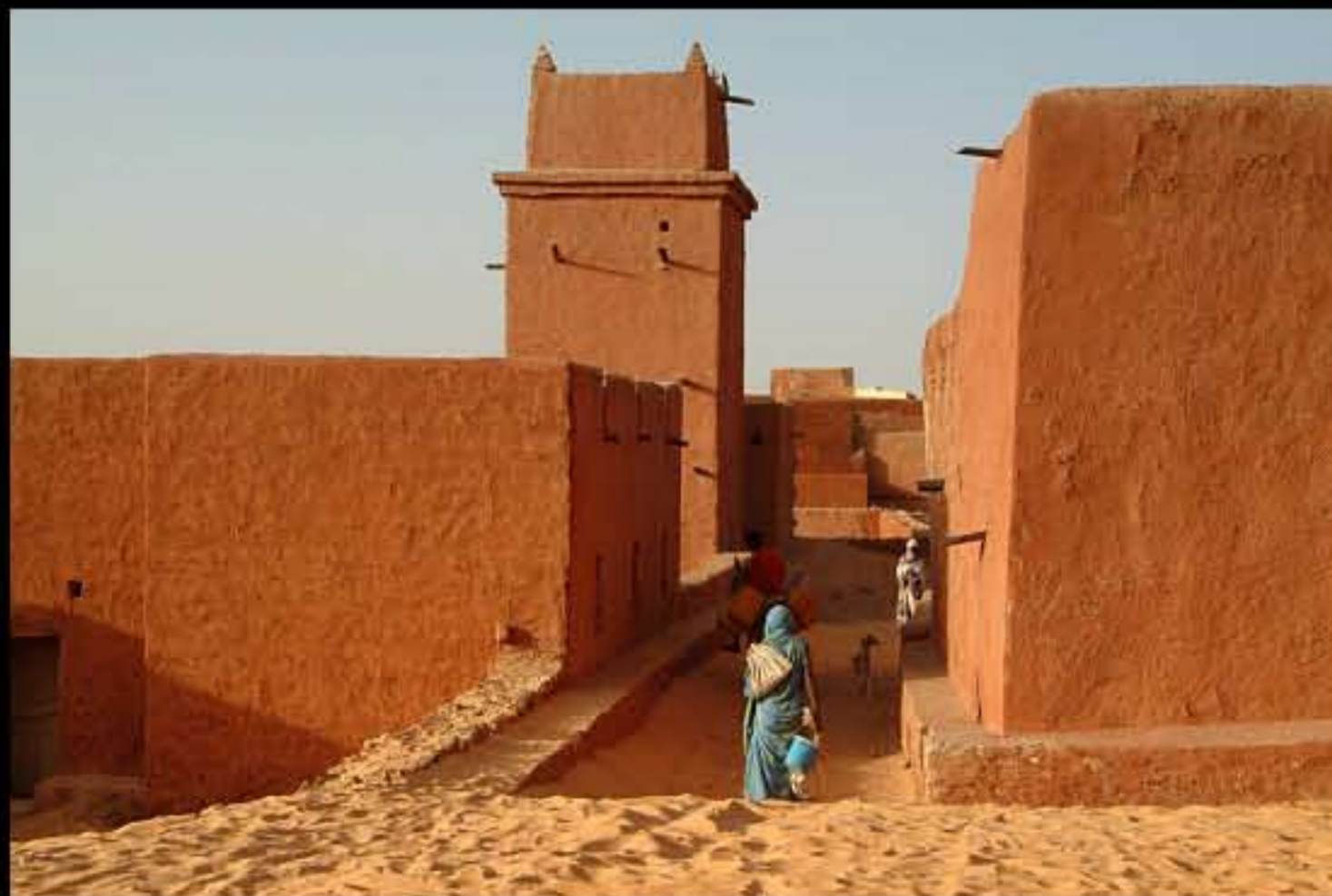
Maurit, C34 Oualata 435