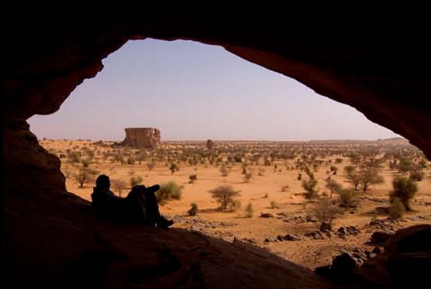
Maurit, Route Espoir Ayoun, Gelb Inimish 072