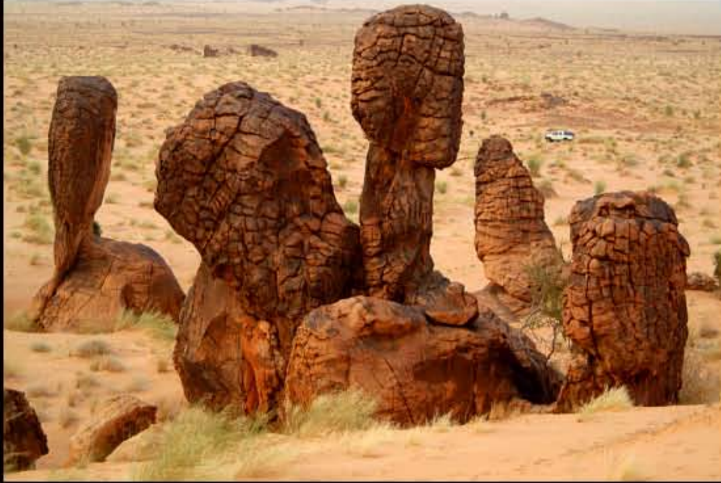
Maurit, C26 El Sba 021