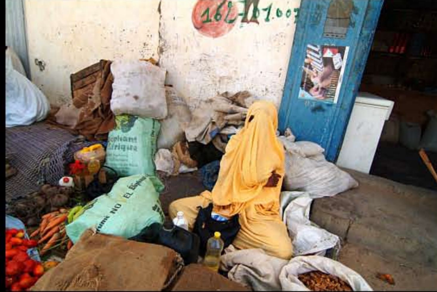
Maurit, Adrar, Atar 016