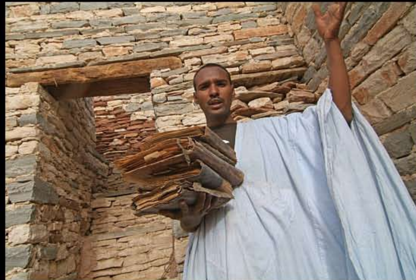
Maurit, C17 Tichitt, library Abdel Moumen 056