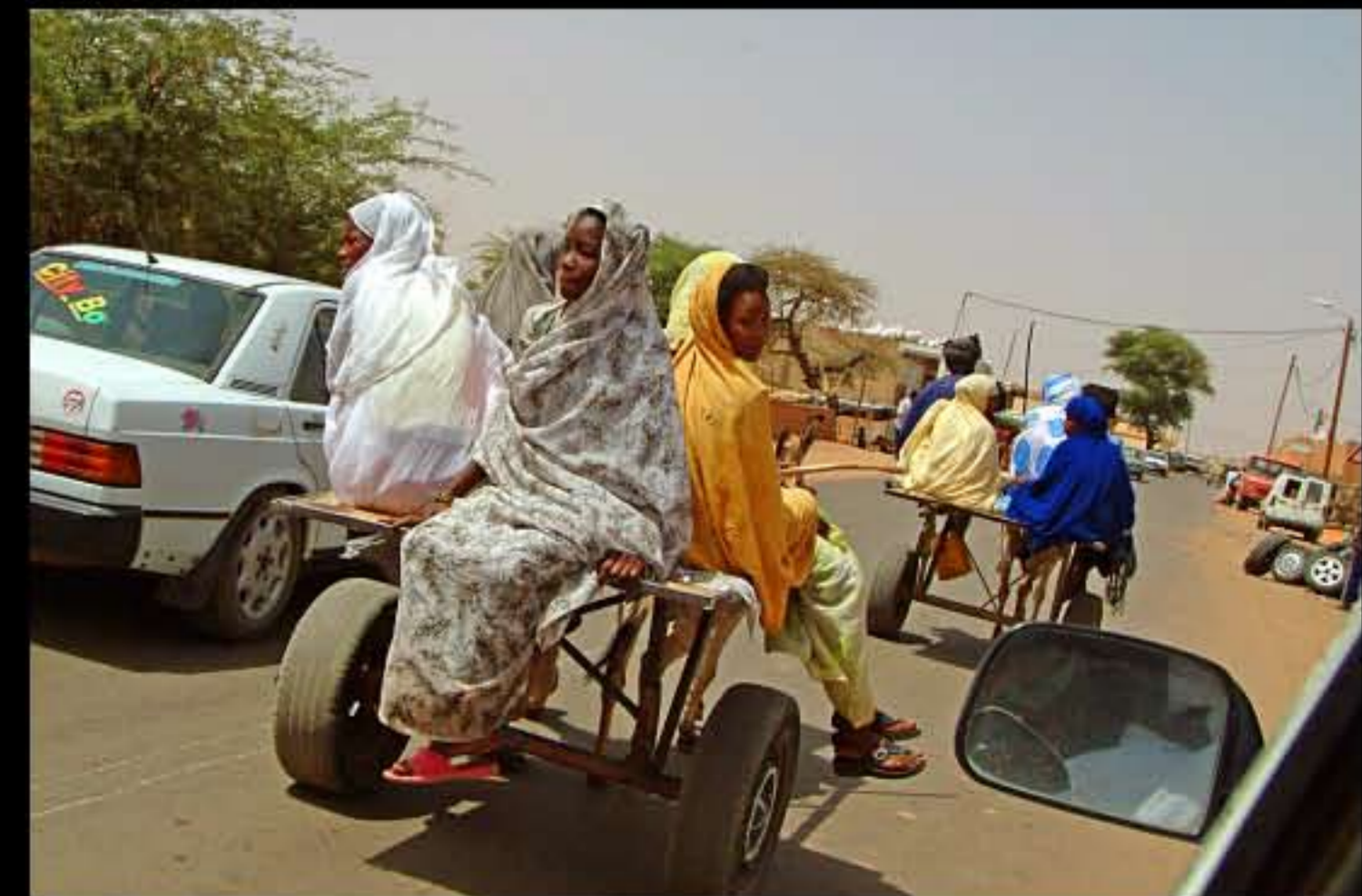
Maurit, Route Espoir Kiffa 094