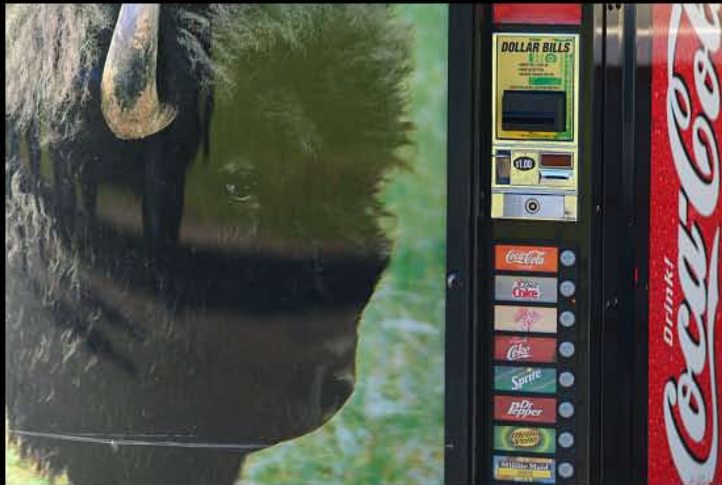
South Dakota Black Hills distributore bibite