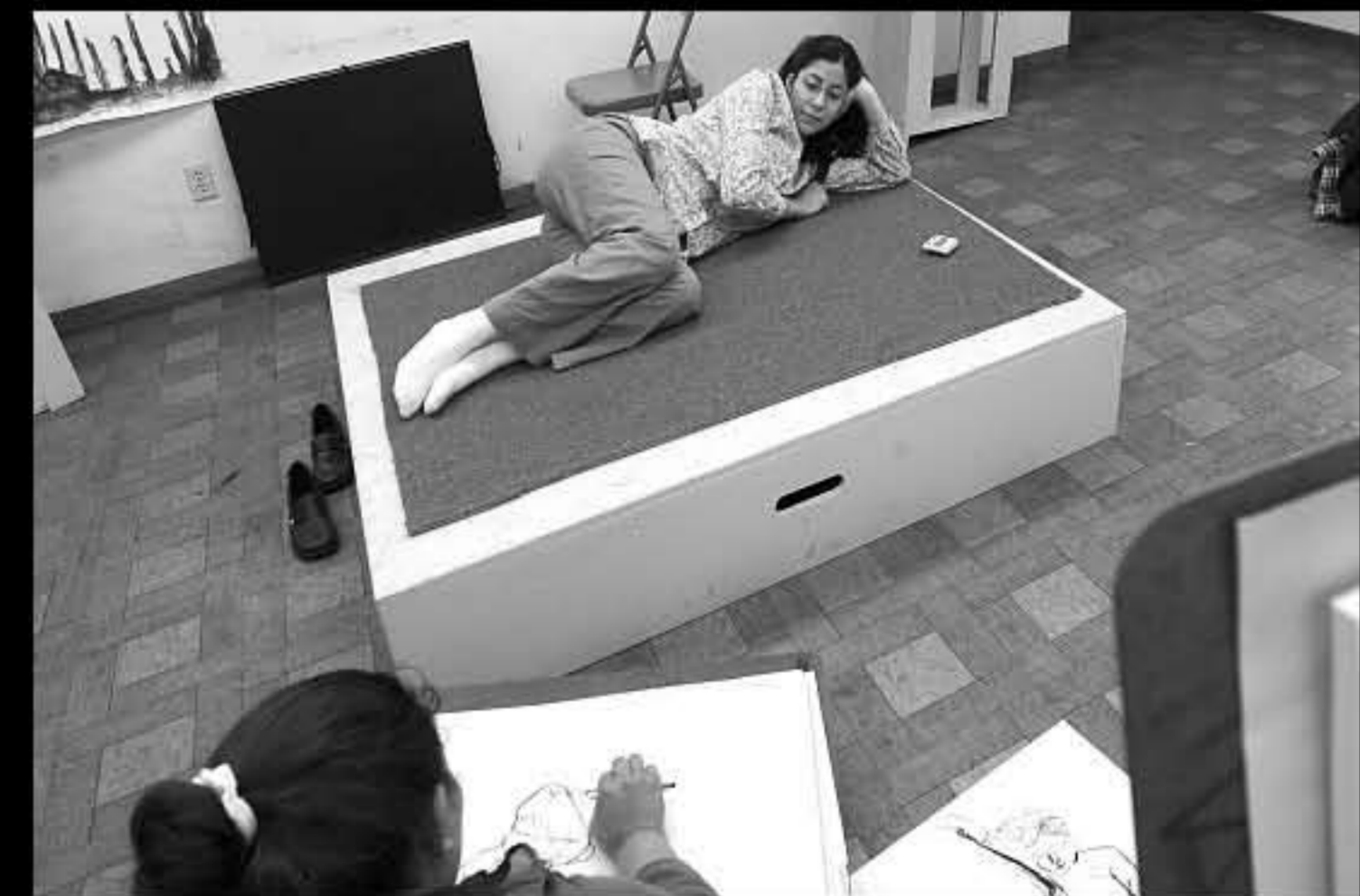
SD Mission, università, lezione di pittura