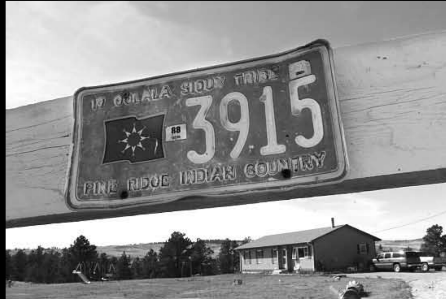
SD Kyle 06