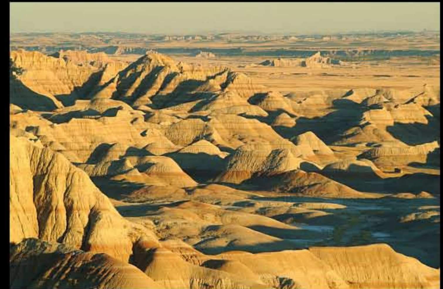
Badlands Loop Scenic Byway 12