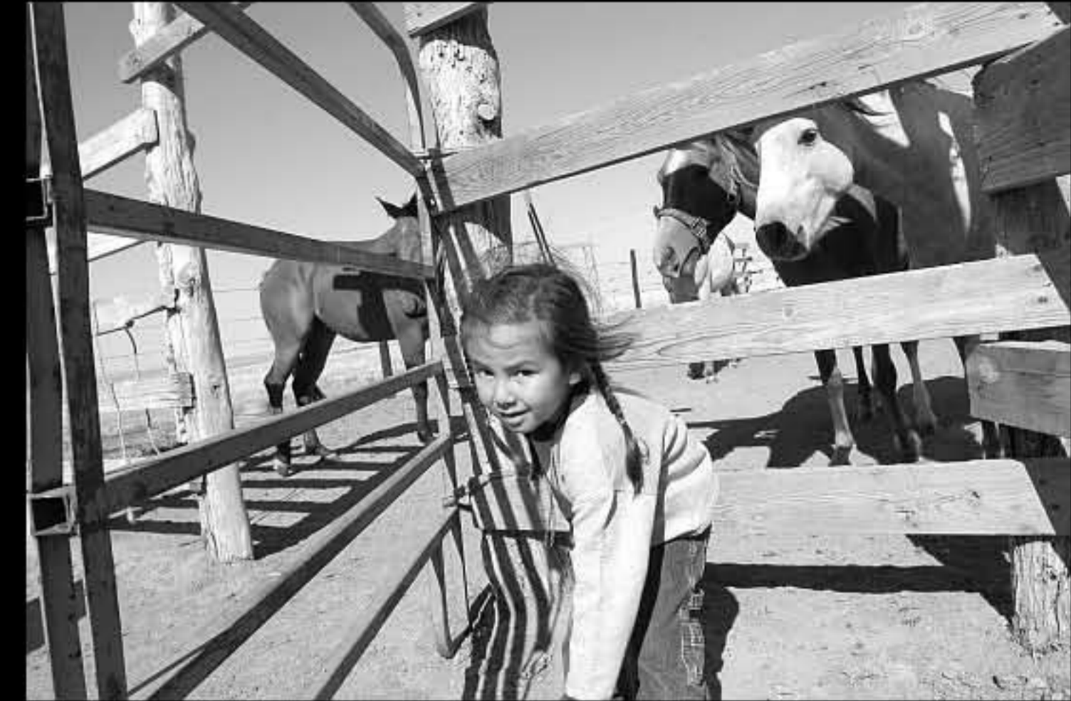
SD Kyle, bambino Colt 3