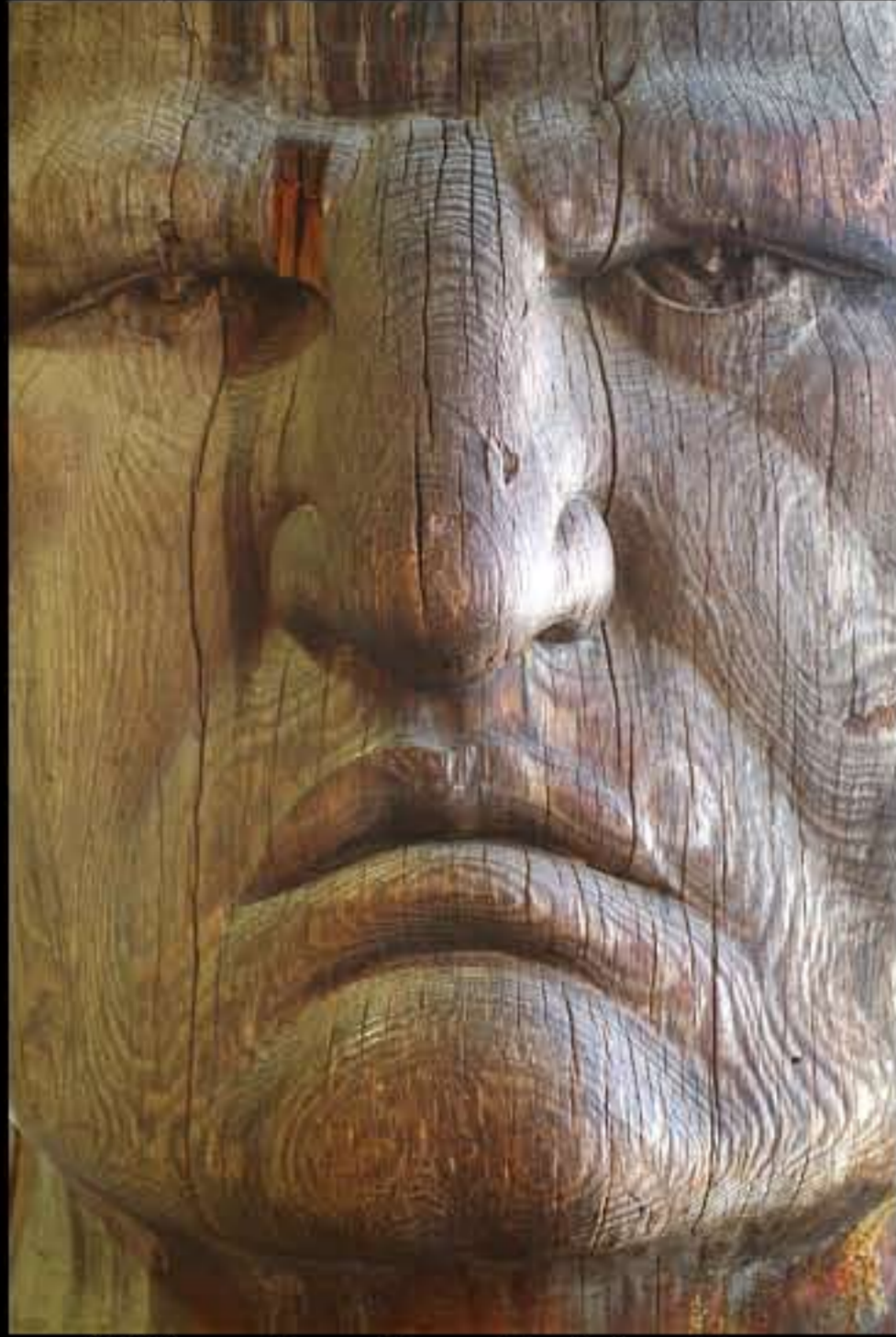
SD Crazy Horse Memorial, statua di legno