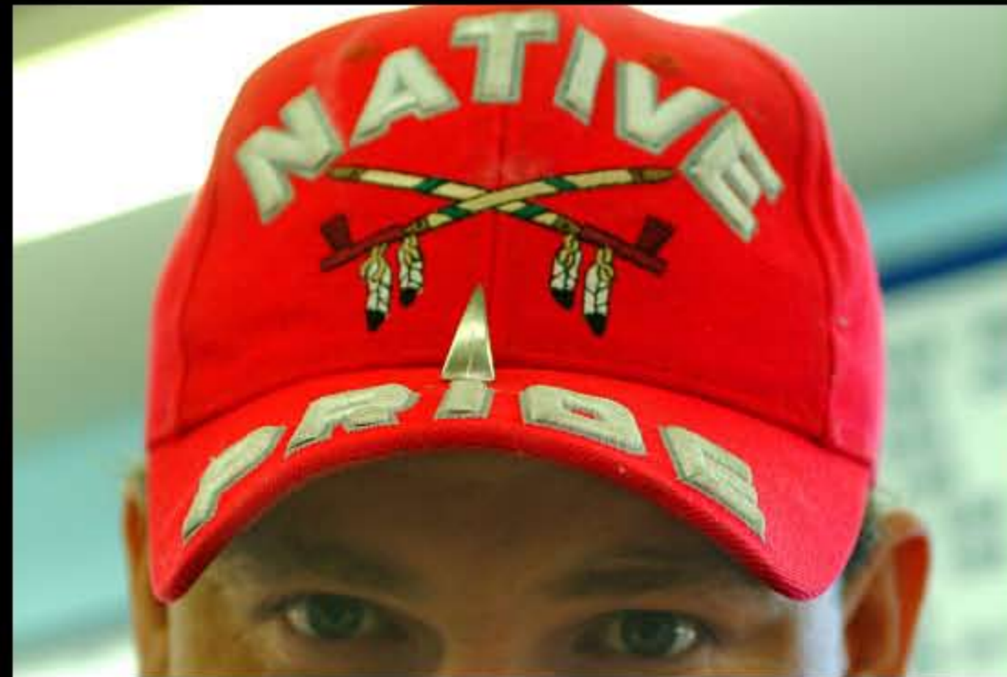
SD Rosedud, orgoglio nativo