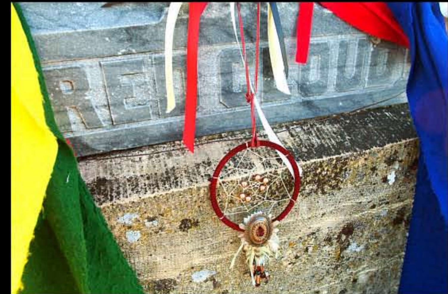
SD Pine Ridge, tomba di Nuvola Rossa