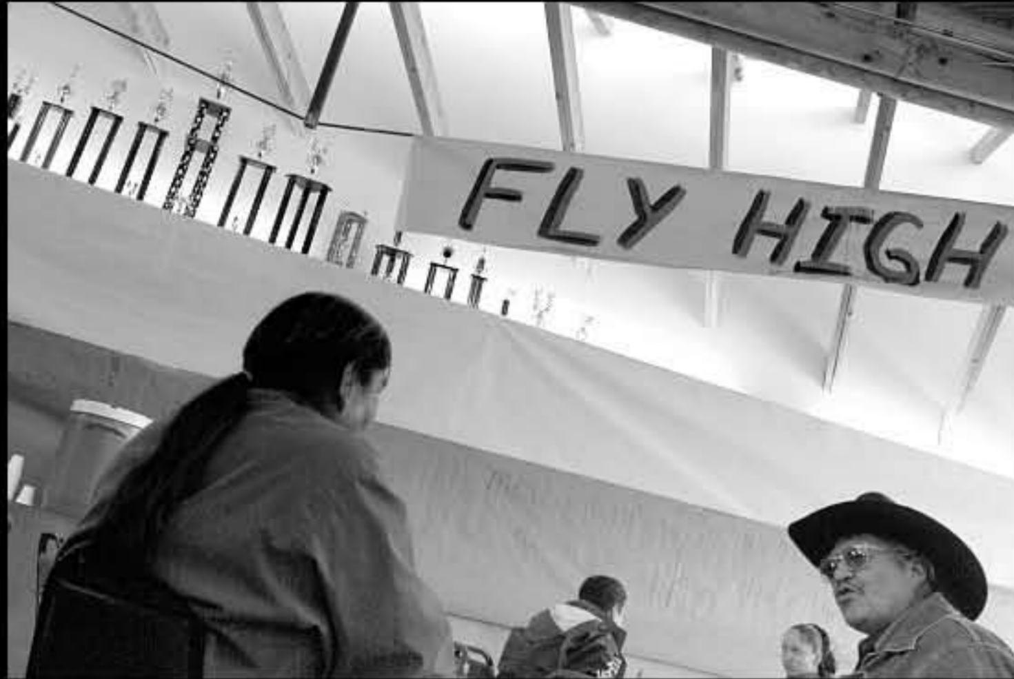
SD Mission, università, mensa