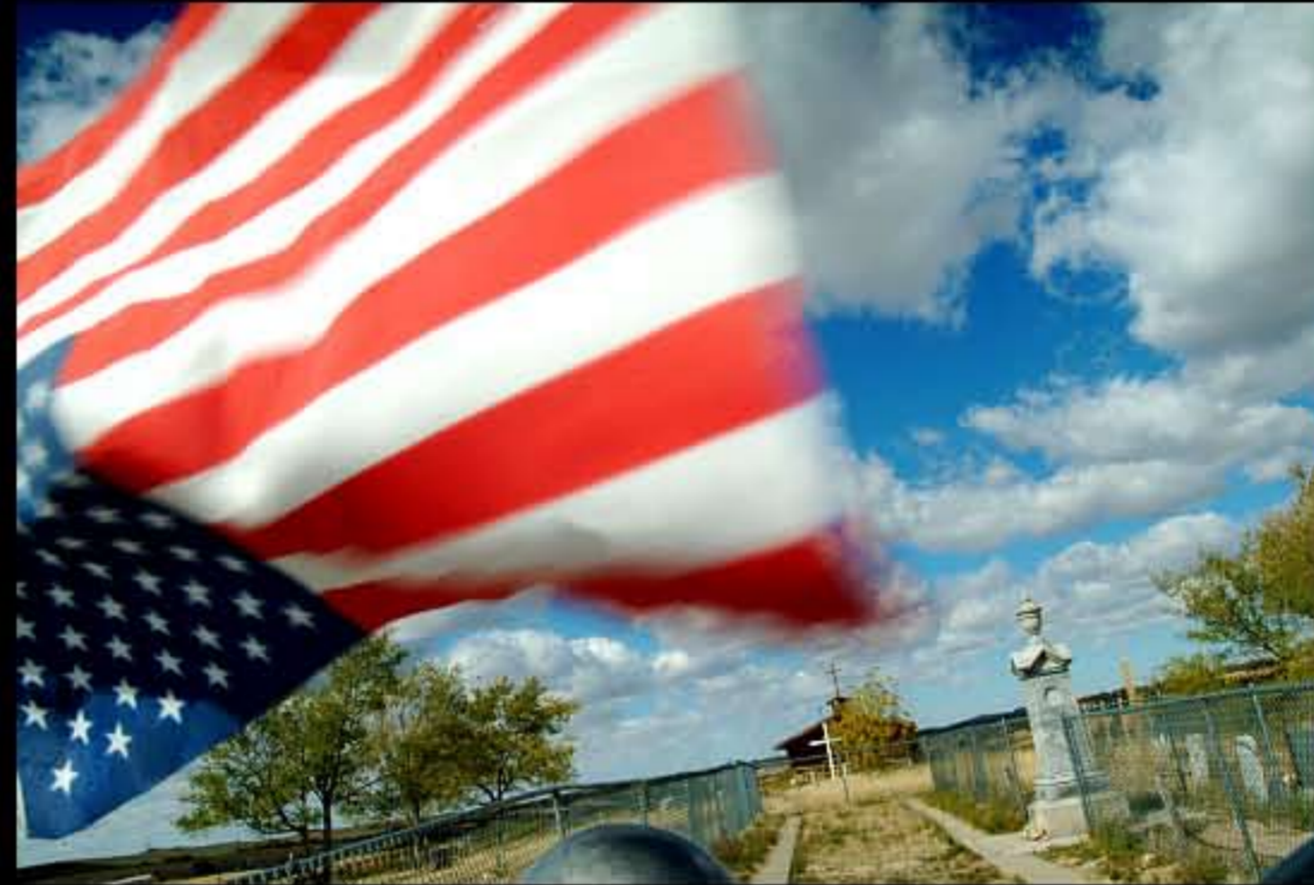
SD Wounded Knee, memoriale