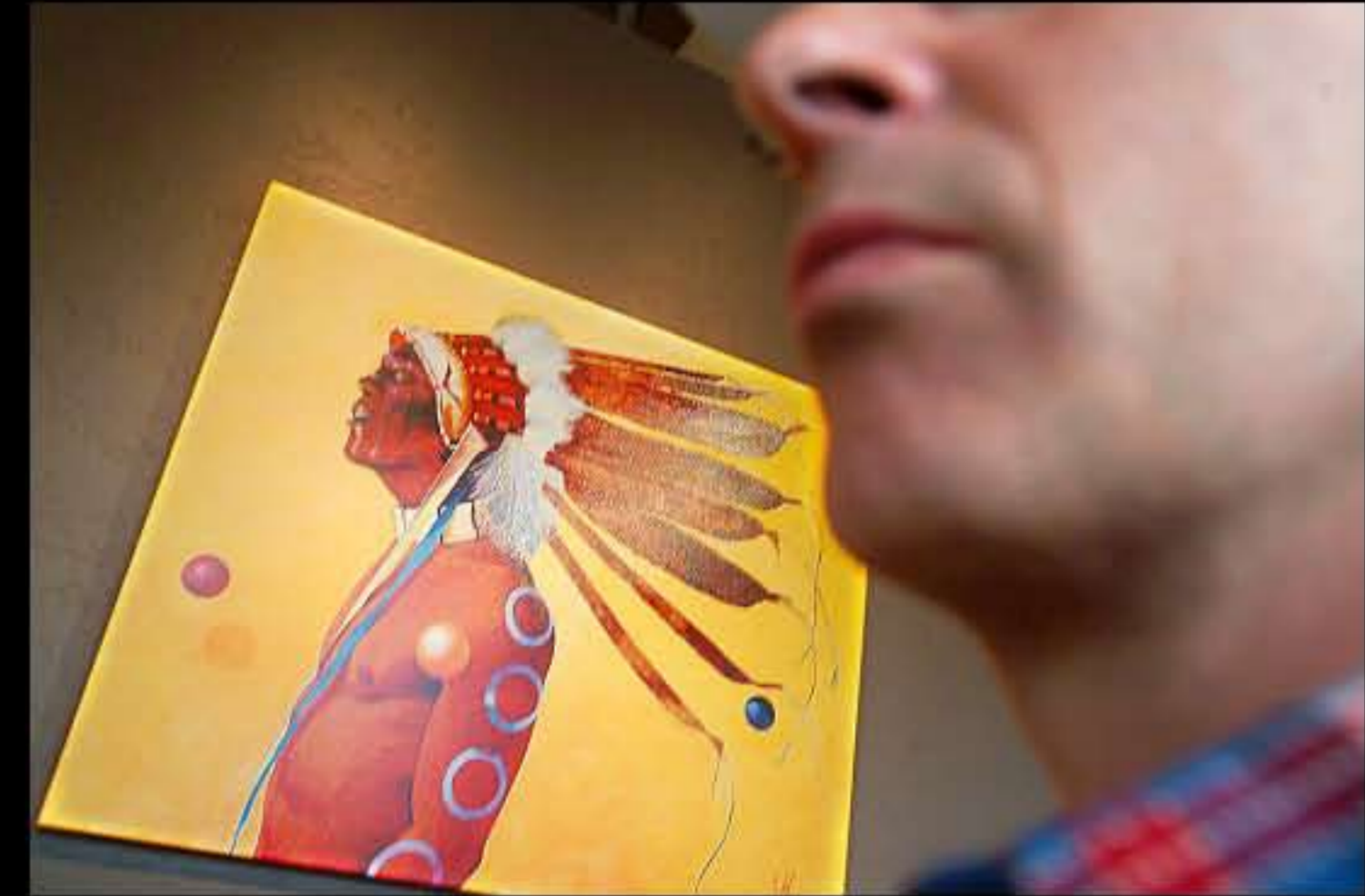
SD Indian Portrait 03