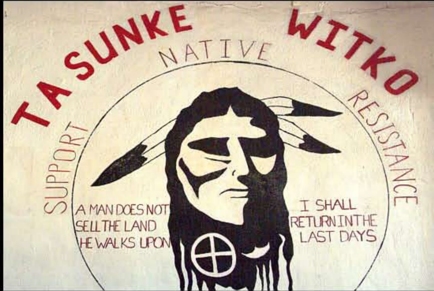
SD Wounded Knee, graffito