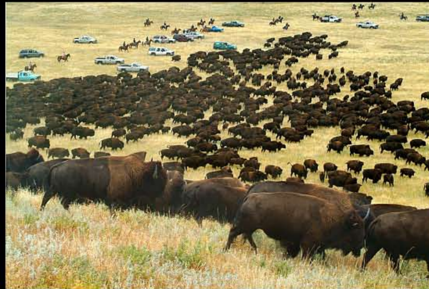
South Dakota Buffalo Roundup 01 fase finale