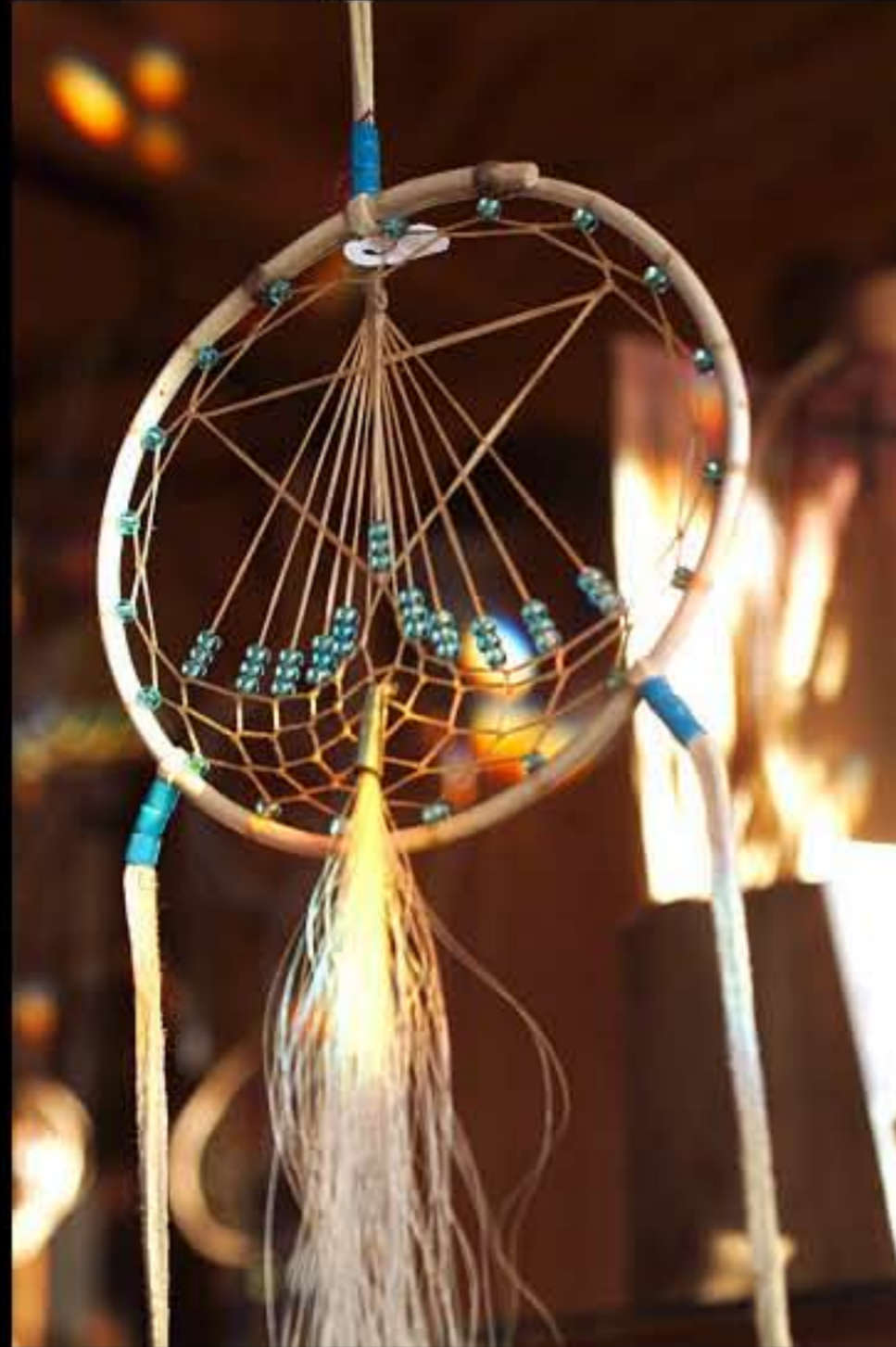
SD artigiano, sogni 1