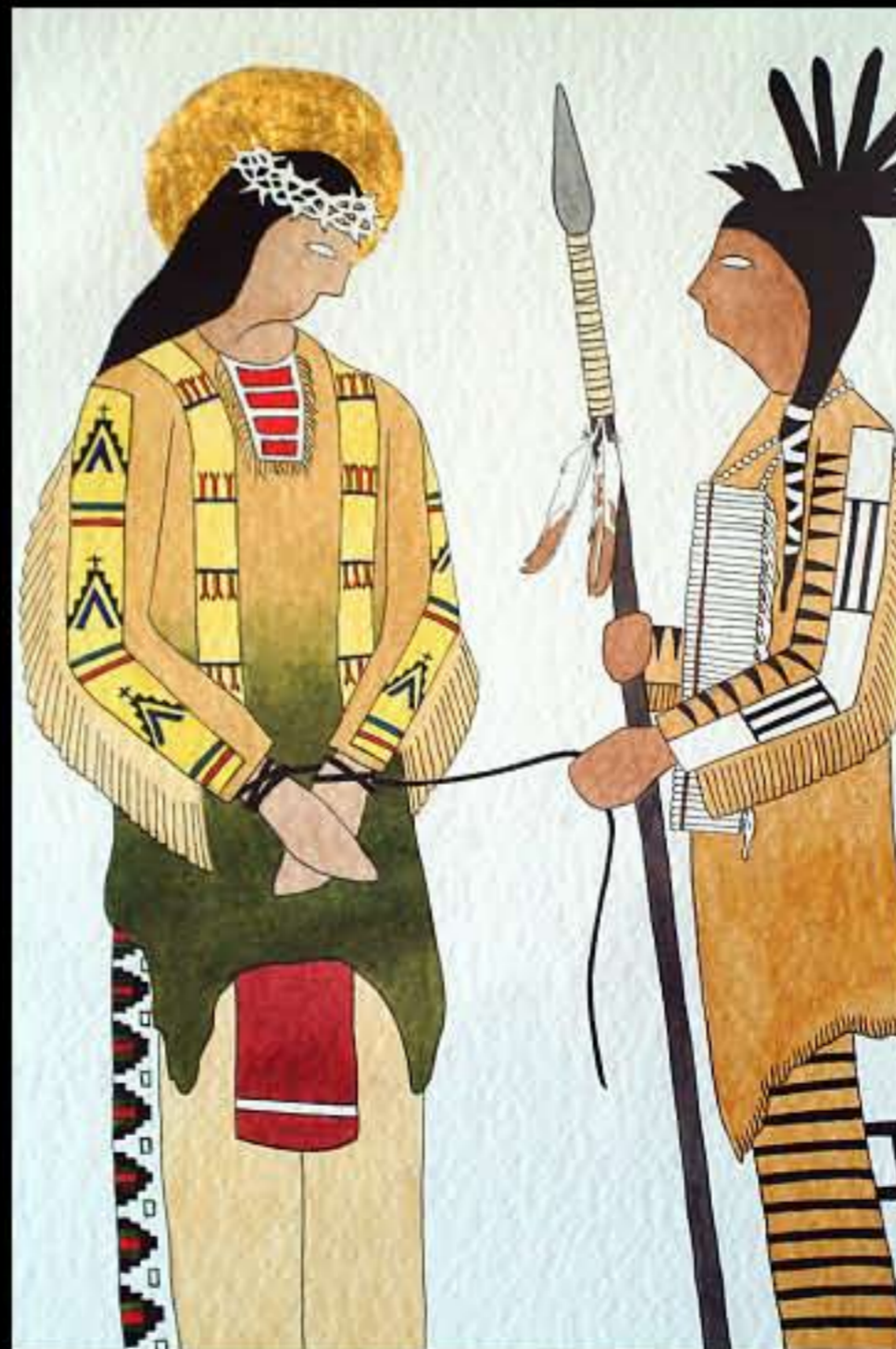
SD Pine Ridge, Red Cloud Indian School 07