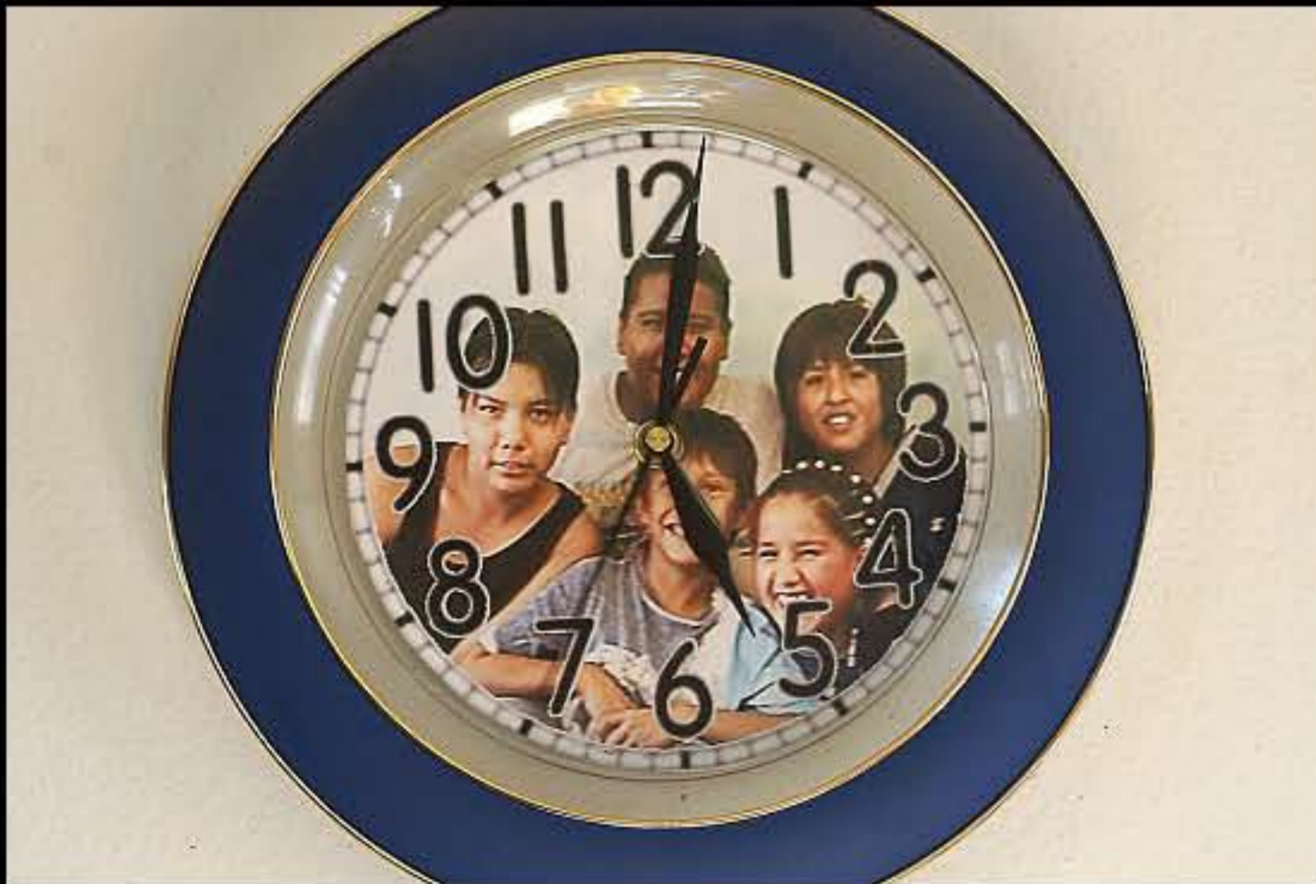
SD Rosebud, foto di famiglia