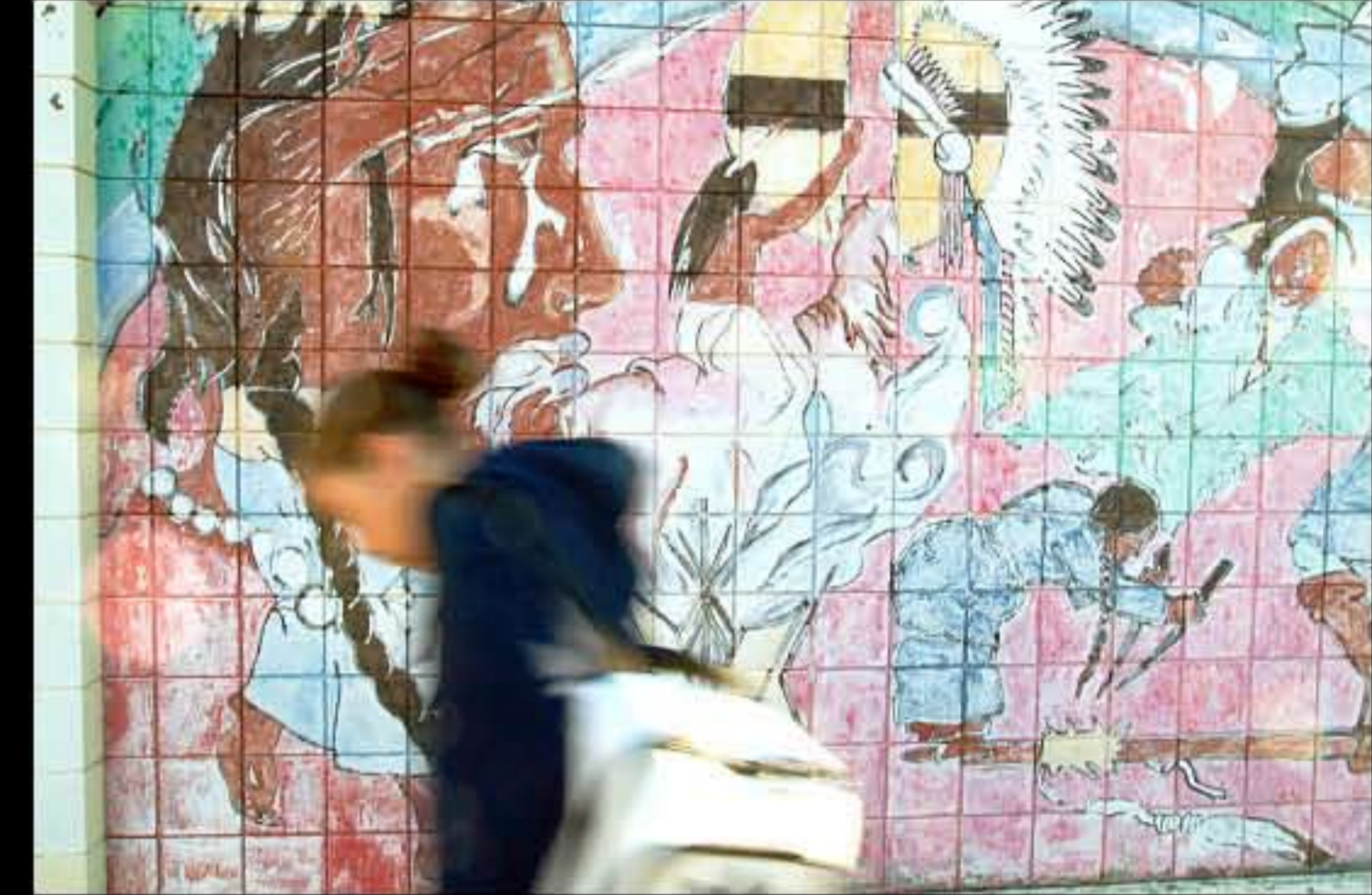
SD Pine Ridge, Red Cloud Indian School 01