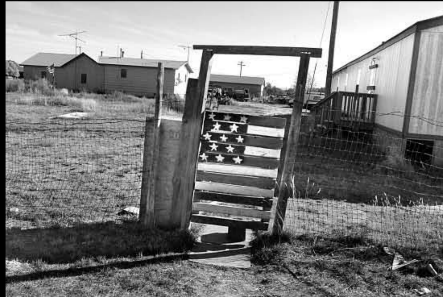
SD Kyle 03