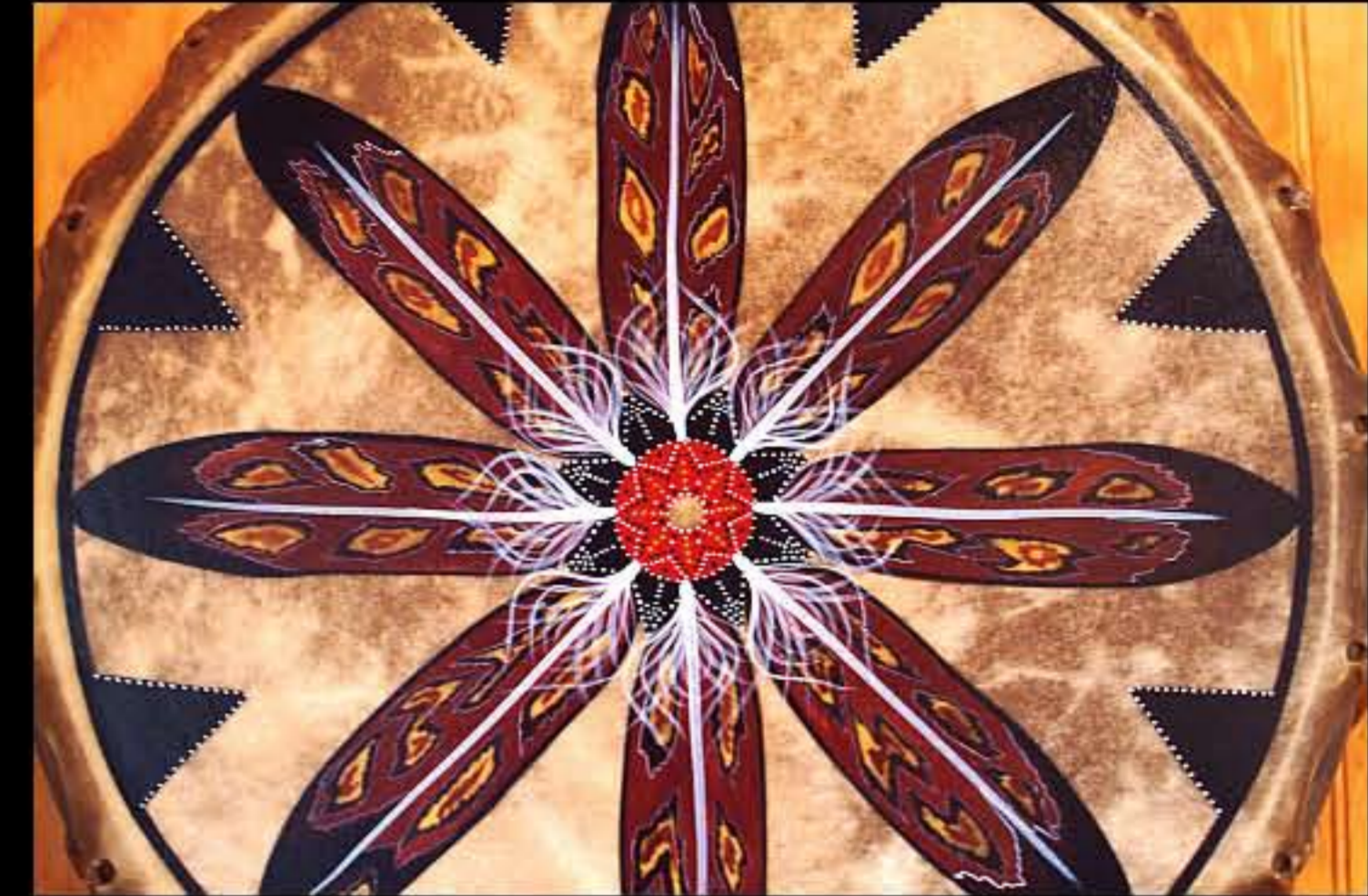
SD artigiano, tamburo