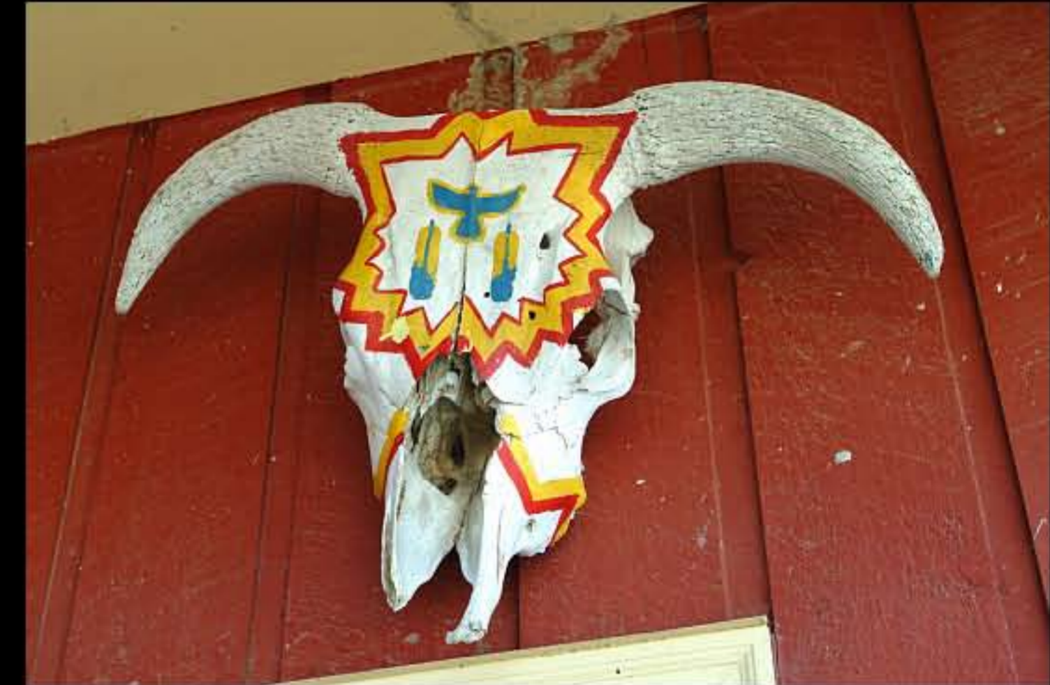
SD Kyle 07