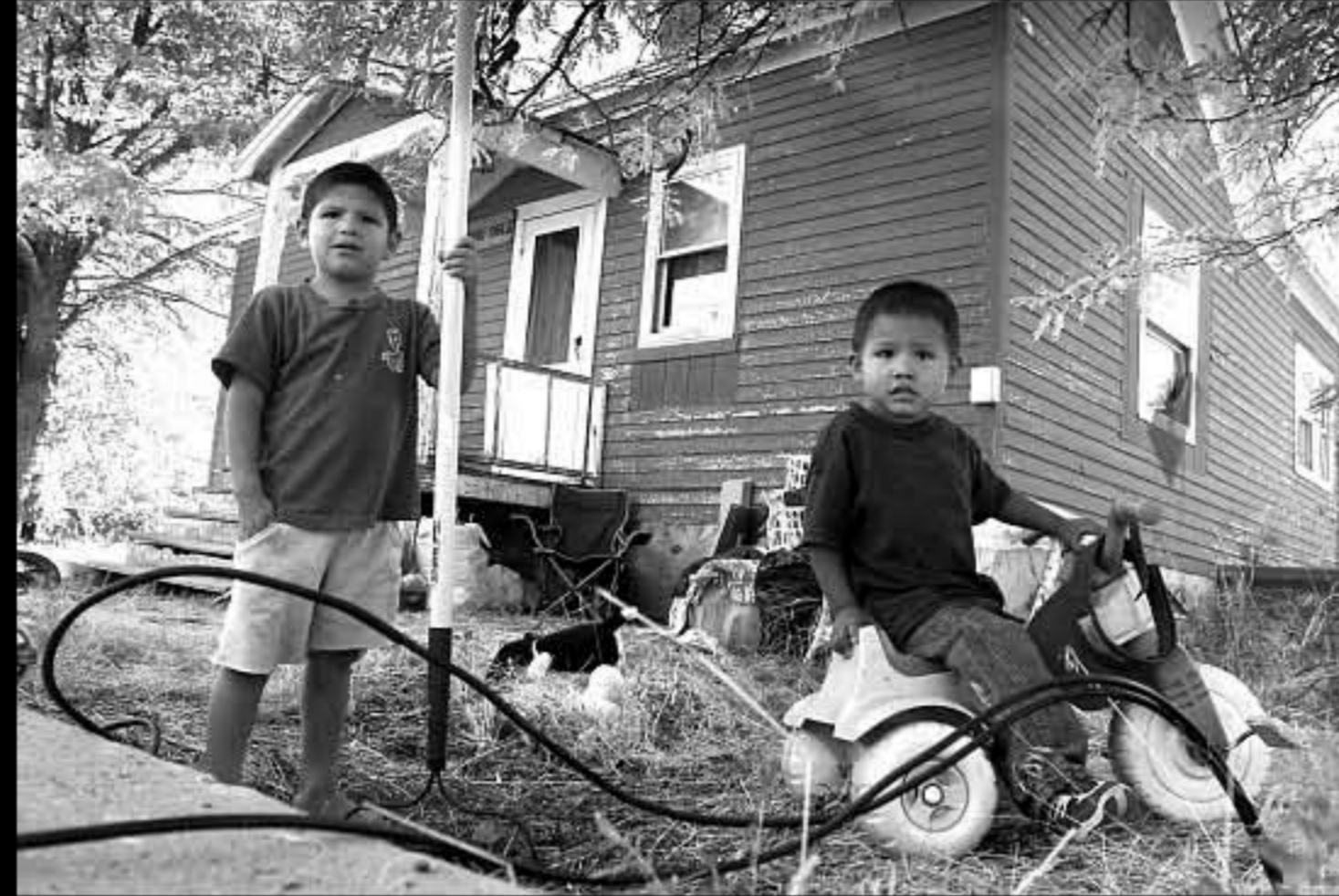
SD Rosebud 2