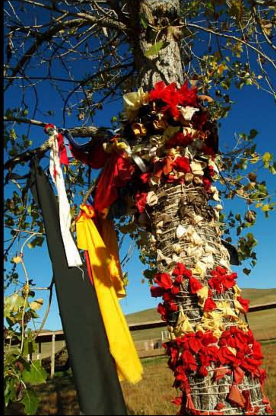
SD Pine Ridge, luogo della danza del sole 1