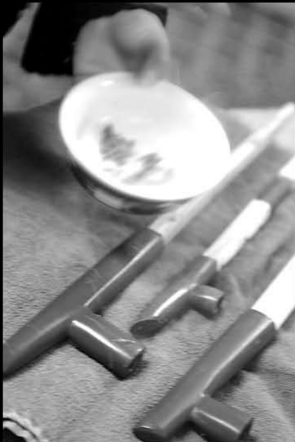
SD Pine Ridge, rito con pipe dela pace