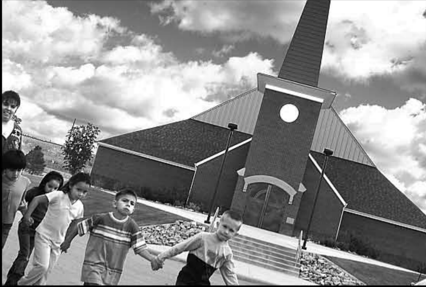
SD Pine Ridge, Red Cloud School 08