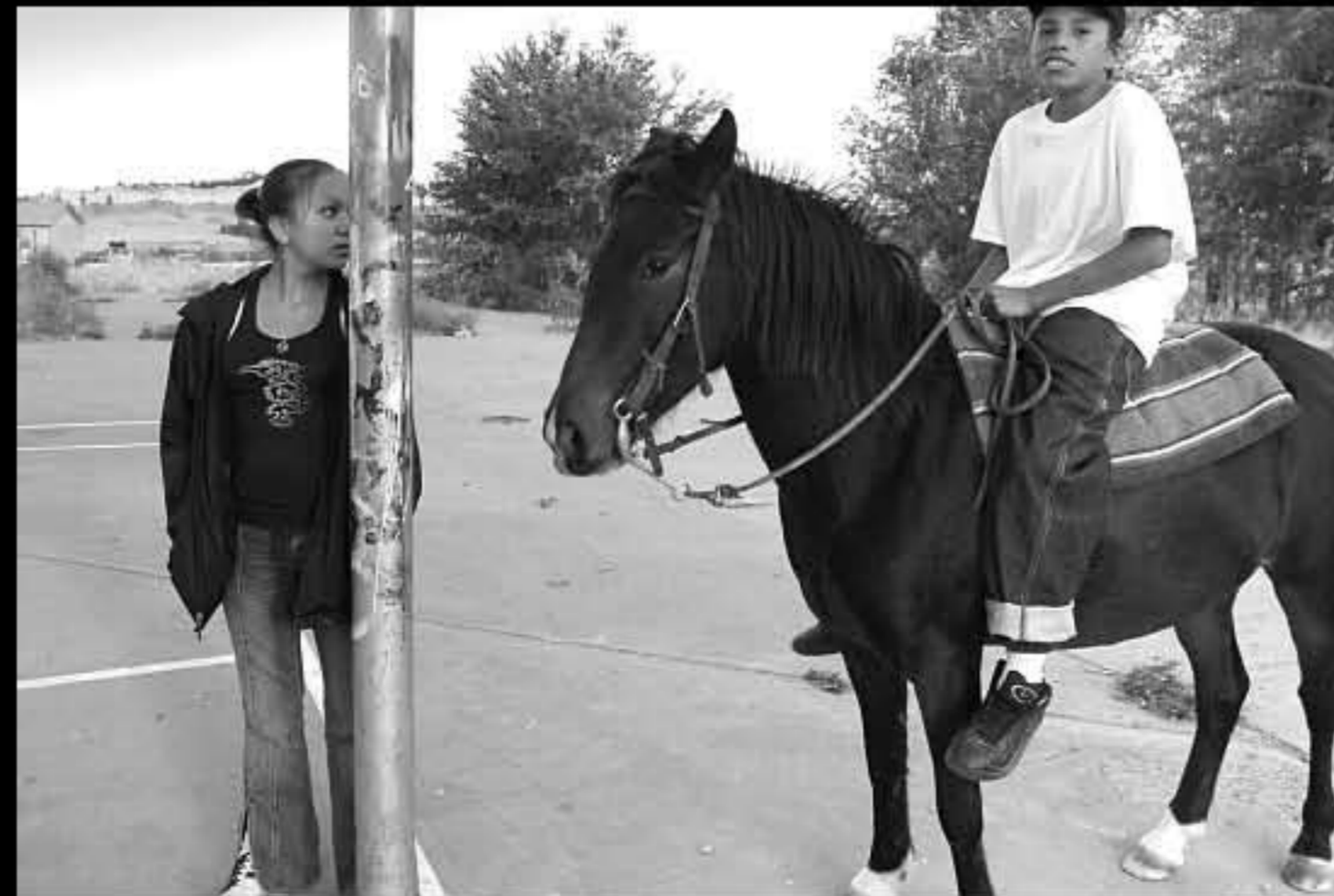
SD Manderson 01