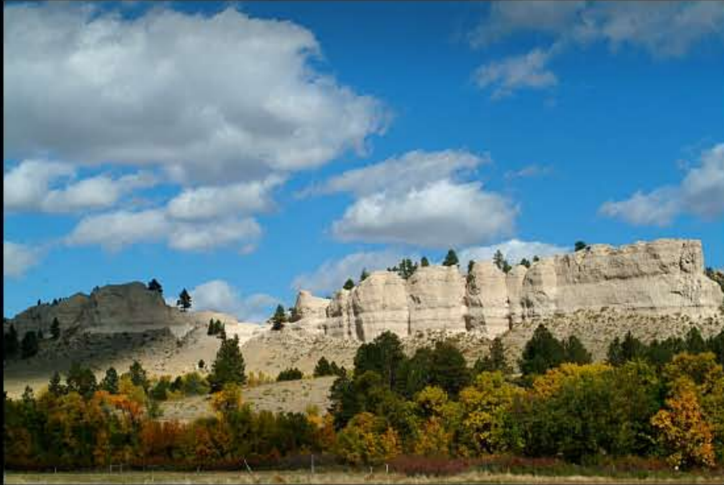
SD Pine Ridge, dintorni