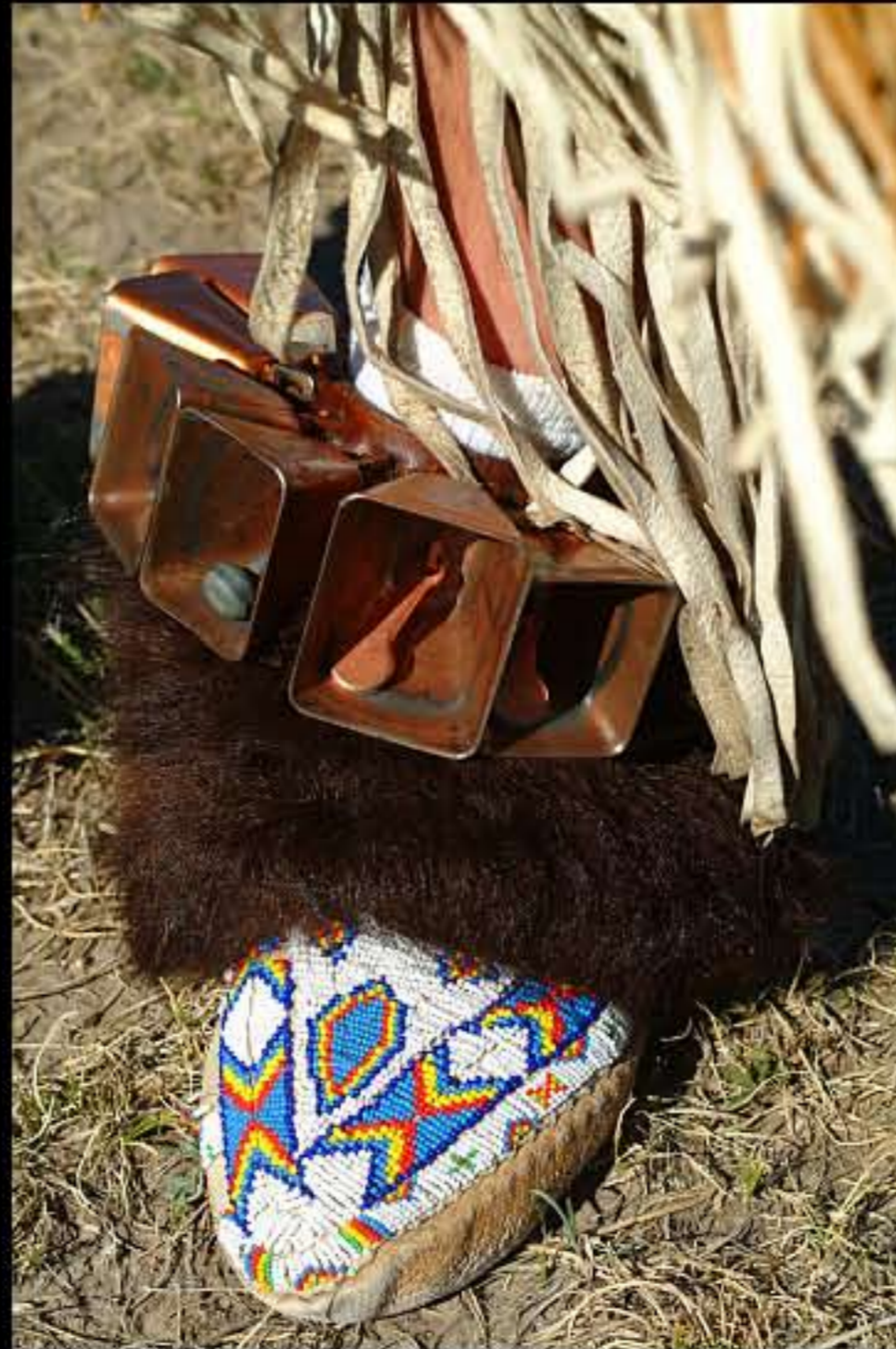
SD Kyle Ron Pesce 7