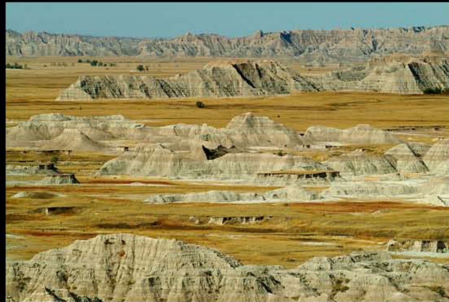
Badlands Loop Scenic Byway 08