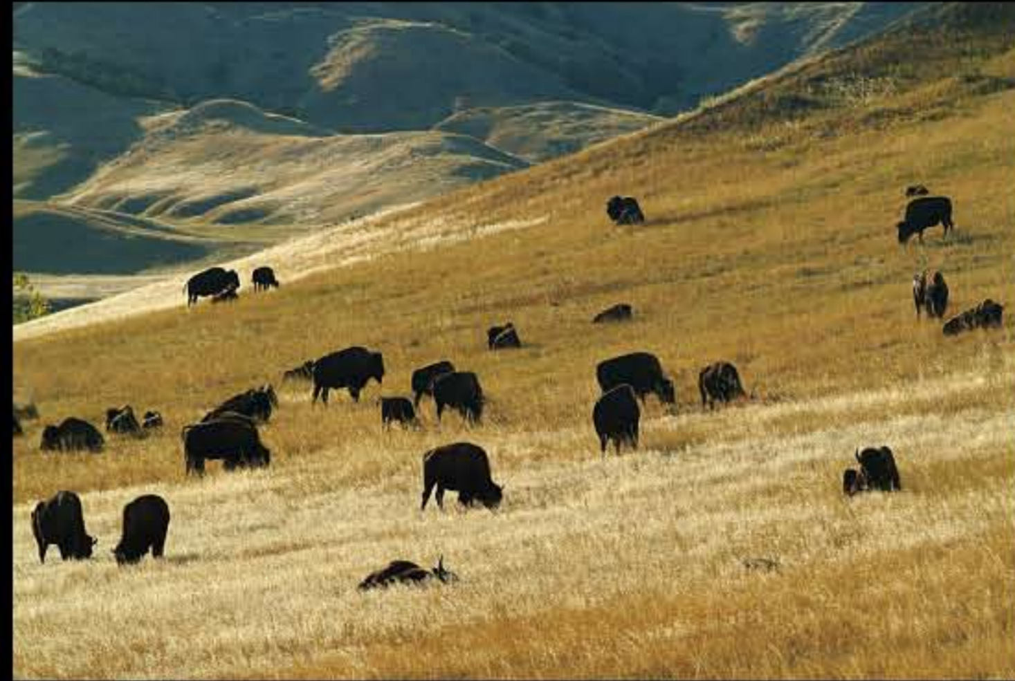
Badlands bisonti 01