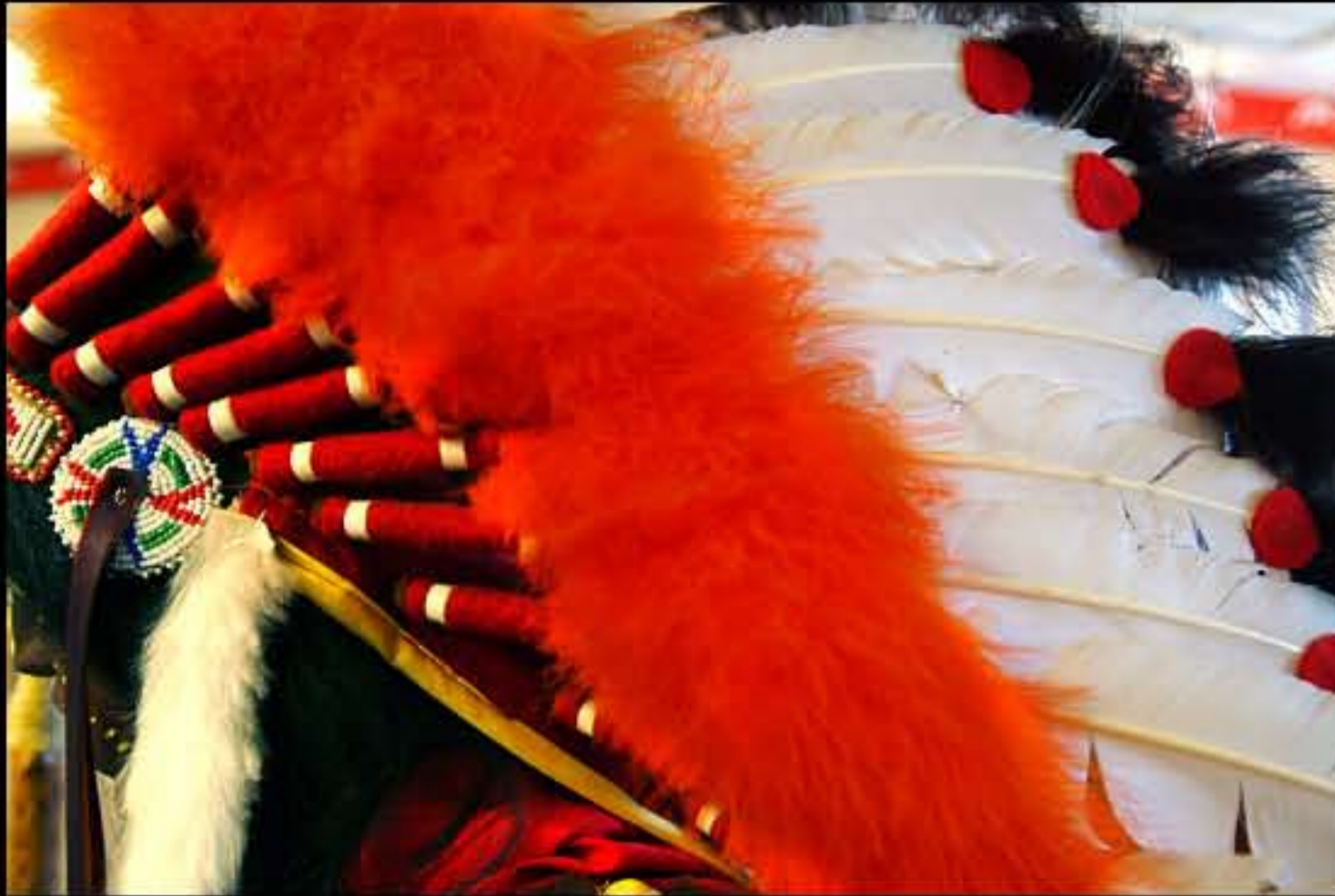
SD artigiano, copricapo 2