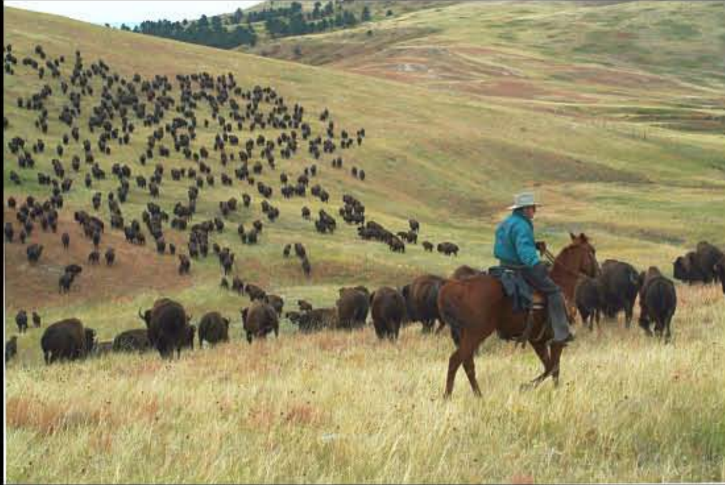
South Dakota Buffalo Roundup 06