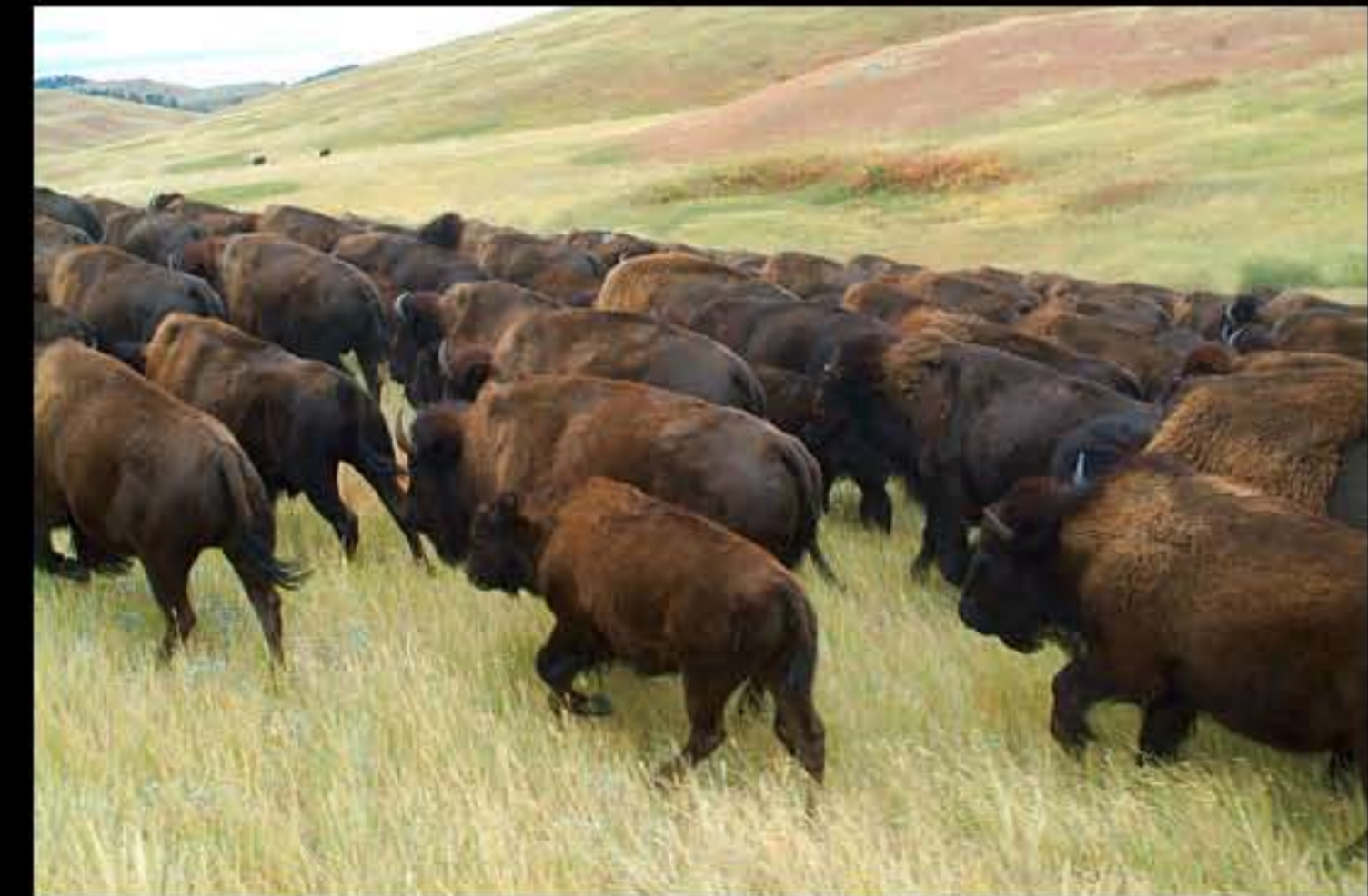
South Dakota Buffalo Roundup 02