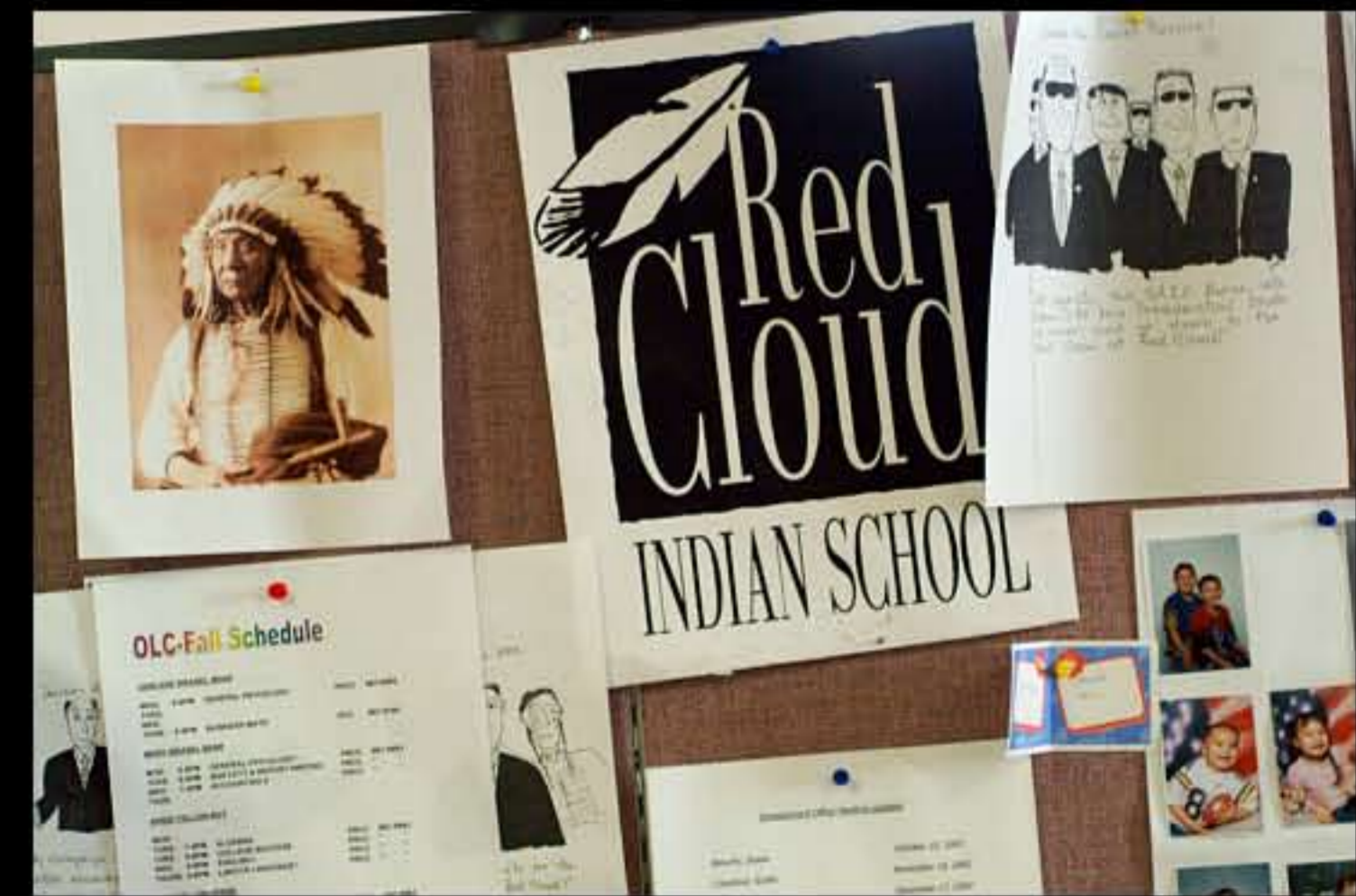
SD Pine Ridge, Red Cloud Indian School 08