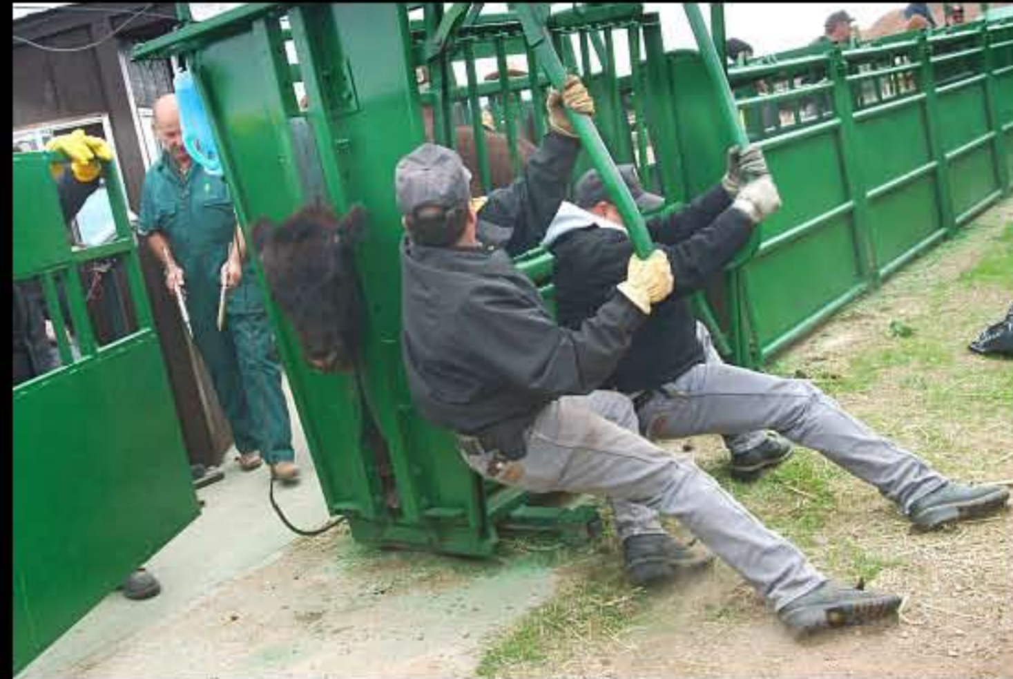
South Dakota Buffalo Roundup marchiatura 3