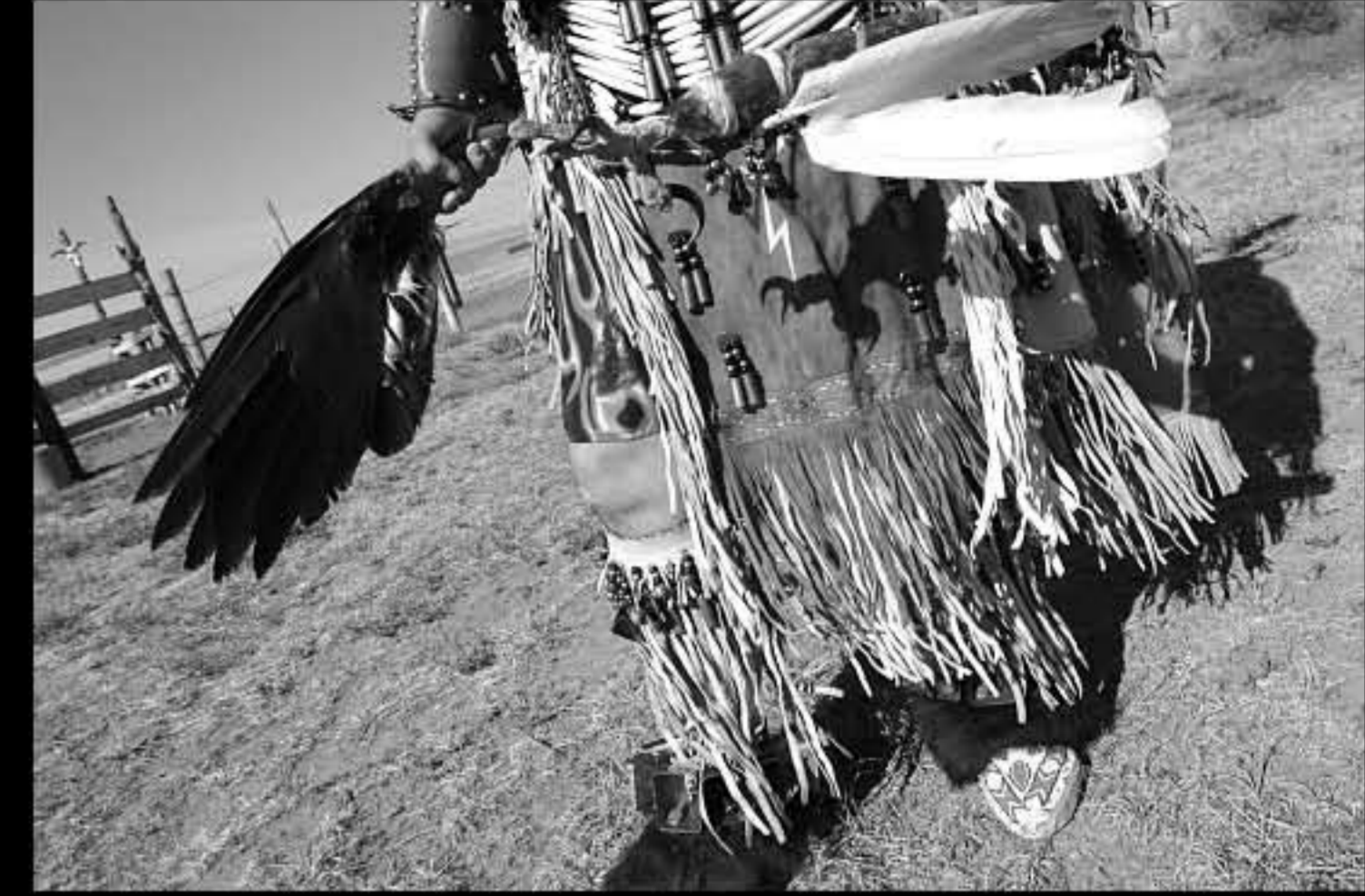
SD Kyle Ron Pesce 4