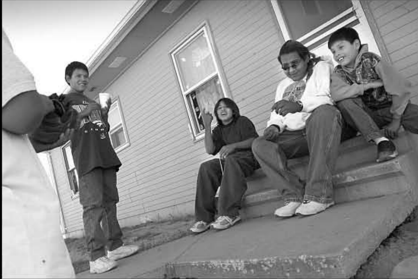
SD Rosebud 1