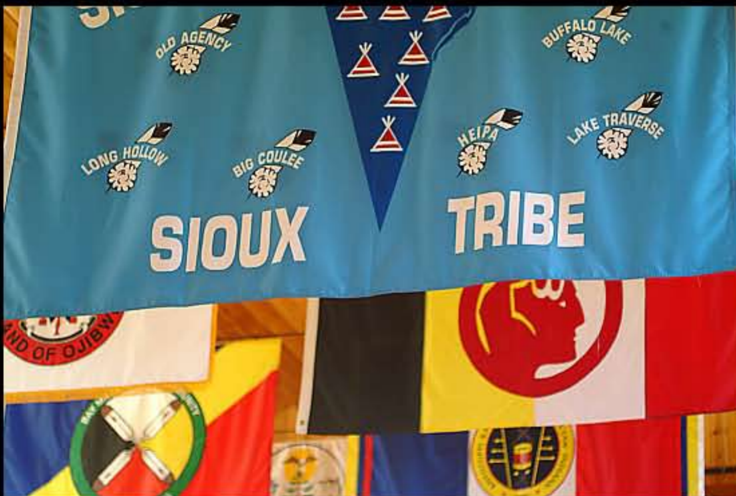
SD bandiere sioux