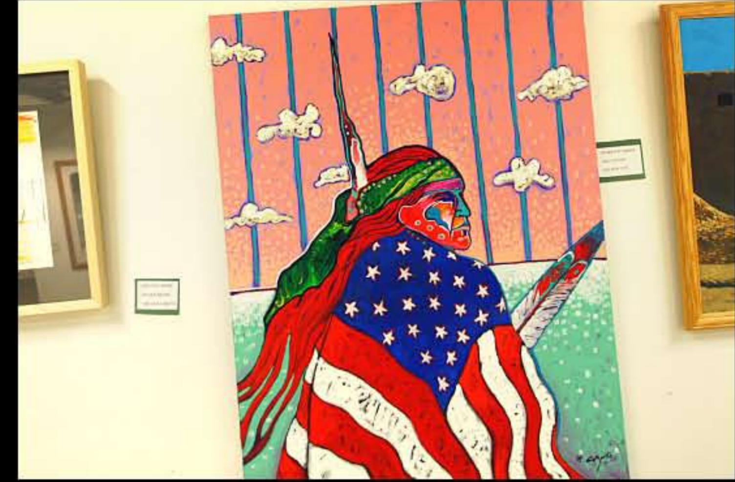
SD Pine Ridge, Red Cloud School, galleria 1