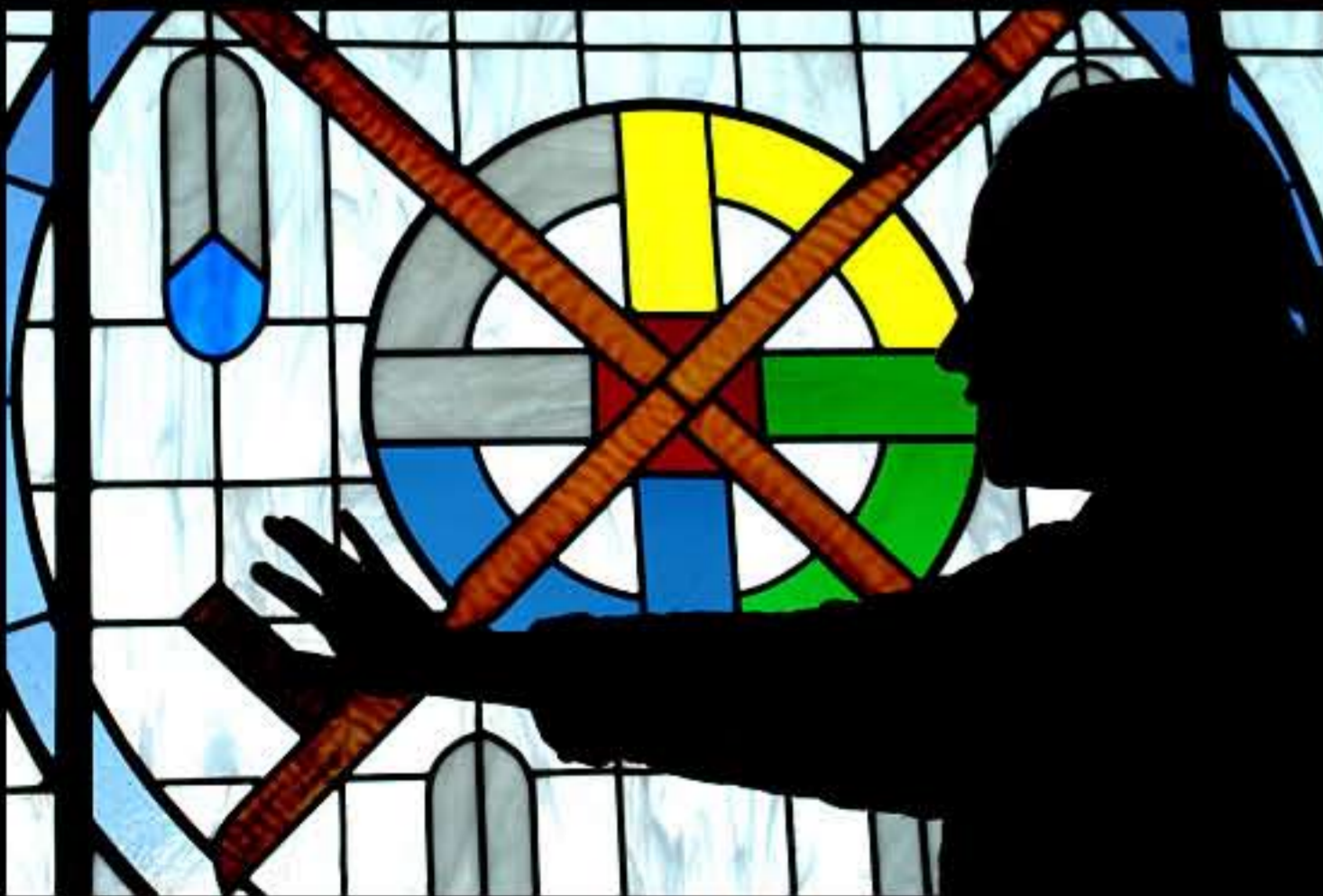
SD Pine Ridge, Red Cloud Indian School 05