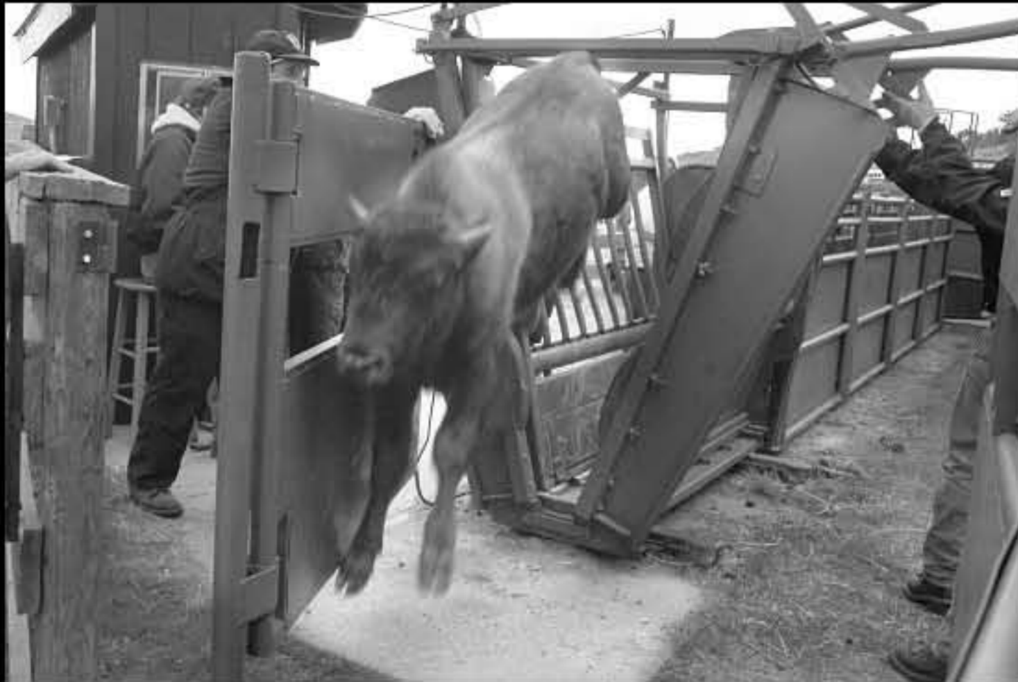
South Dakota Buffalo Roundup marchiatura 1