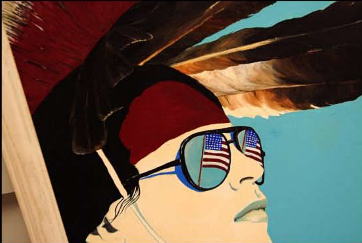
SD Indian Portrait 04