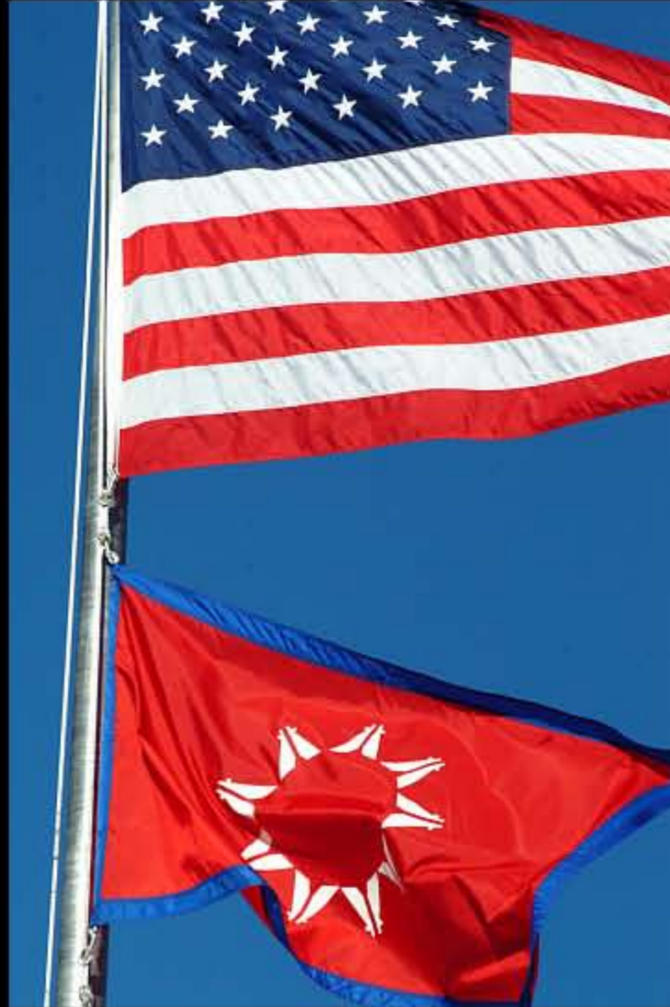
SD Pine Ridge, Red Cloud School, bandiera Lakota e Usa 2