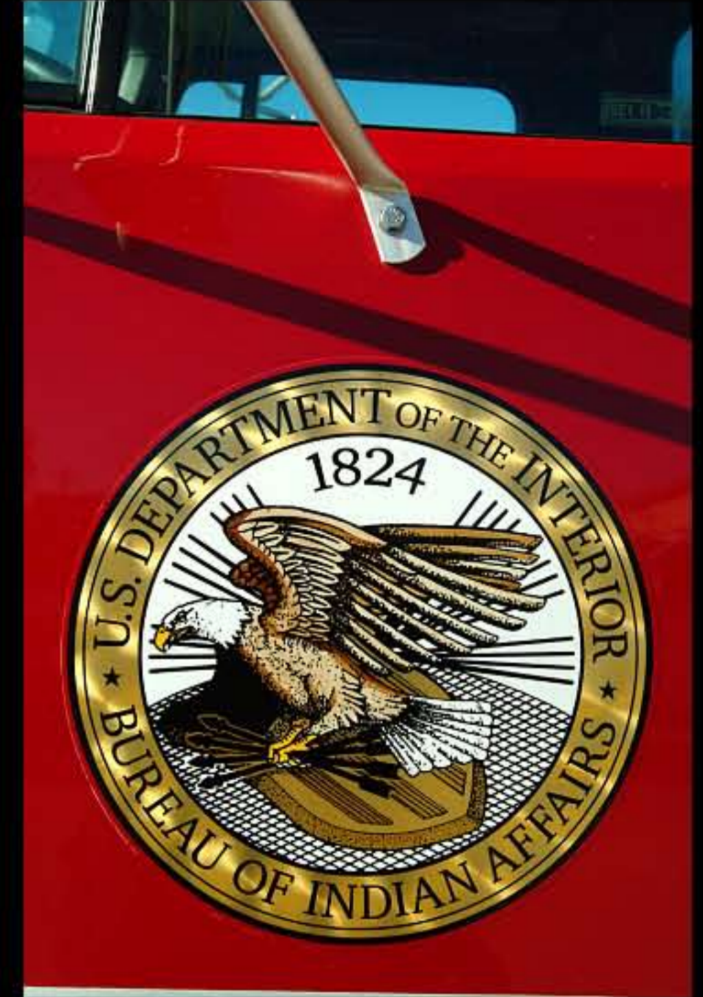
SD Rosebud, camoin dei vigili del fuoco