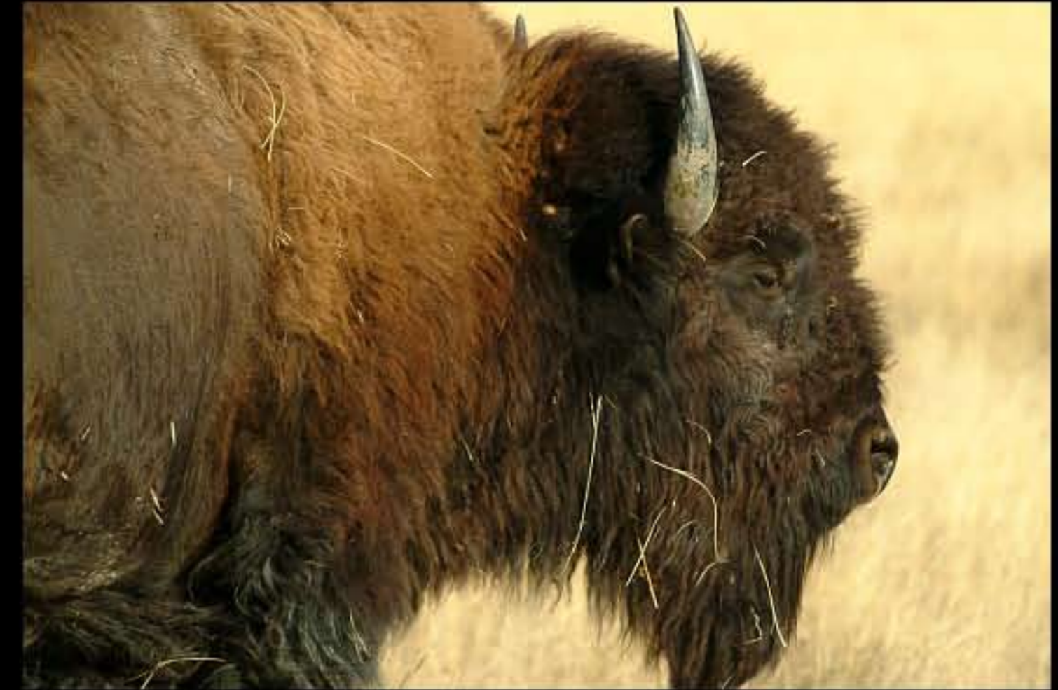
Badlands bisonti 02