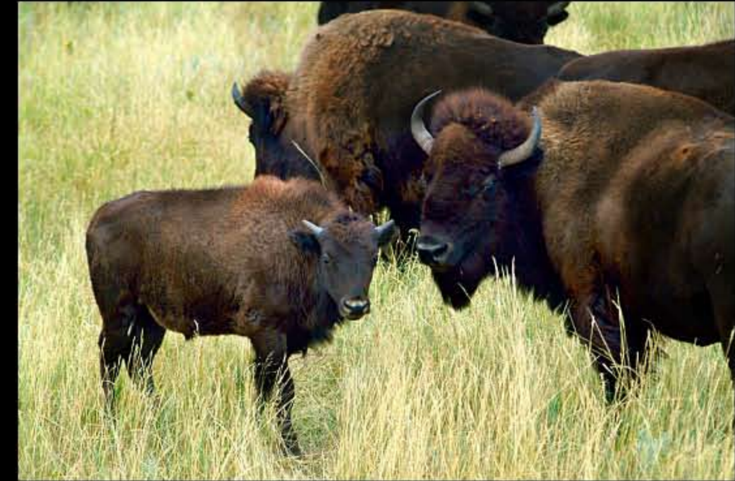
South Dakota bisonti 11