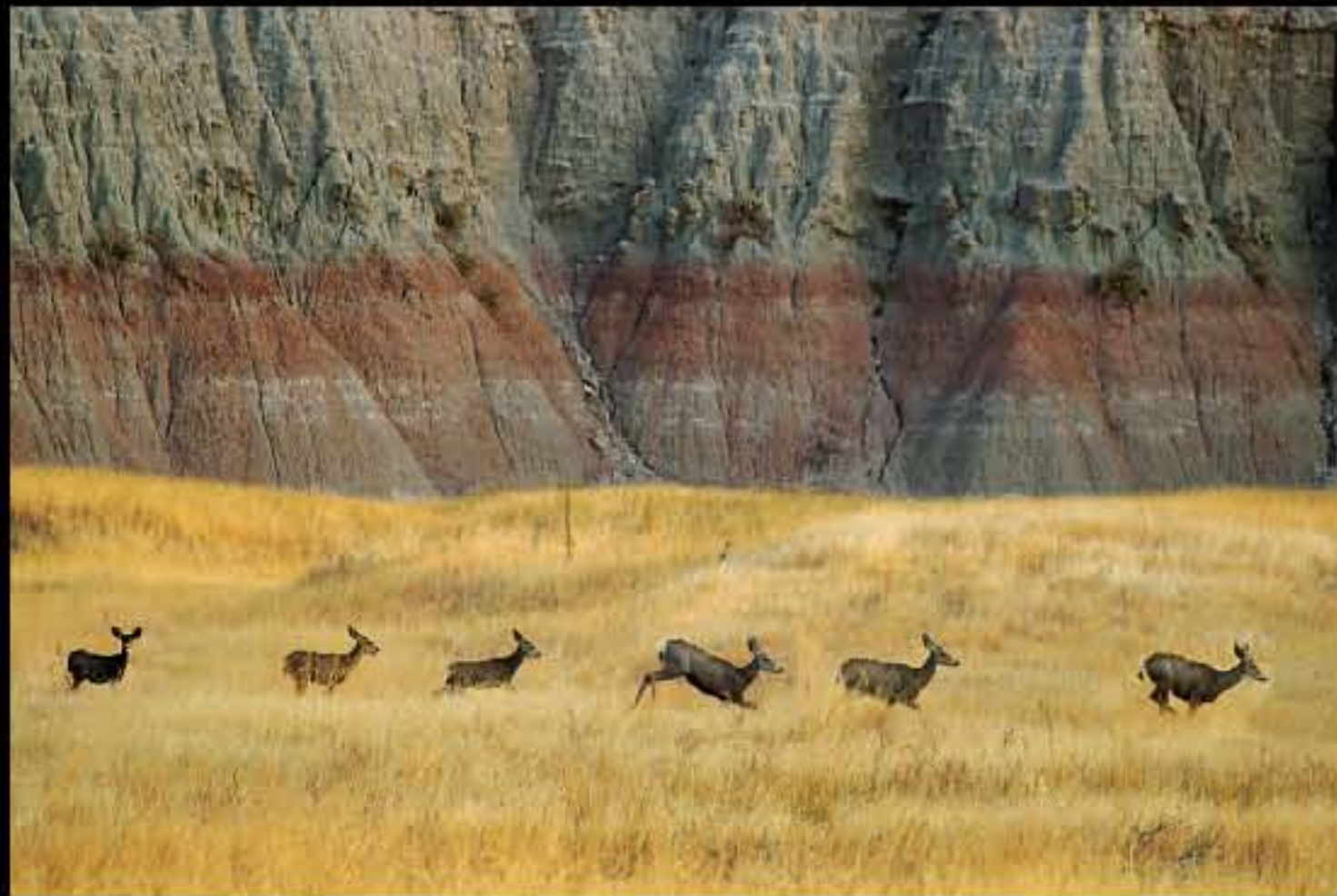
Badlands Cedar Pass 1