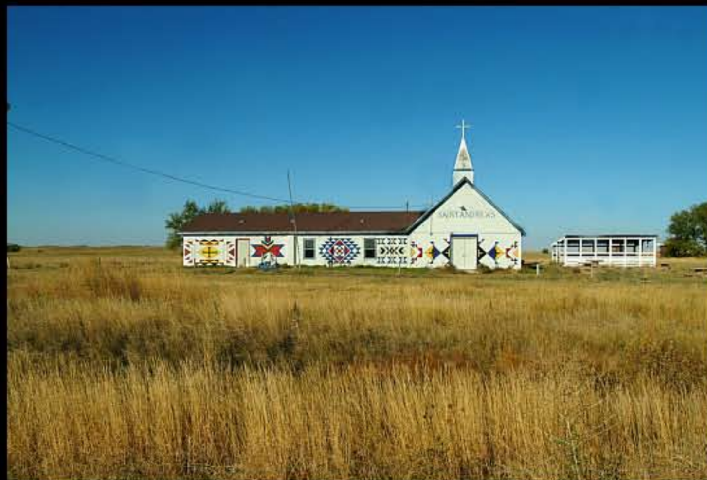
SD Batesland, chiesa con dipinti indiani 1