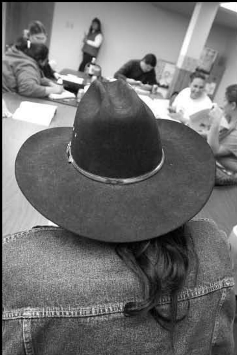
SD Mission, università, lezione di lingua lakota 2