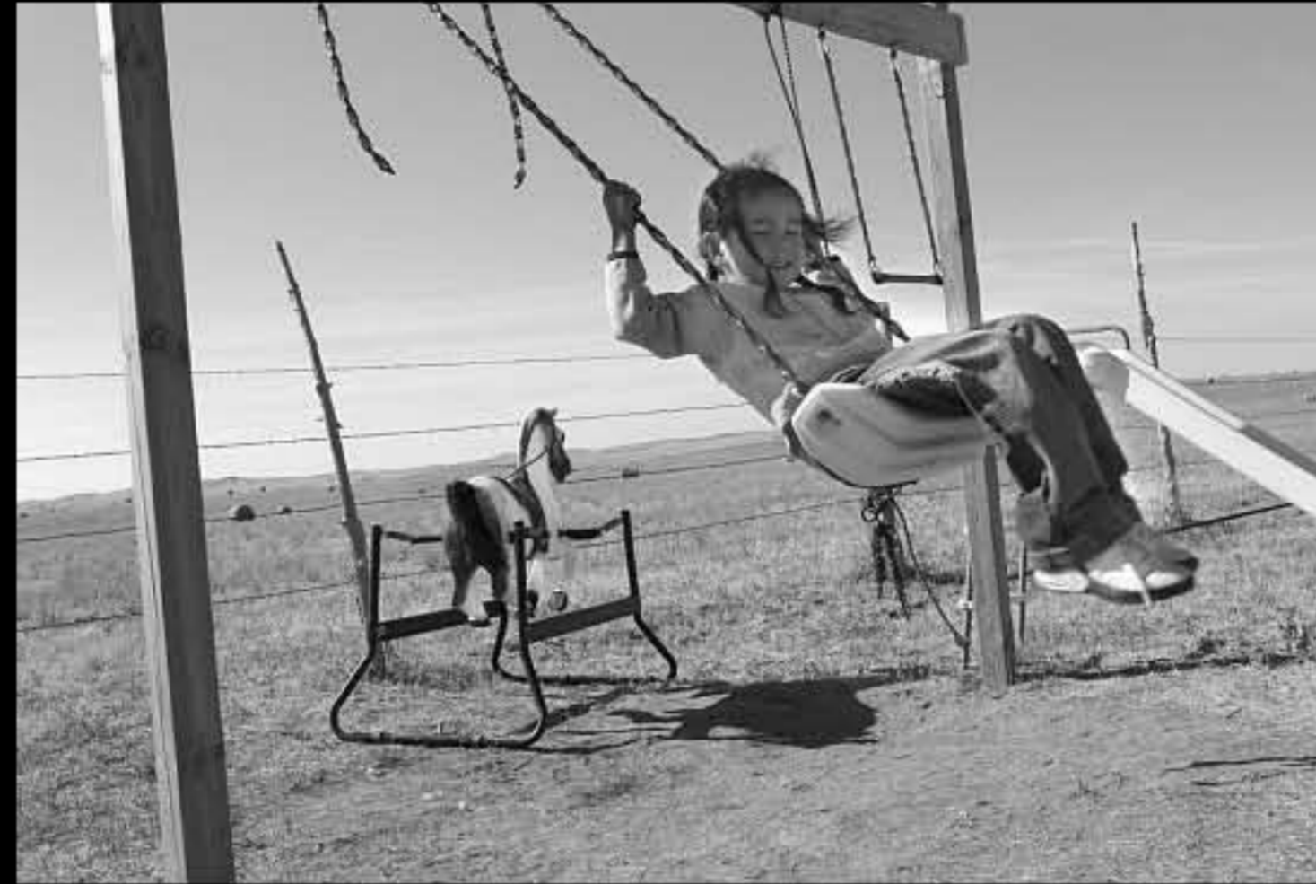
SD Kyle, bambino Colt 2