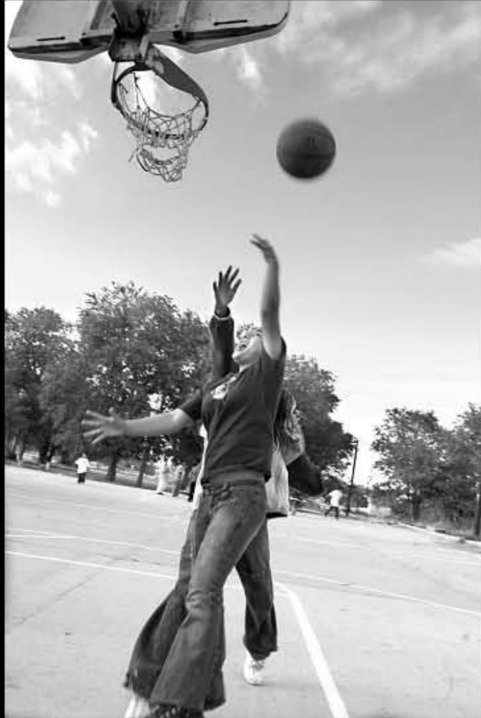
SD Manderson, basket