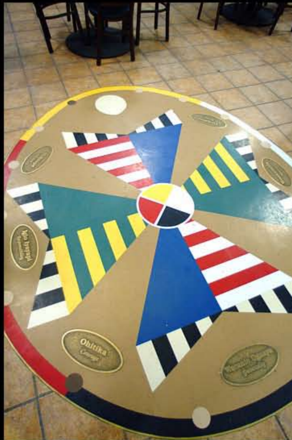
SD Pine Ridge, simboli Lakota nel locale Big Bat