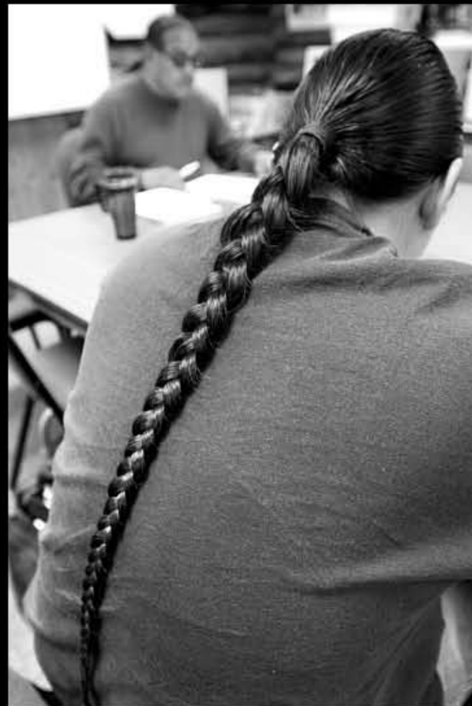
SD Mission, università, lezione di lingua lakota