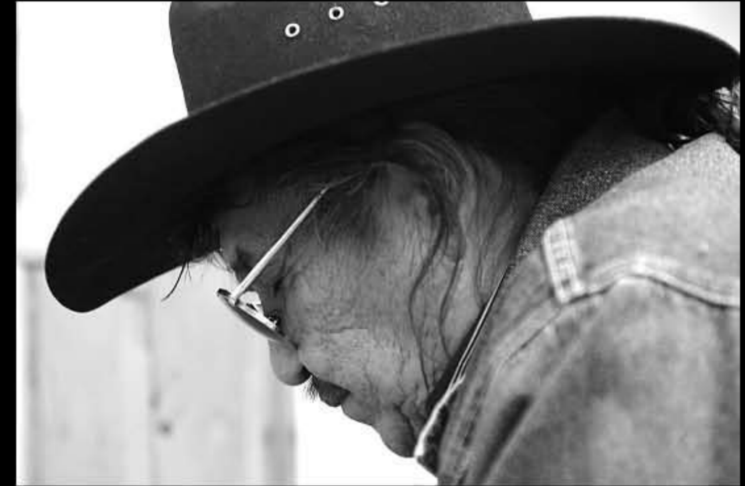
SD Mission, università, università, lezione di lingua Lakota