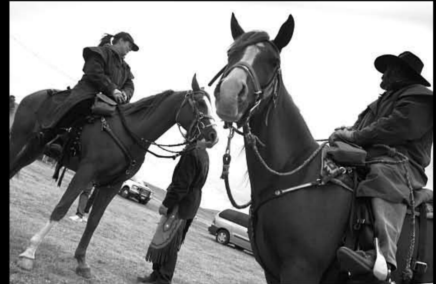
South Dakota cow boy 2