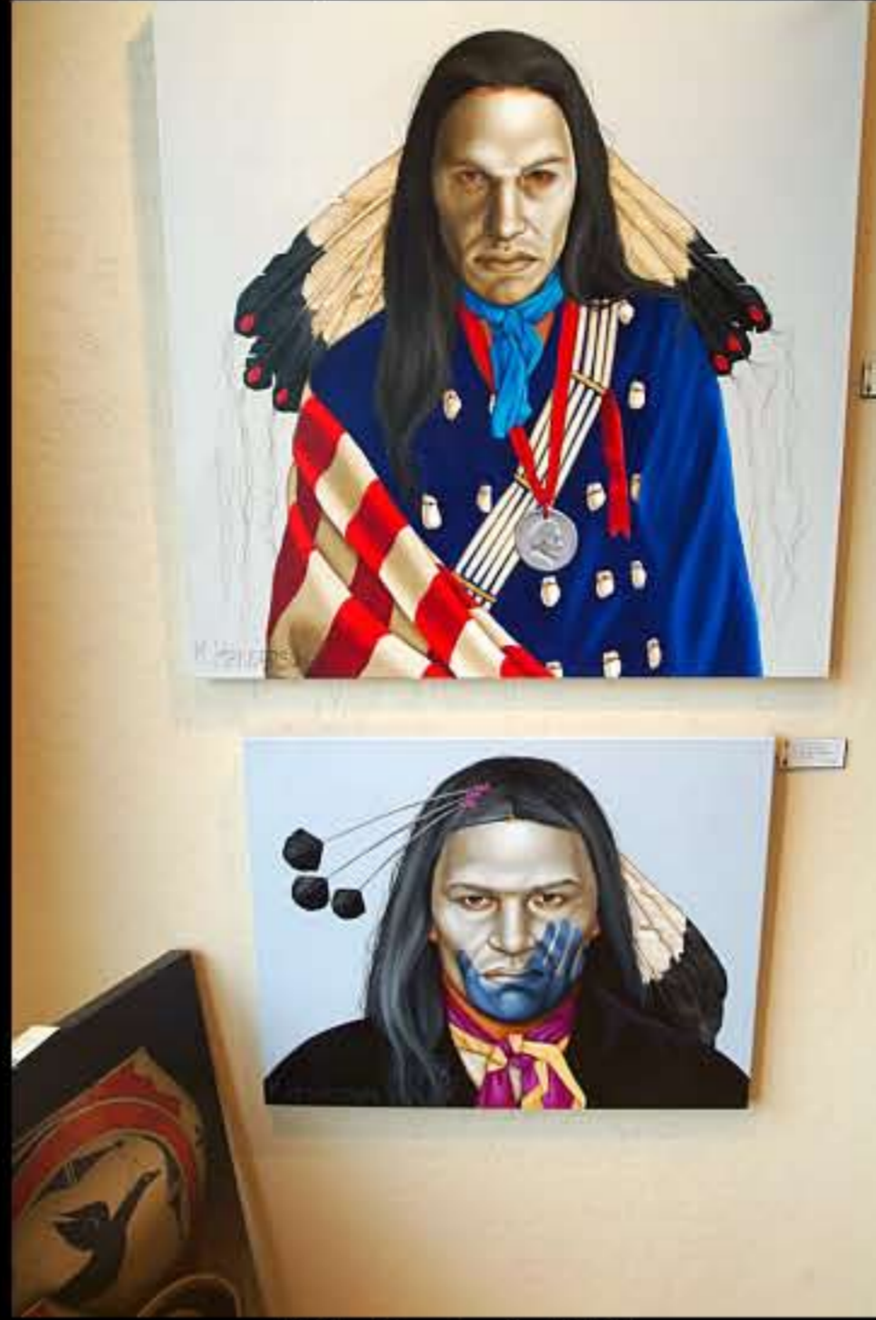
SD Indian Portrait 02