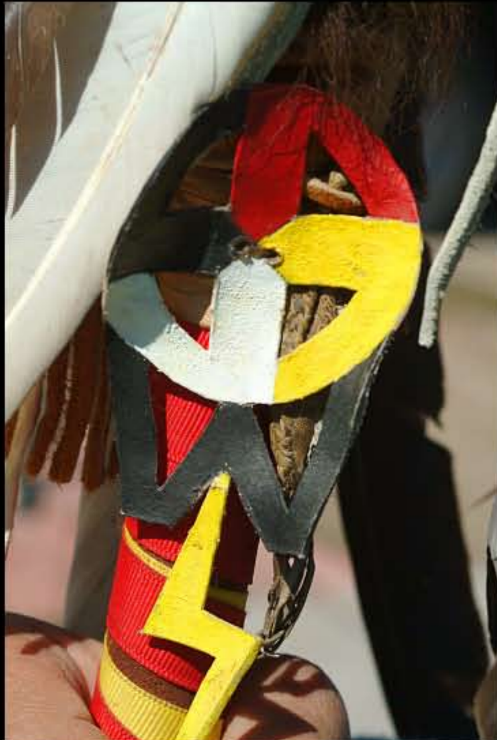
SD Kyle, ruota della medicina