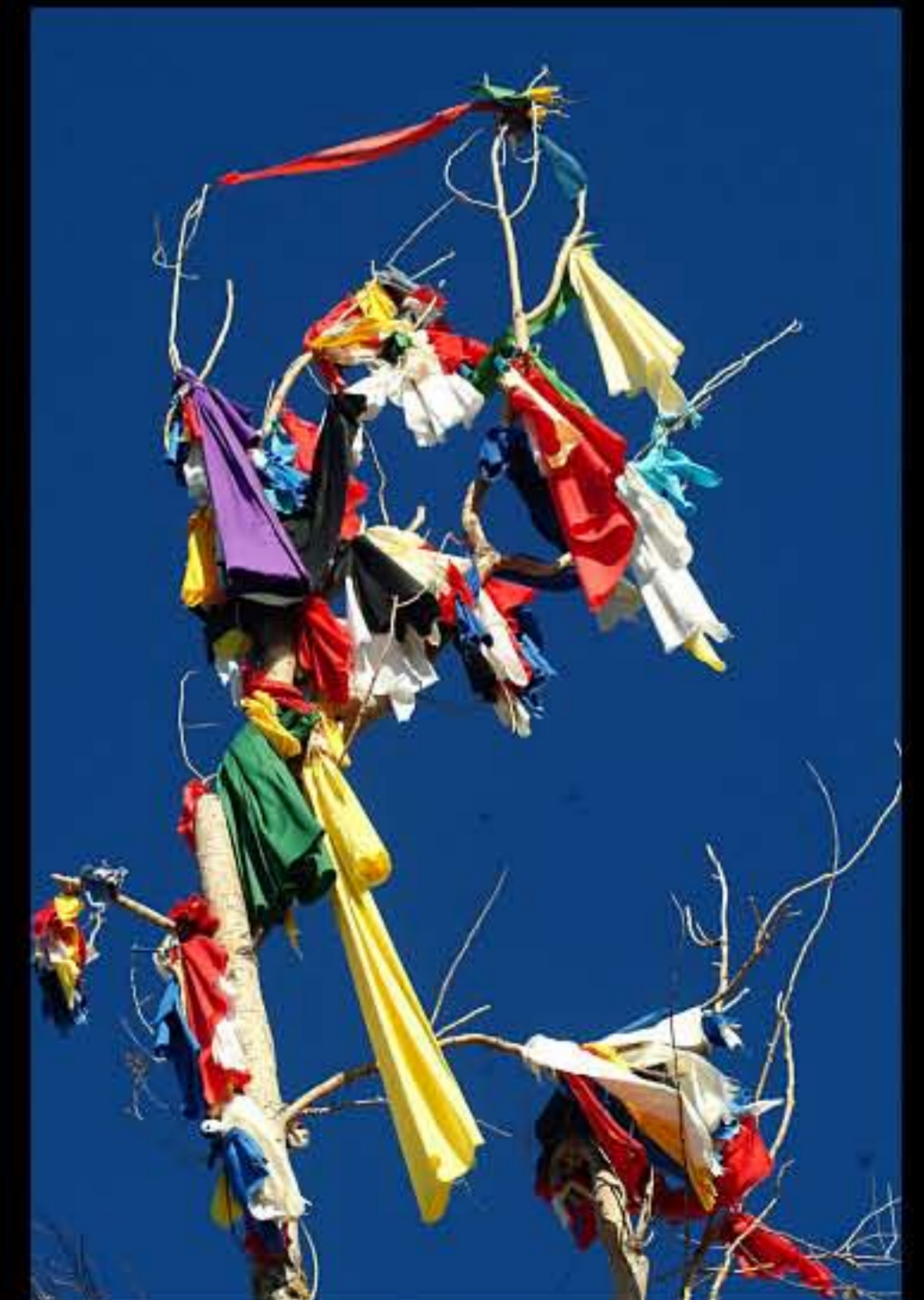
SD Pine Ridge, abbellimenti sul luogo della danza del sole