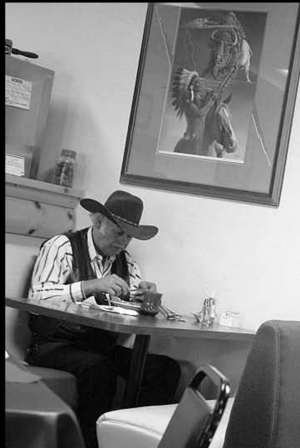
SD Pine Ridge 05