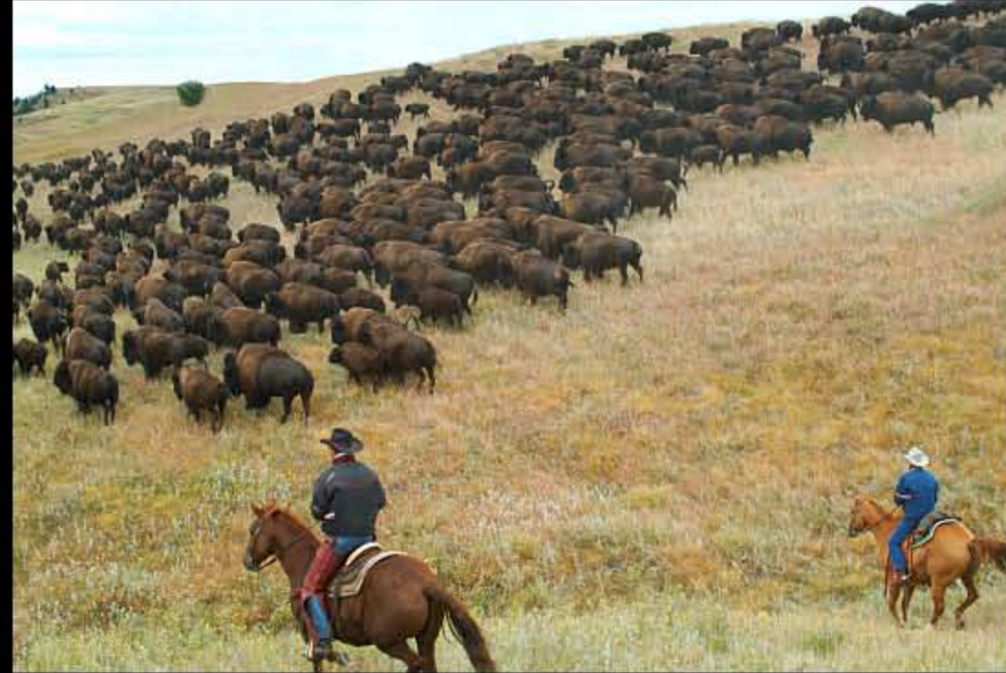
South Dakota Buffalo Roundup 08