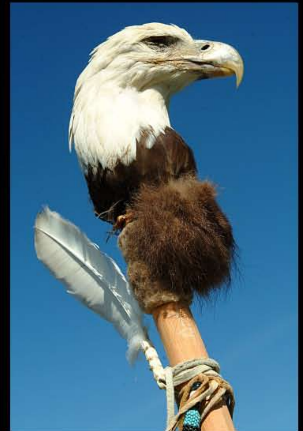
SD Kyle 04