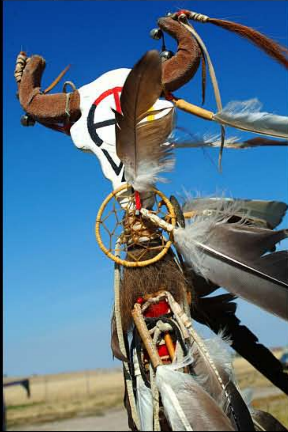
SD Kyle 05