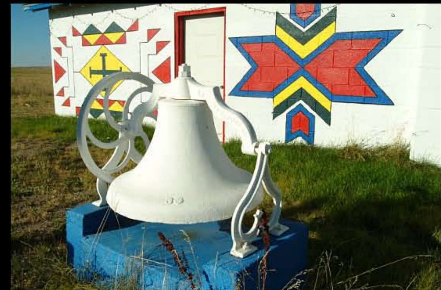
SD Batesland, chiesa con dipinti indiani 4