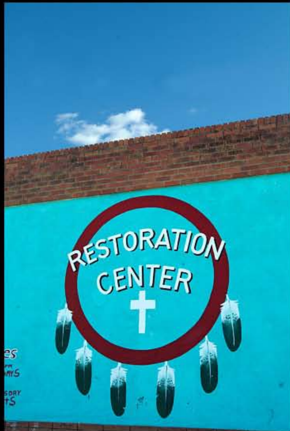
SD Pine Ridge 02