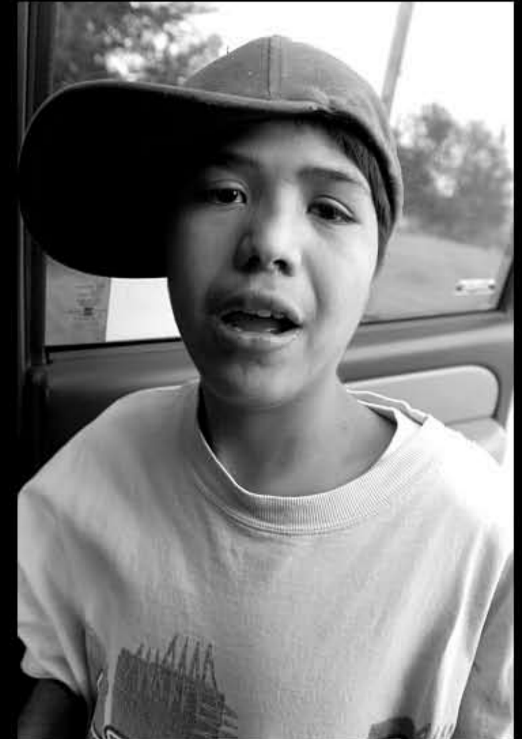
SD Manderson 02