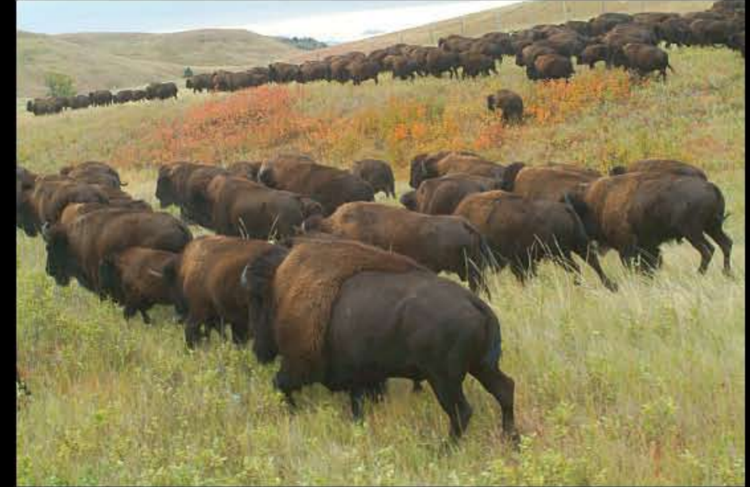
South Dakota Buffalo Roundup 09